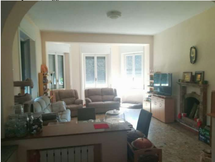
Piano primo, soggiorno-cucina