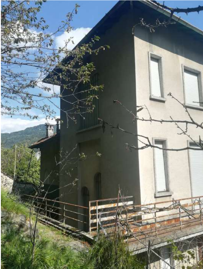
Prospetto nord dal giardino