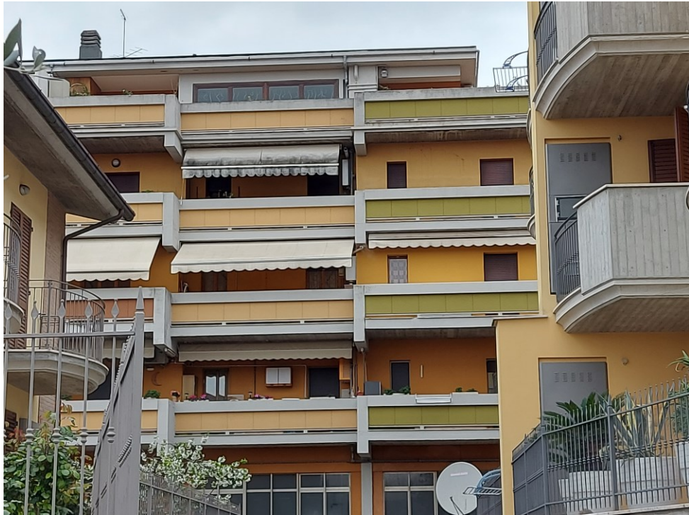
FOTO DEL FABBRICATO DA NORD