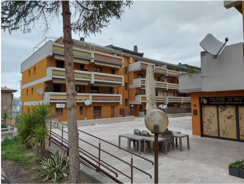
FOTO DEL FABBRICATO DAL PIAZZALE ANTISTANTE A SUD