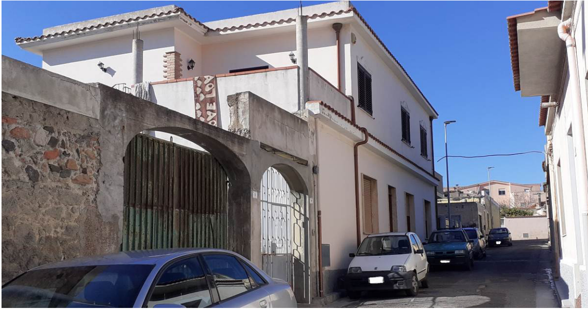
Prospetto sulla Via Venezia