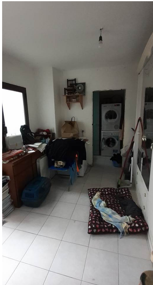
Locale di sgombero