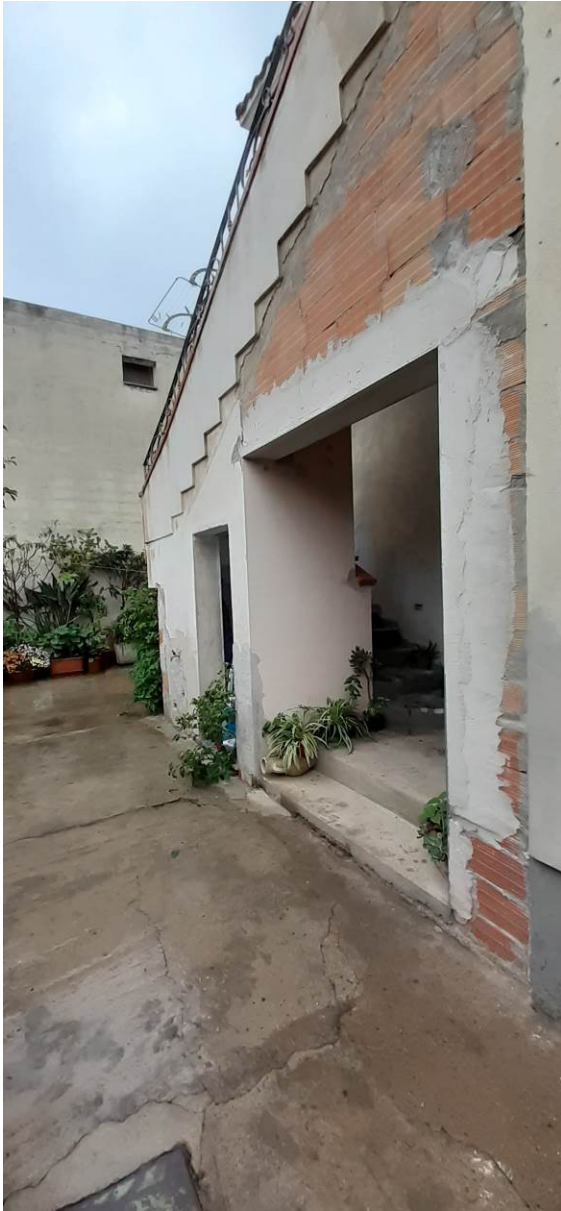
Area esterna e scala