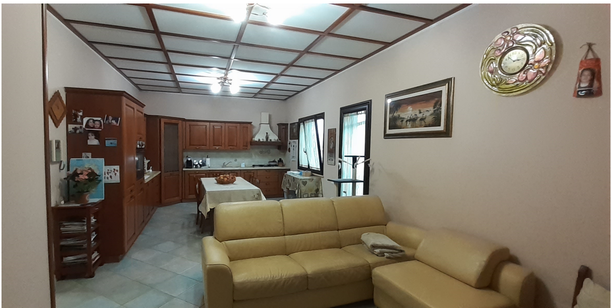
Soggiorno con angolo cottura