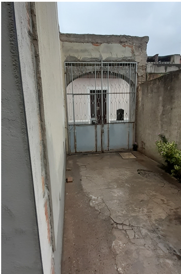
Portone d'ingresso e area esterna