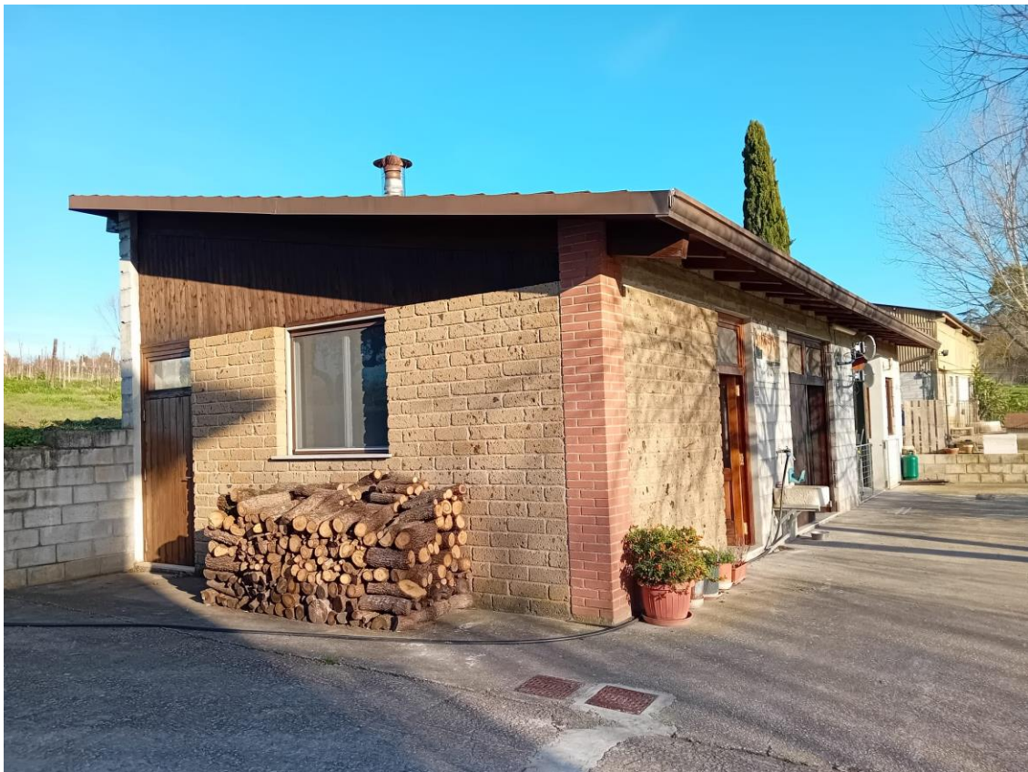
Foto n. 4__ Vista complessiva