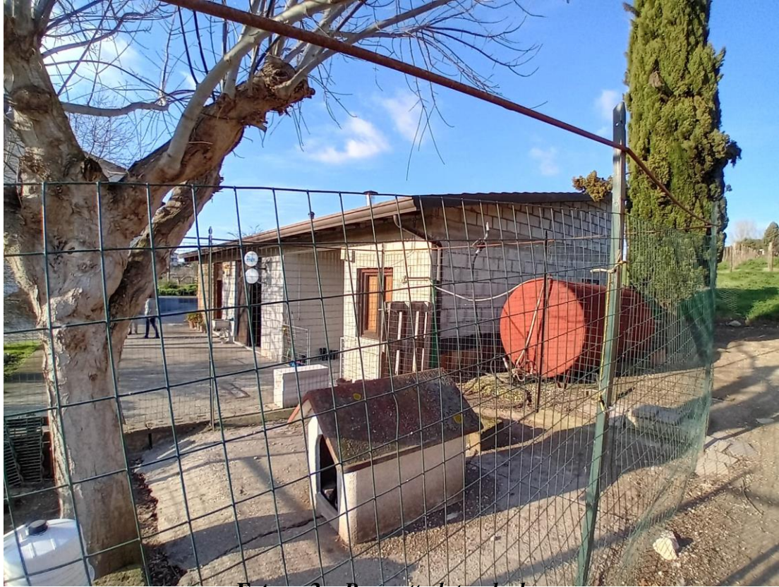
Foto n. 3__ Prospetto laterale dx