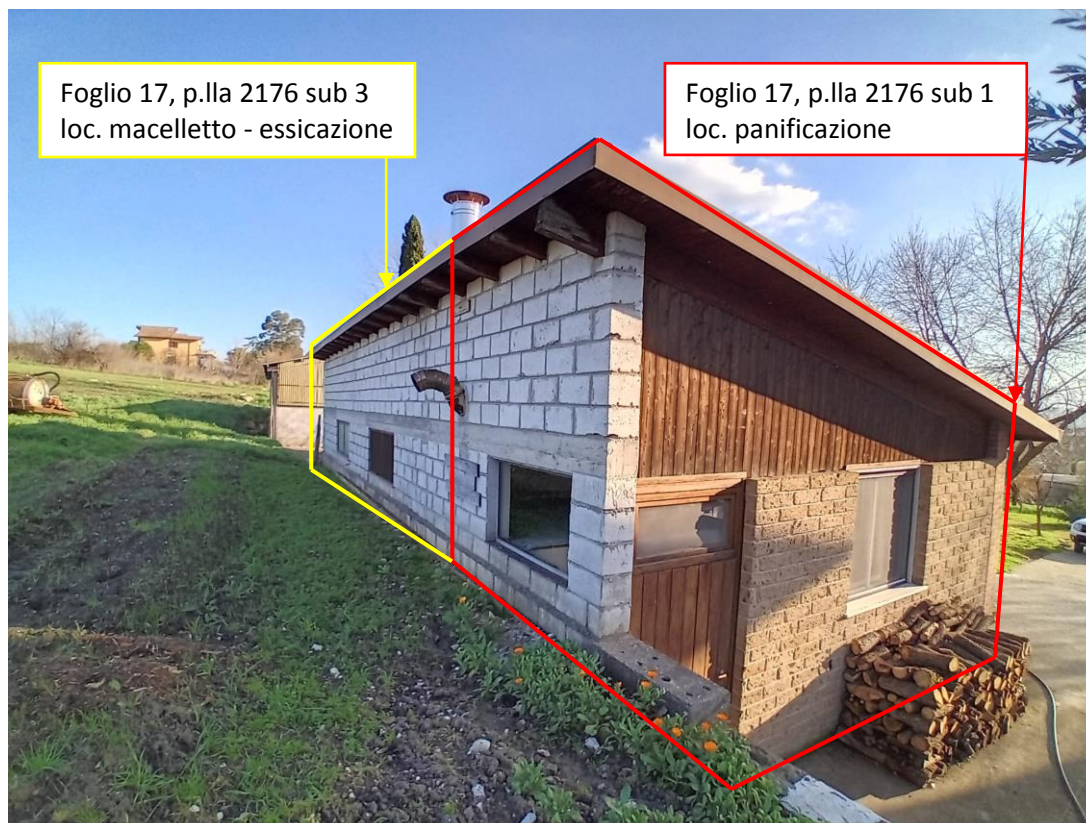
Foto n. 2__Prospetto laterale sx