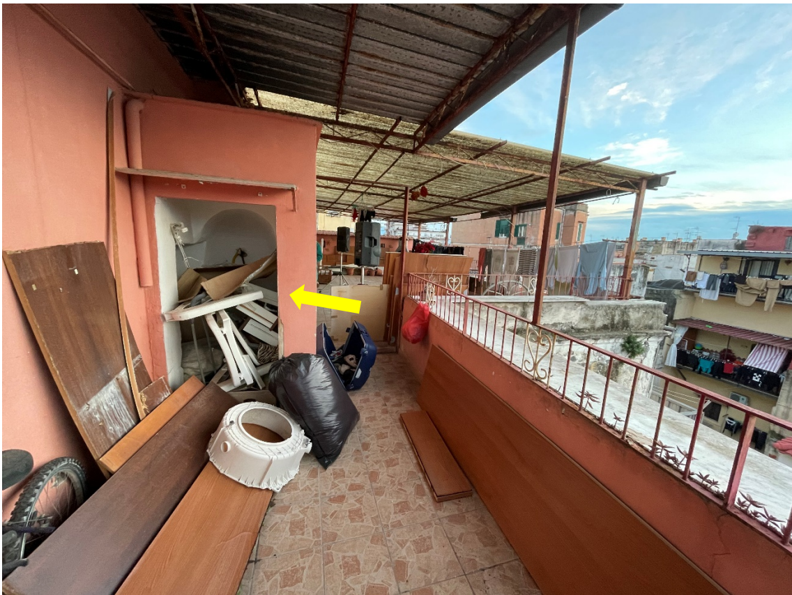
Secondo ripostiglio con accesso dal terrazzo a livello