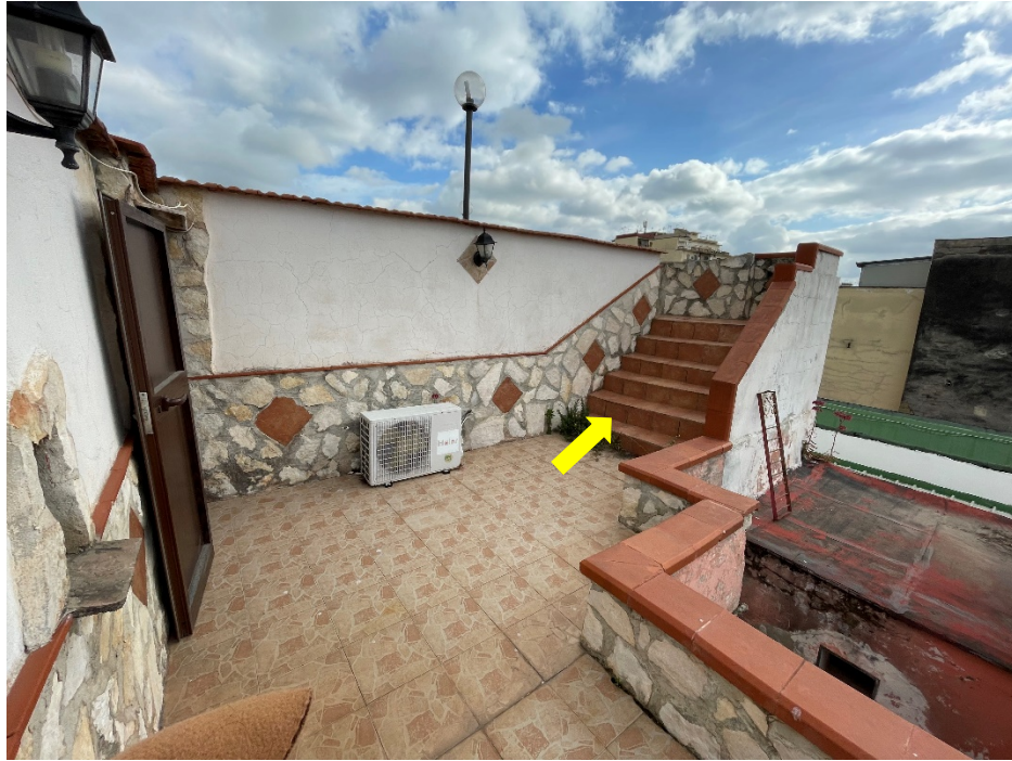
Si evidenziano le scale che conducono al terrazzo di copertura al terzo piano