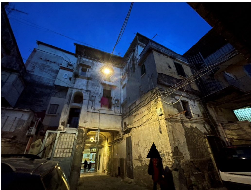
Prospetto sul cortile interno. Si evidenzia il terrazzo a livello dell'immobile staggito