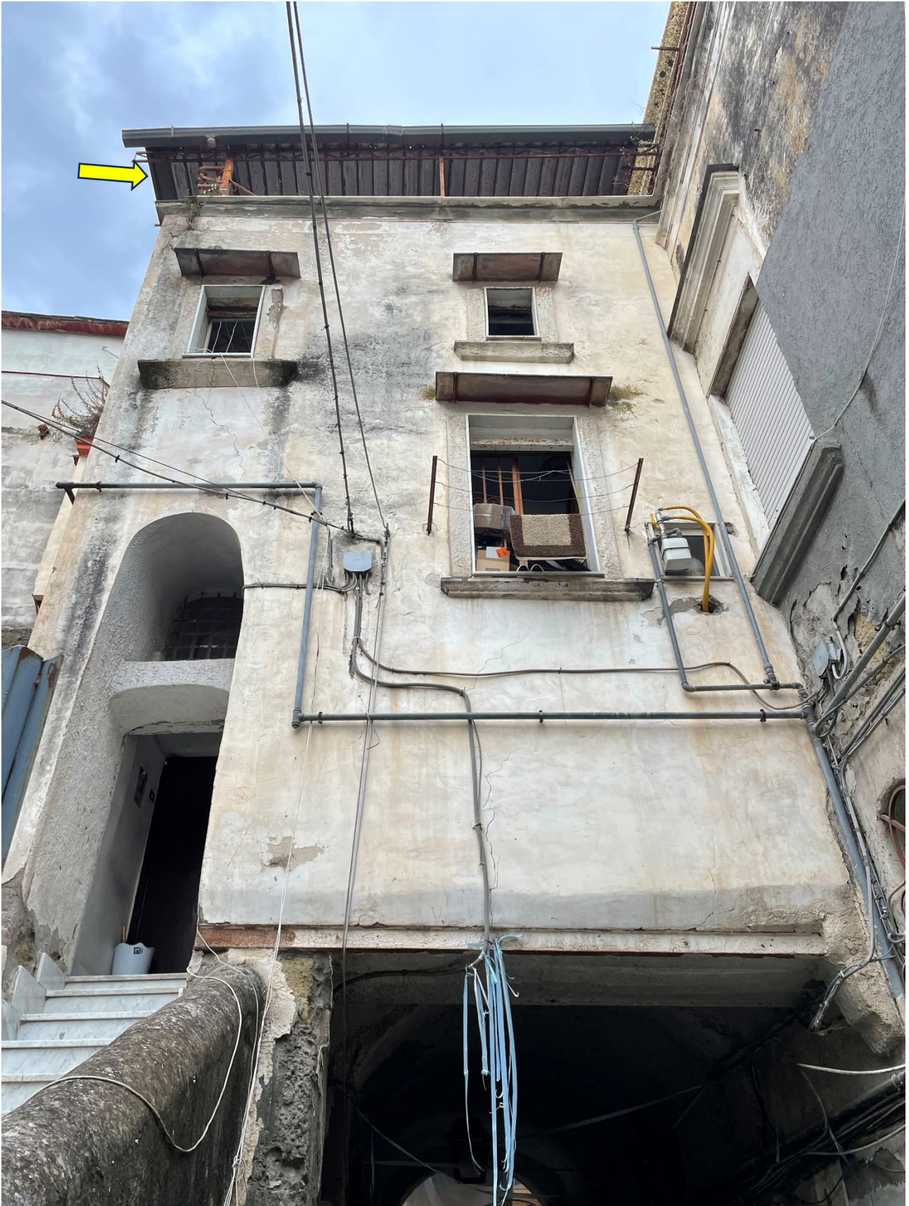
Prospetto sul cortile interno. Si evidenzia il terrazzo a livello dell'immobile coperto da tettoia in lamiera