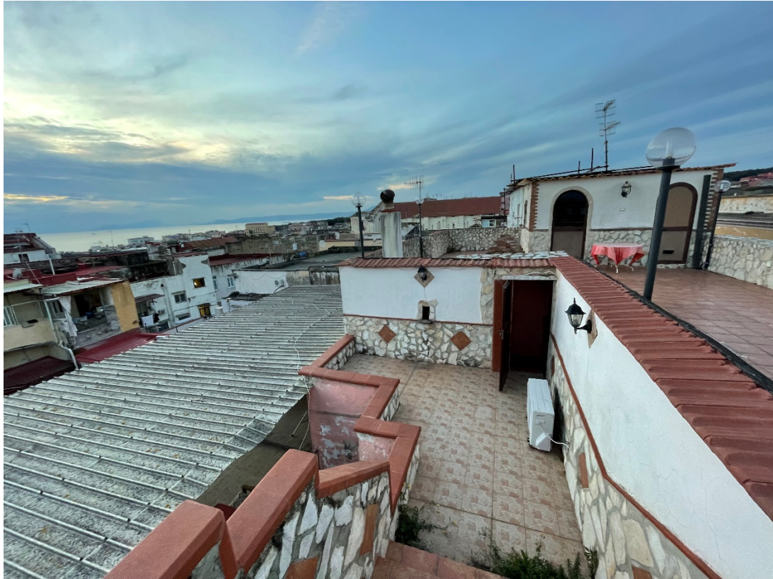
Veduta di entrambi i terrazzi di copertura