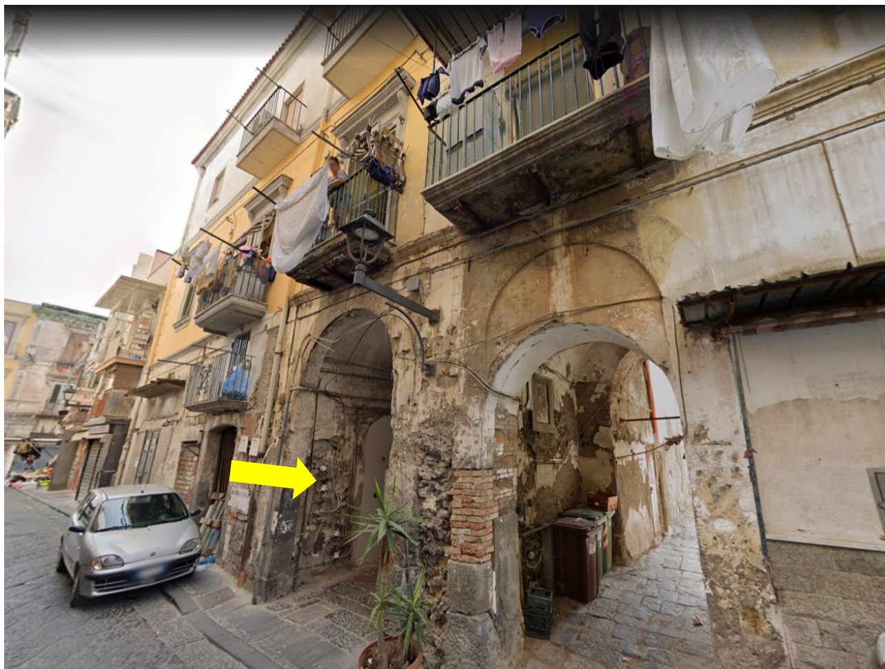
Fabbricato del fabbricato su Via Fontana 41 – Ercolano (NA)

Si evidenzia l'ingresso al cortile comune