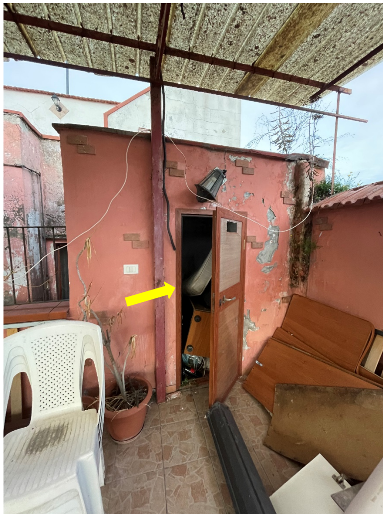
Primo ripostiglio con accesso dal terrazzo a livello