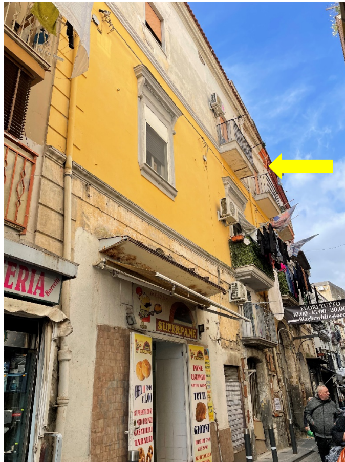
Prospetto principale su via Fontana si evidenzia l'immobile staggito