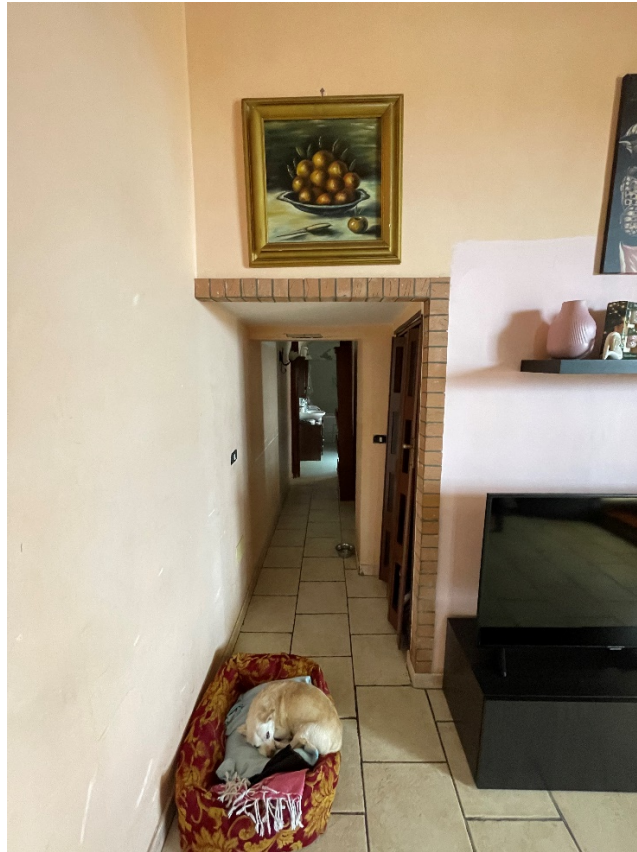
Disimpegno di accesso ai bagni