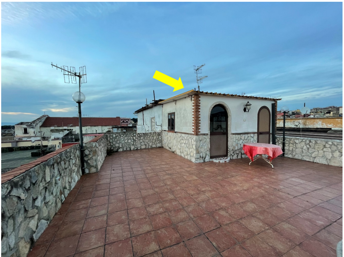
Si evidenzia il manufatto sul terrazzo di copertura al terzo piano