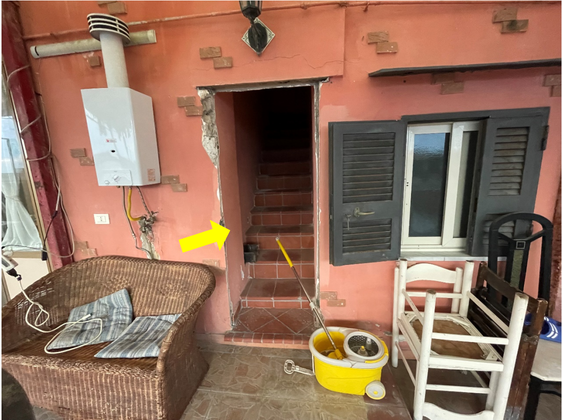
Scale di accesso ai terrazzi di copertura