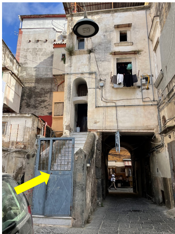
Prospetto sul cortile interno. Si evidenziano le scale comuni d'accesso all'immobile staggito