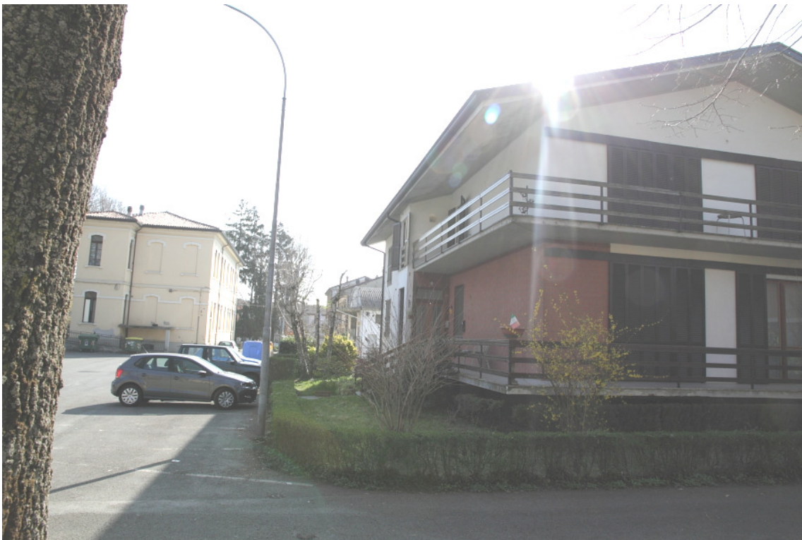
Foto 6 palazzina lotto 1 e 2 inquadrata da Piazza Mignani