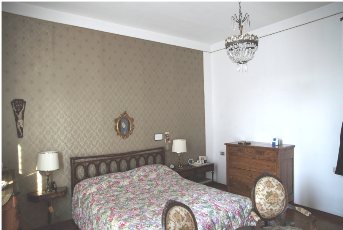
Foto 8 palazzina lotto 1 e 2 una camera da letto