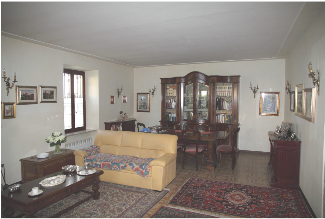
Foto 14 interno abitazione lotto 3 la sala