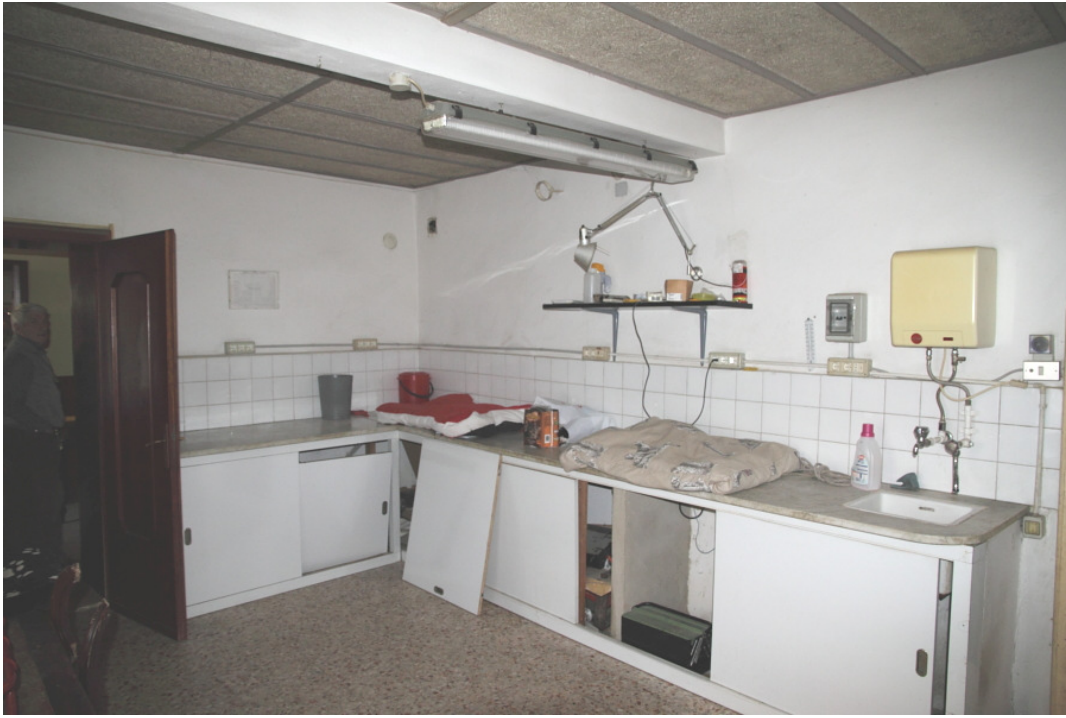
Foto 17 interno abitazione lotto 3 lavanderia