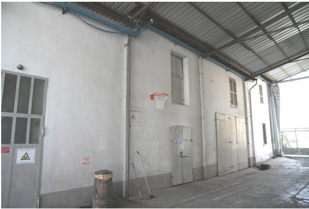
Foto 18 abitazione del custode e depositi lotto 4 vista dal cortile