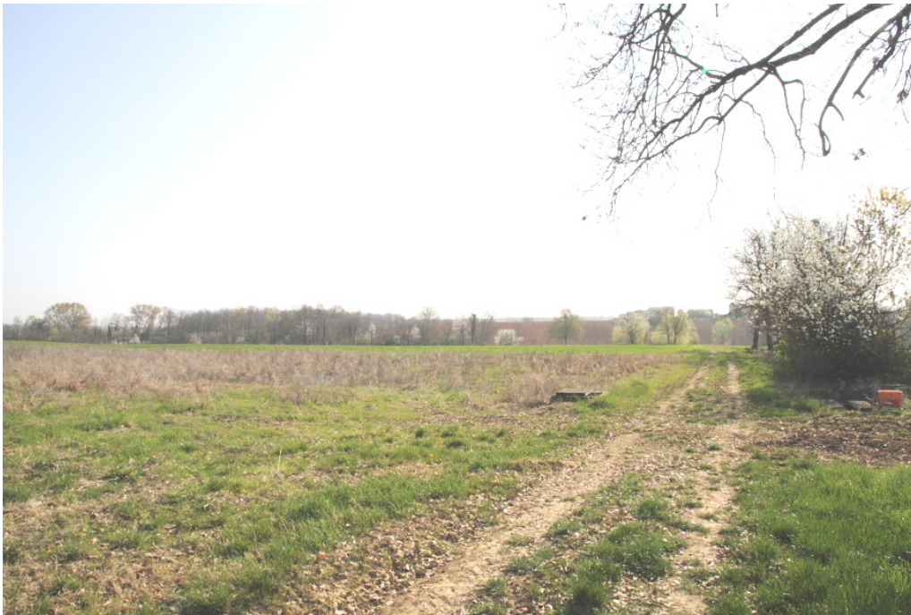
Foto 24 terreni lotto 5 vista dalla calaia vicinale