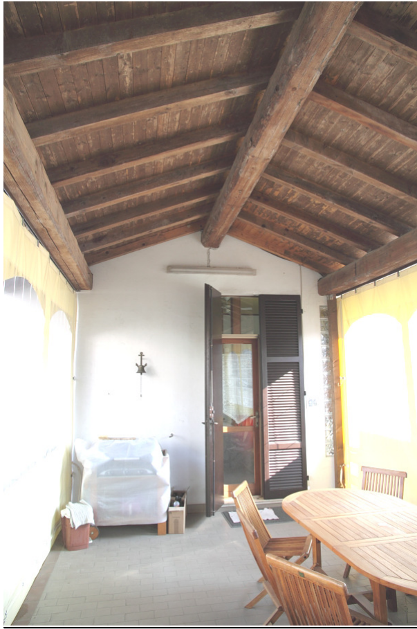
Foto 9 palazzina lotto 1 e 2 la veranda