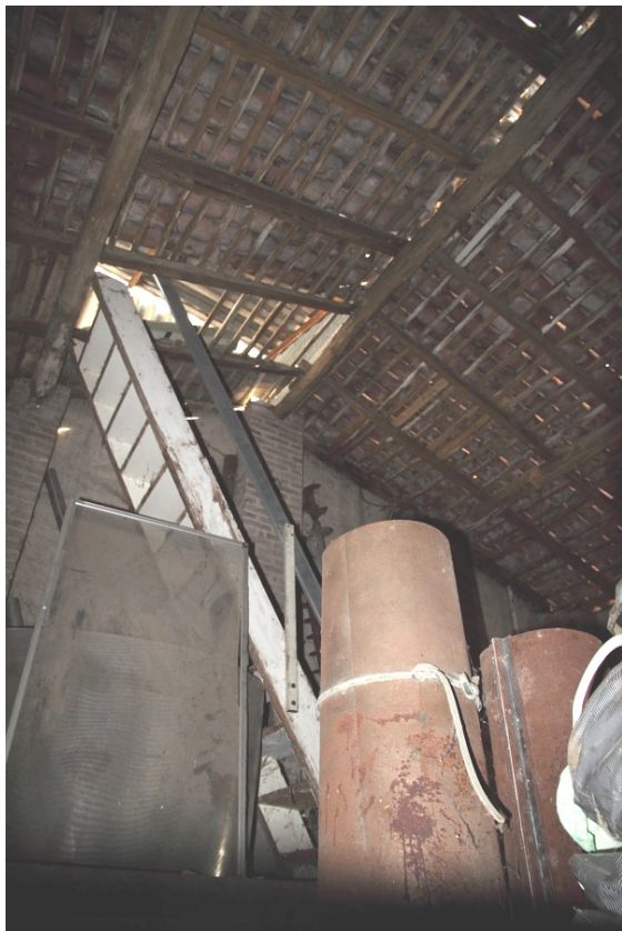
Foto 22 depositi lotto 4 vista della copertura