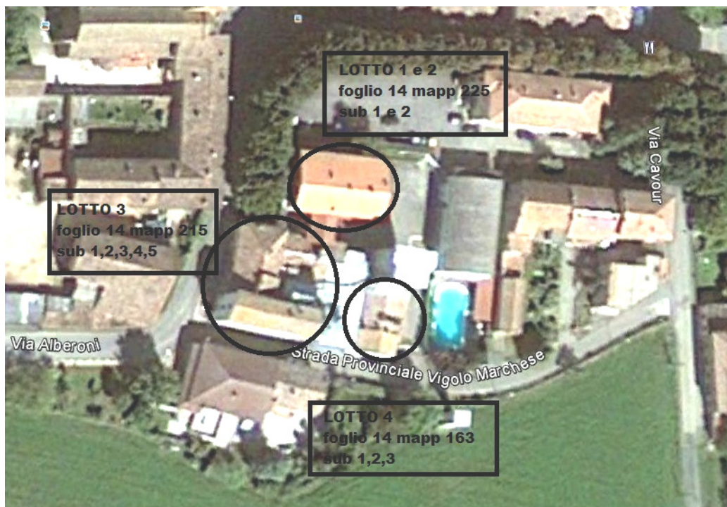
Foto 2 individuazione dei fabbricati