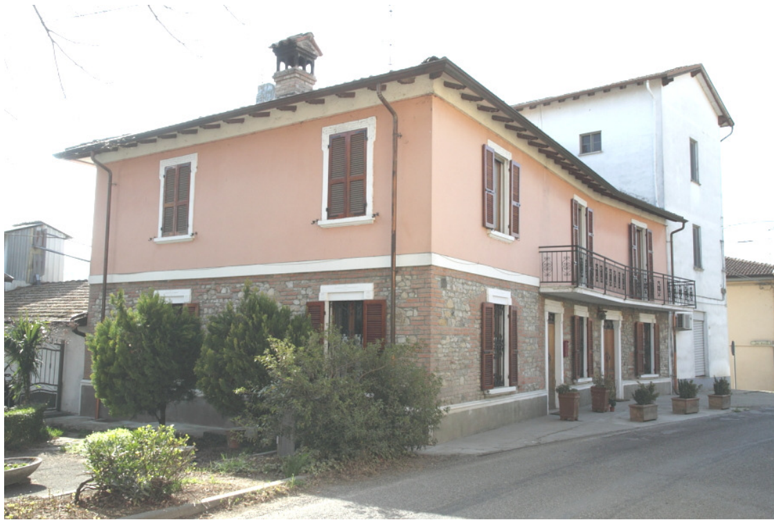
Foto 10 palazzina lotto 3 inquadrata da Piazza Mignani