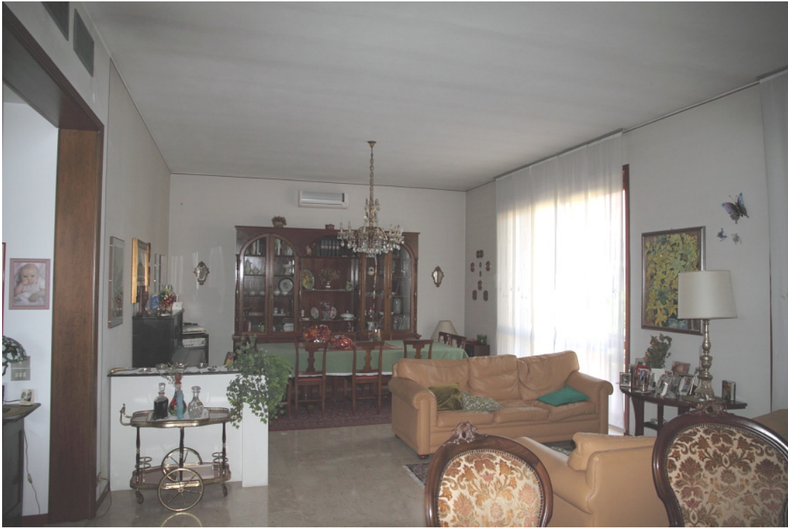
Foto 7 palazzina lotto 1 e 2 la sala principale