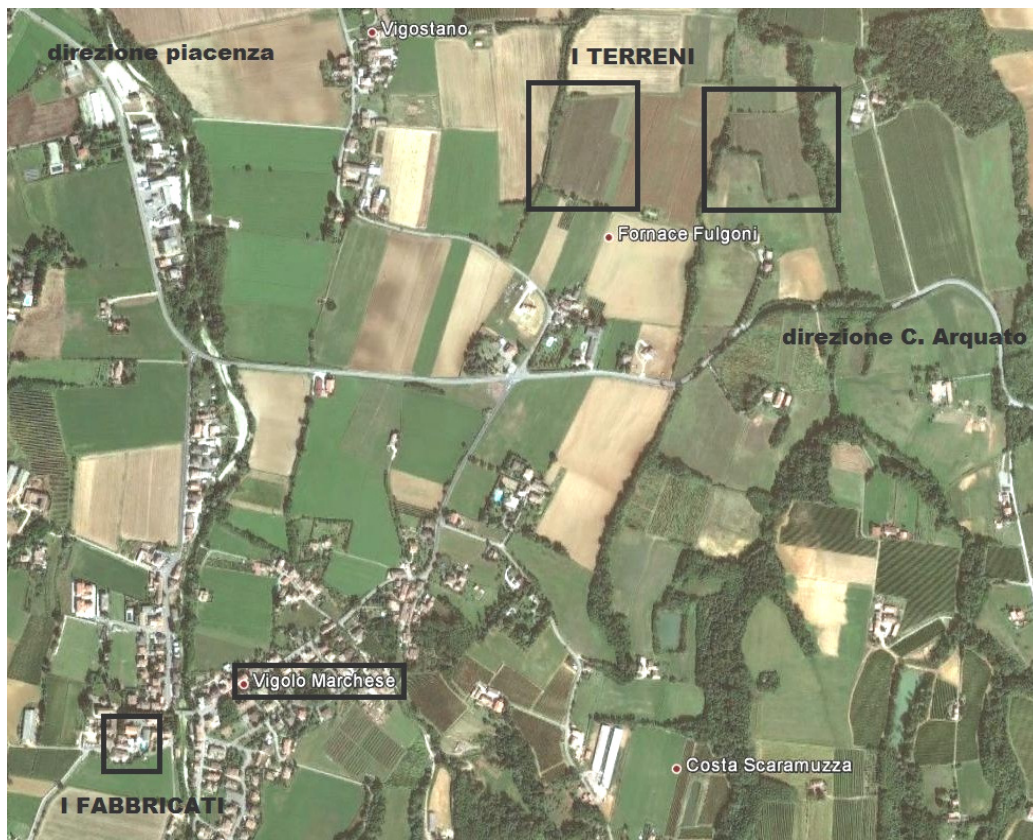
Foto 1 individuazione dei beni rispetto al territorio