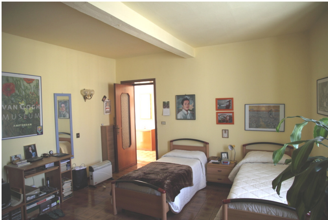
Foto 16 interno abitazione lotto 3 una camera