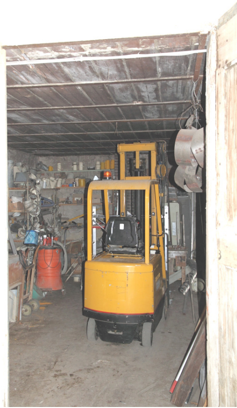
Foto 21 depositi lotto 4 vista dal cortile