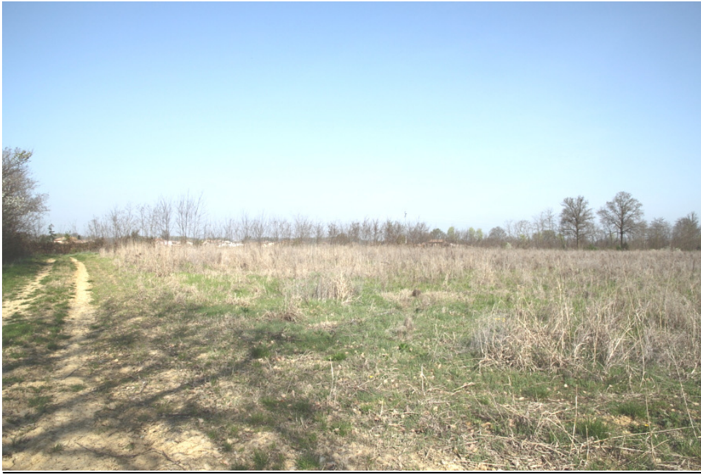
Foto 25 terreni lotto 5 vista dalla calaia vicinale