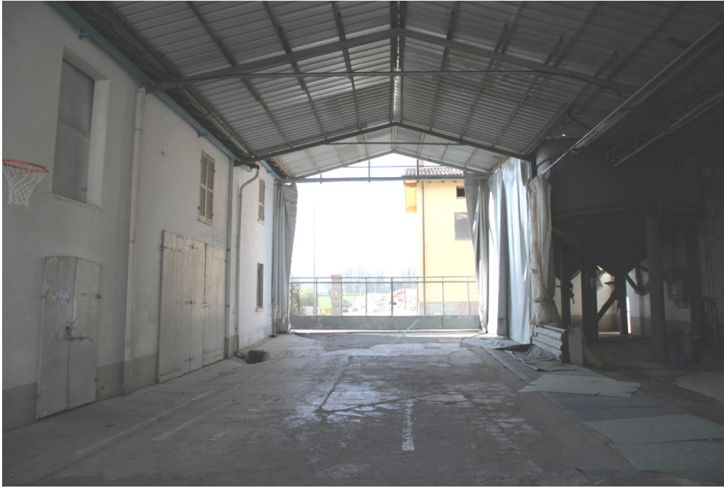
Foto 23 depositi lotto 3 e 4 tettoie comuni viste dal cortile