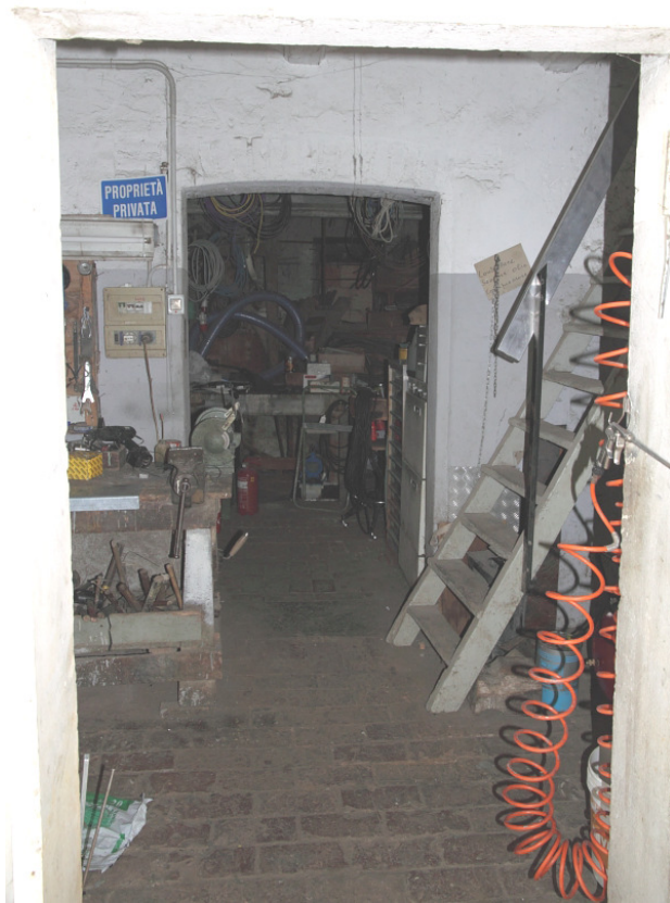
Foto 20 depositi lotto 4 vista dal cortile