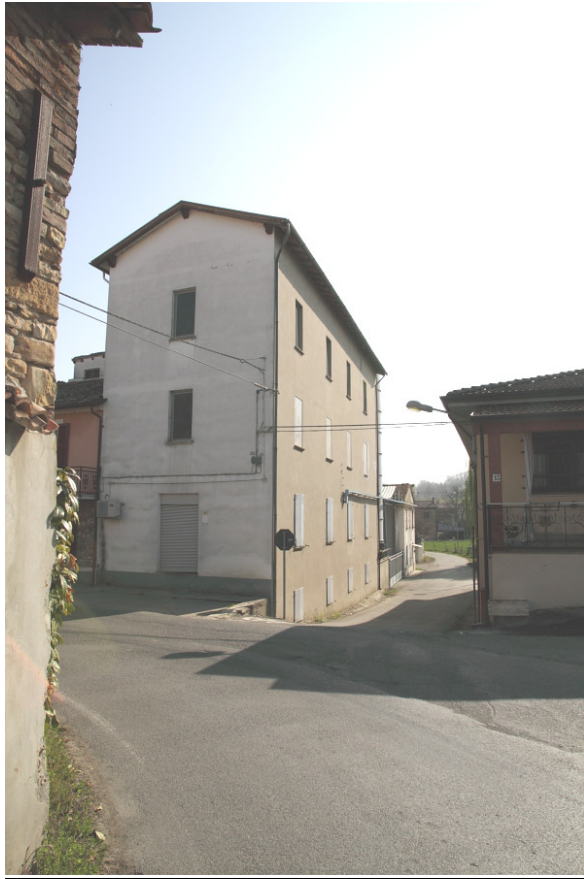
Foto 11 opificio lotto 3 inquadrato da Via Alberoni