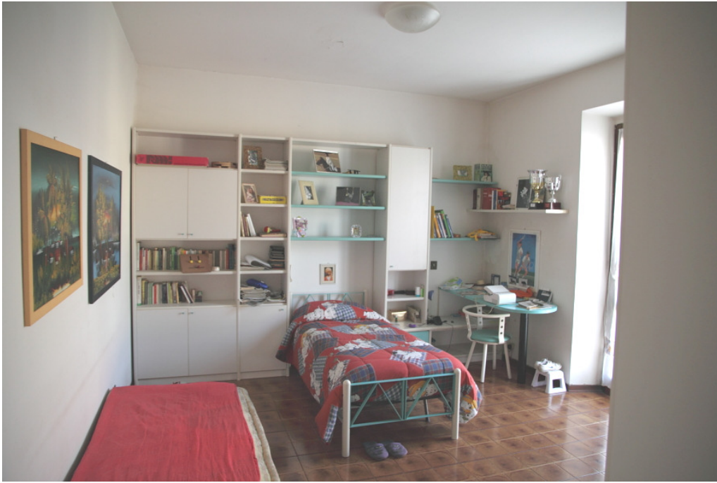
Foto 15 interno abitazione lotto 3 una camera