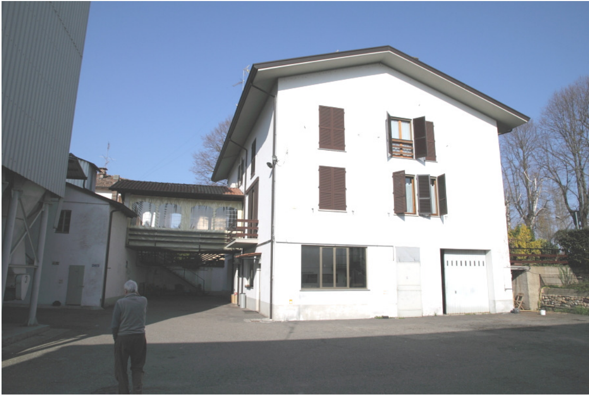
Foto 5 palazzina lotto 1 e 2 inquadrata dal cortile dell'opificio