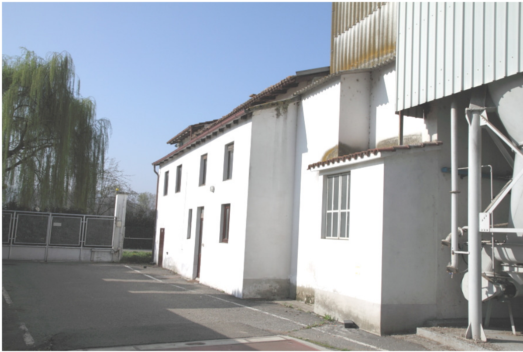
Foto 19 abitazione del custode e depositi lotto 4 vista dal retro