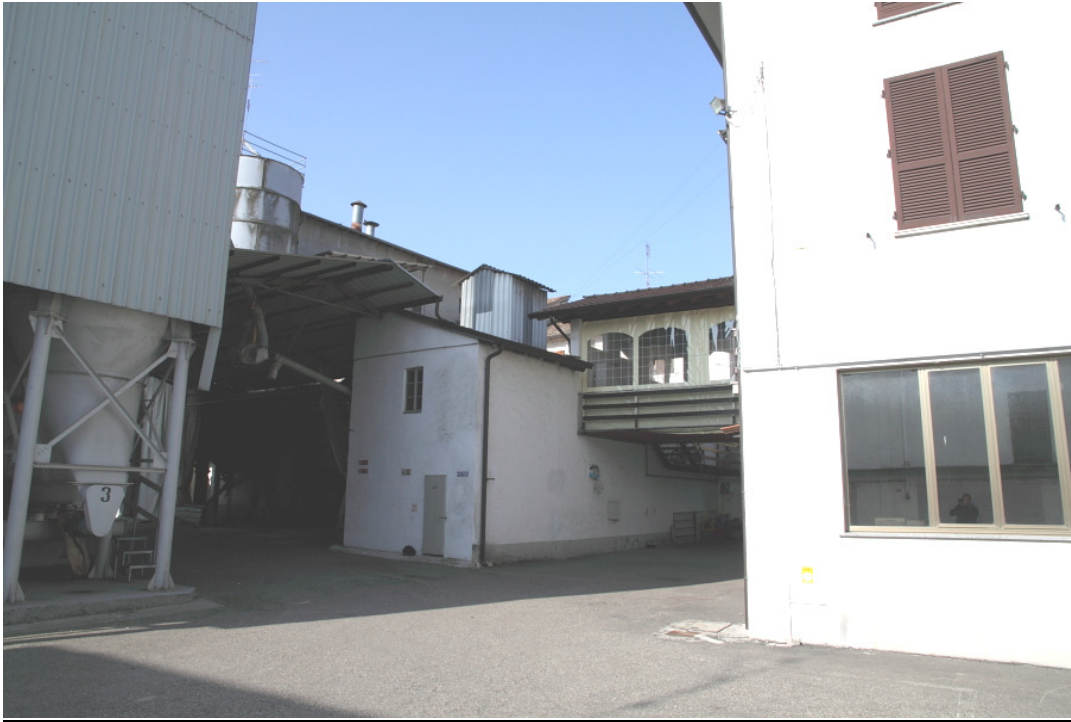
Foto 13 opificio lotto 3 inquadrata dall'interno del cortile