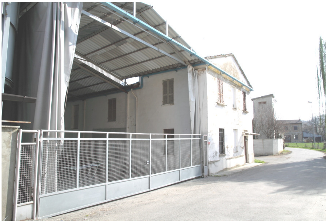
Foto 12 opificio lotto 3 inquadrato da Via del Mulino