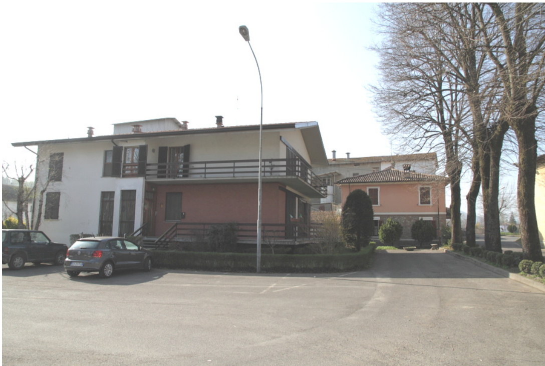
Foto 4 palazzina lotto 1 e 2 inquadrata da Piazza Mignani