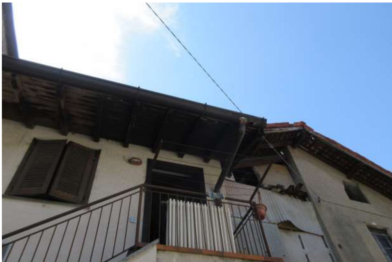
La lattoneria del tetto risulta bucata in diversi punti