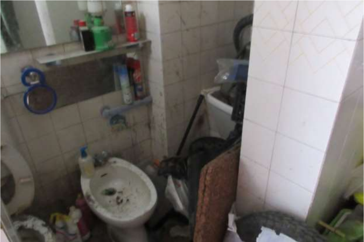
Locale W.C. in pessime condizioni di manutenzioni con segni di rigurgito dalla tazza w.c.