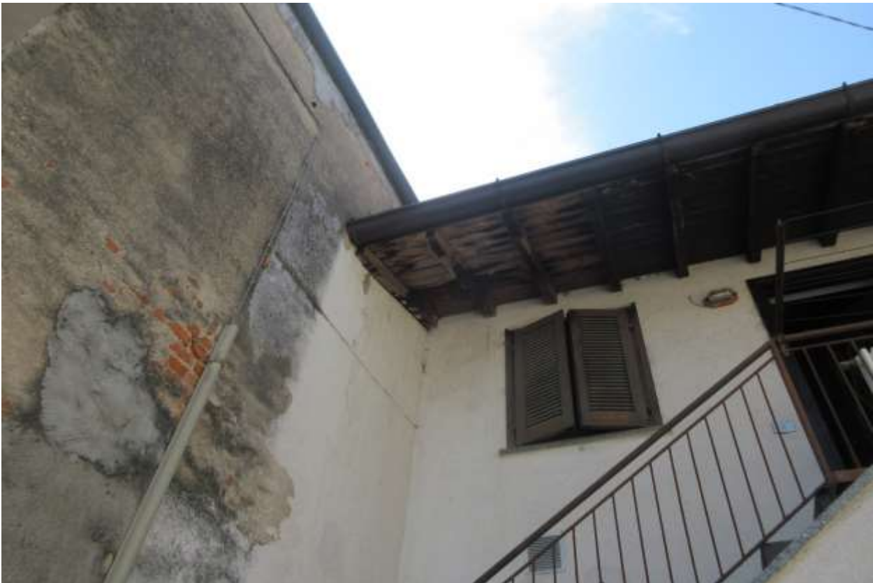
Sono visibili segni inequivocabili d'infiltrazioni sulla gronda del fabbricato