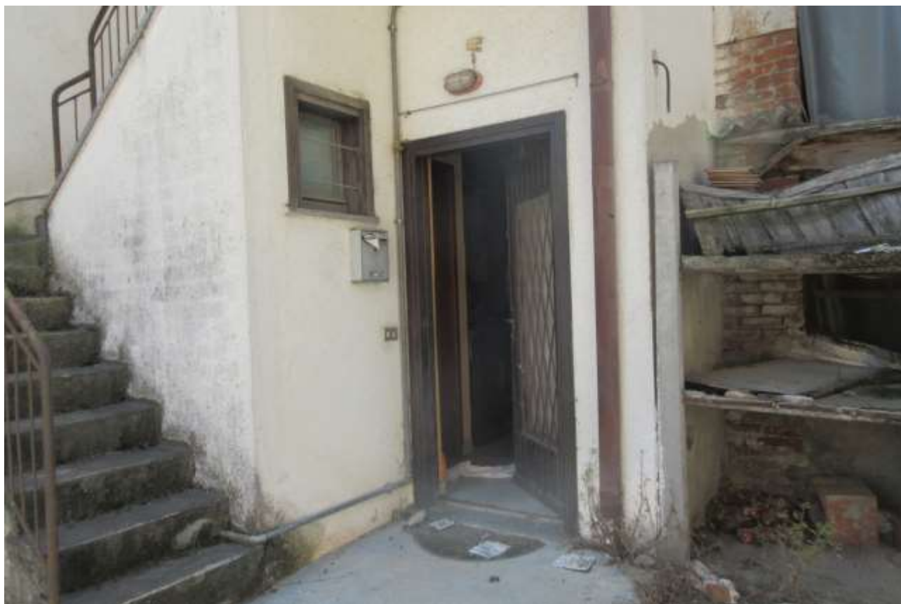
Ingresso al piano terra con vista della finestra del bagno