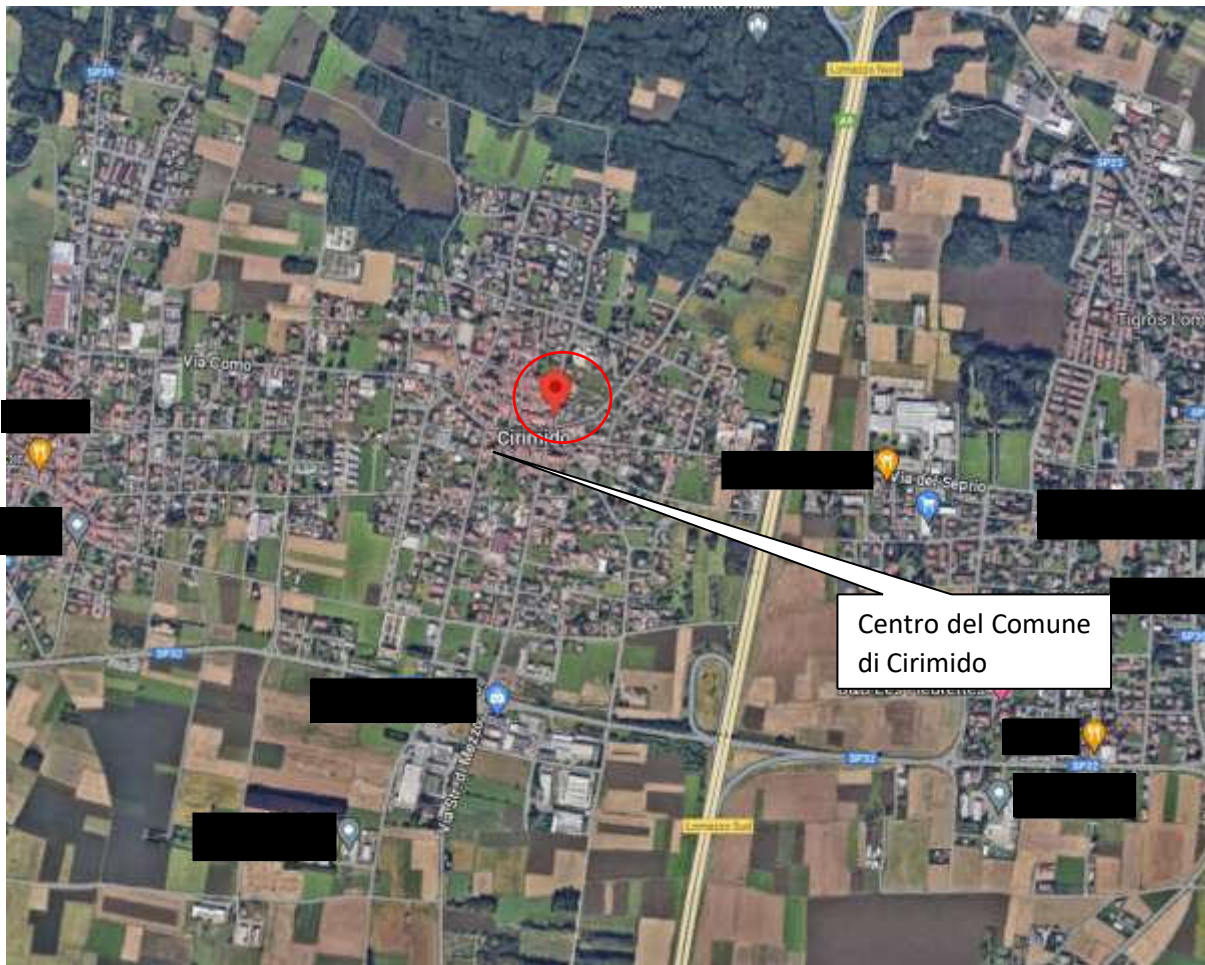
Estratto di Google Maps del Comune di Cirimido