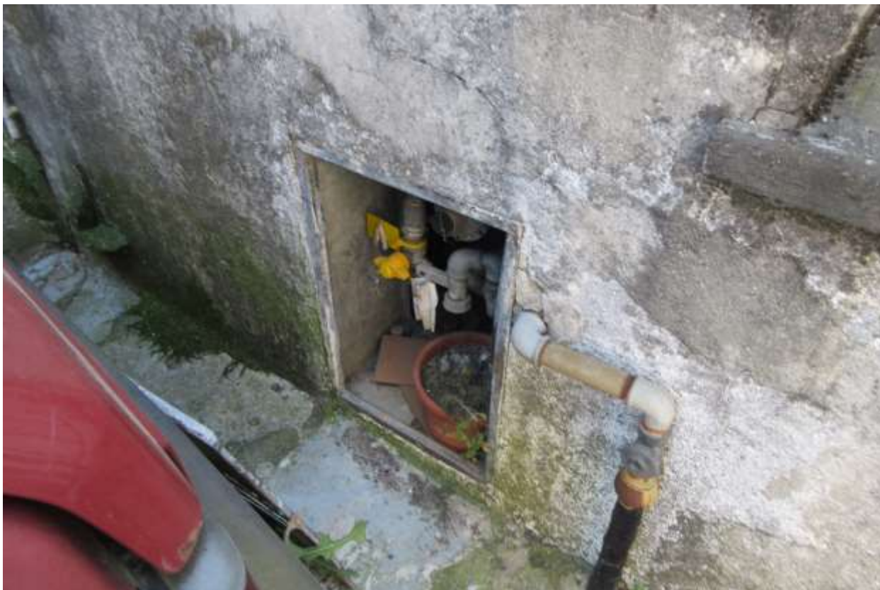
La ditta erogatrice del gas metano ha rimosso il contatore