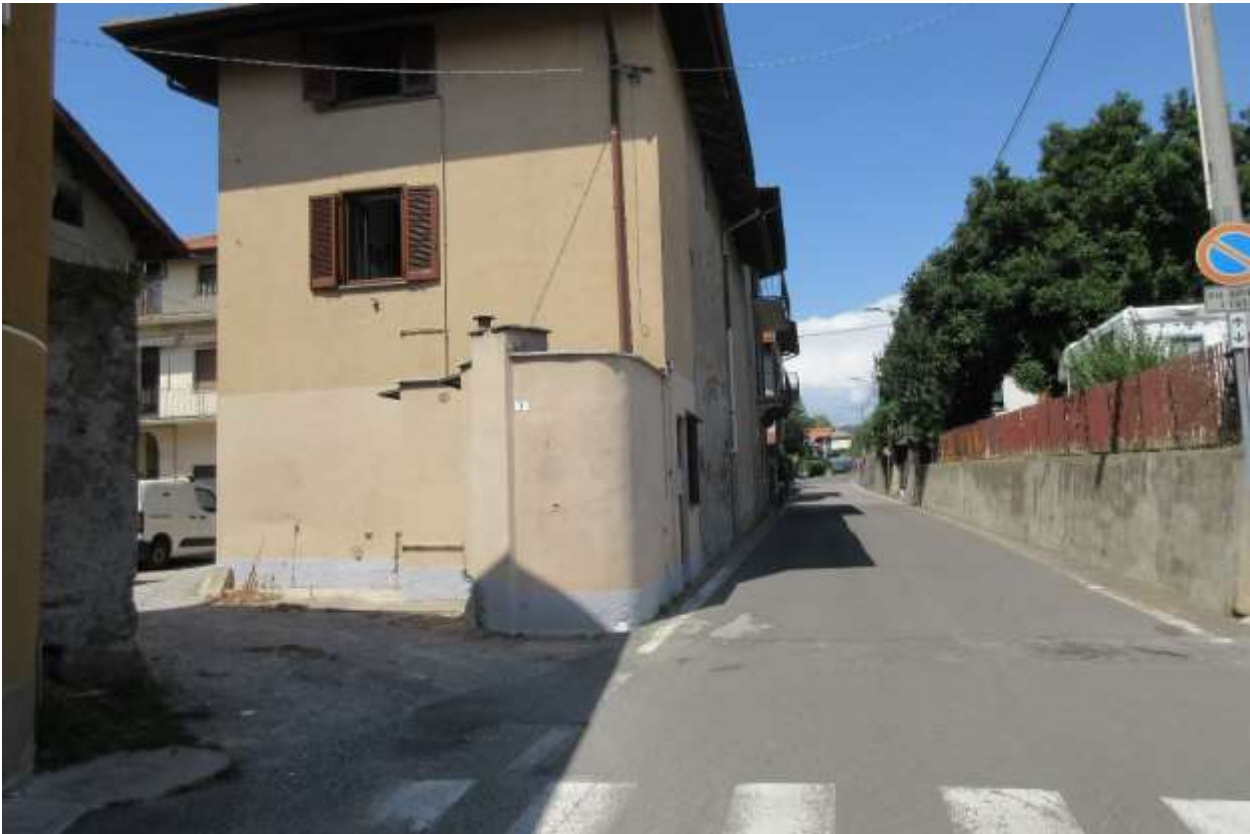
Ingresso corte dalla Via Roma

Fotografie scattate nel sopralluogo effettuati il giorno 02/08/2024