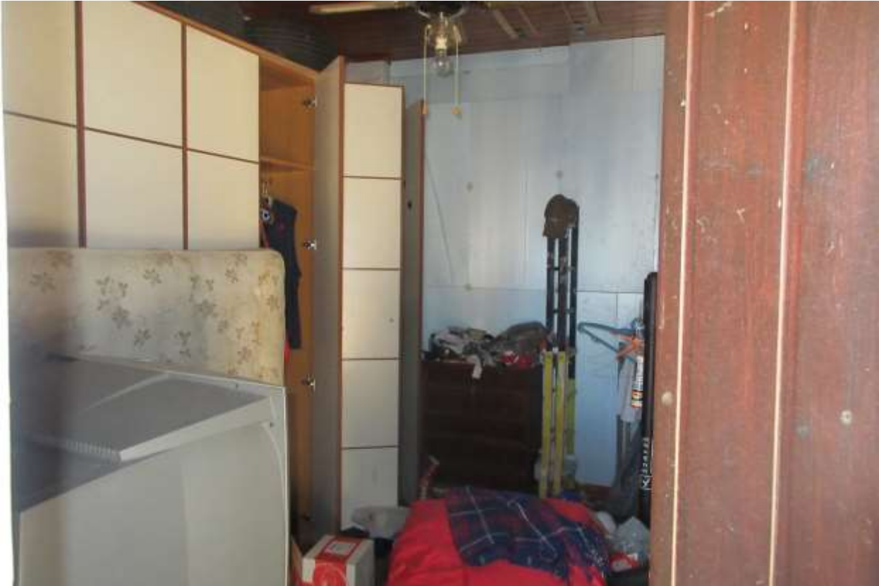
Sulla parete opposta dell'ingresso, è visibile la posa di pannelli termici sulla parete verticale