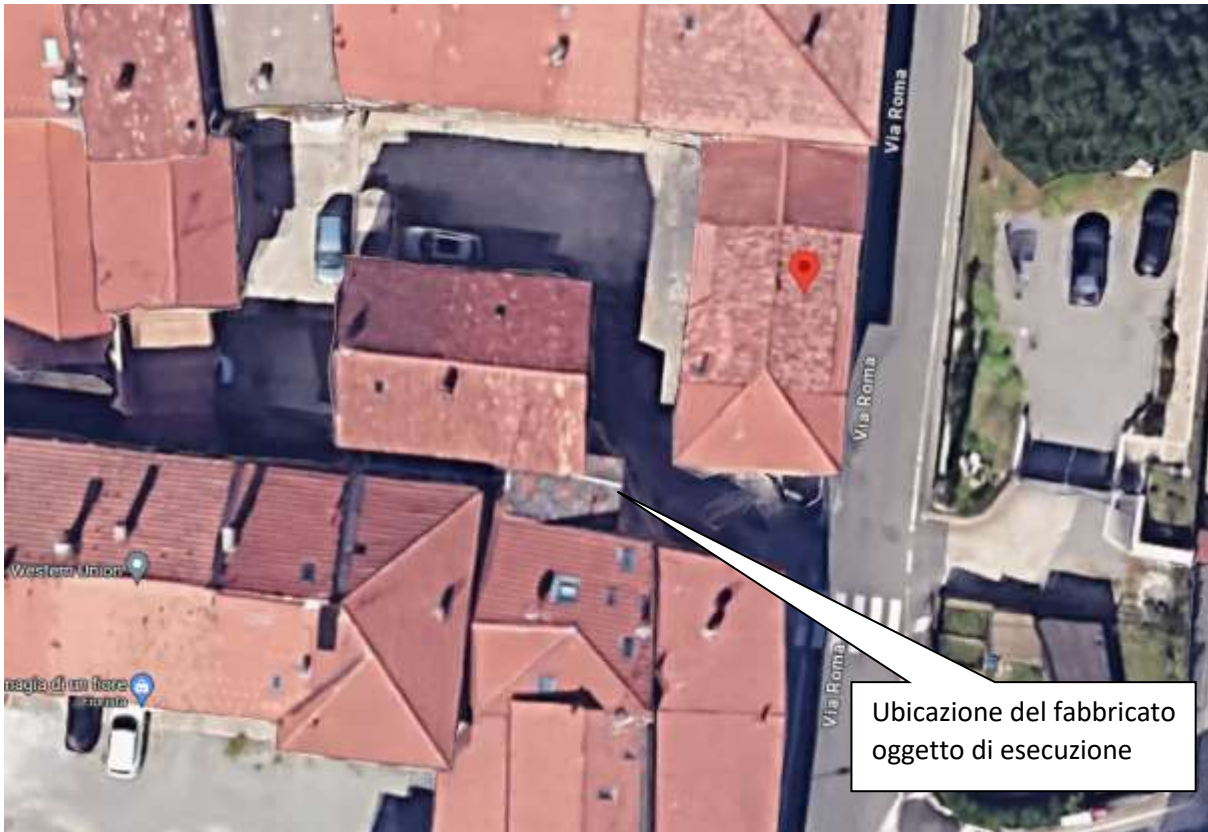
Estratto di Google Maps del Comune di Cirimido Via Roma n° 3