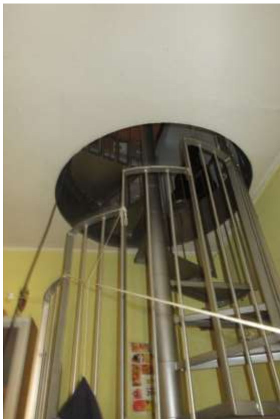
Vista della scala a chioccola che collega il piano terra al piano primo