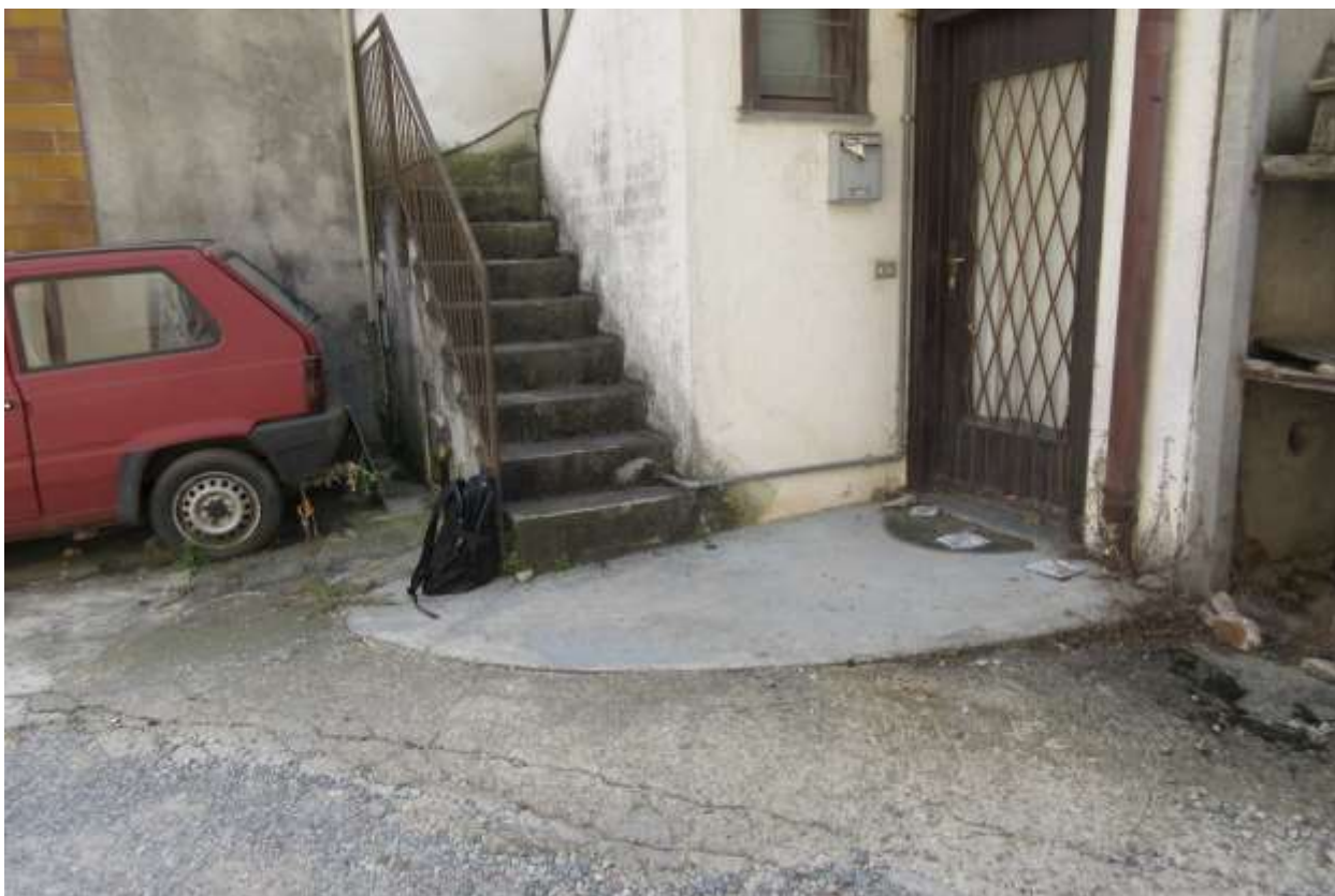
Dalla planimetria catastale non risulta di proprietà la porzione di terreno antistante il fabbricato, anche se risulta pavimentata con un battuto di cemento.