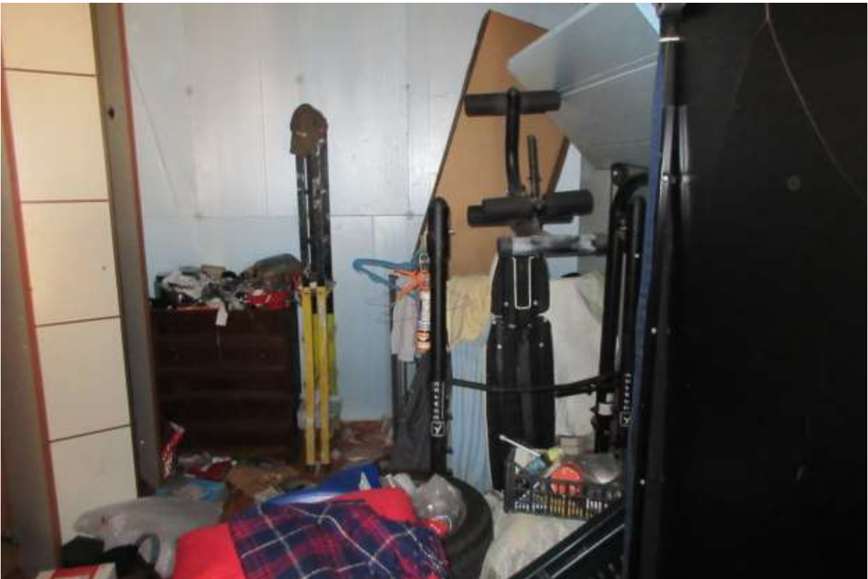
Come per gli altri locali dell'abitazione, è presente una quantità indescrivibile di materiale di varia natura accatastato alla rinfusa negli armadi e sul pavimento