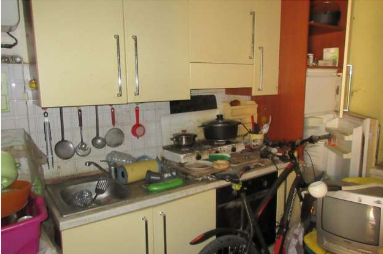
Vista del mobile cucina con piatto cottura sostituito con un piano d'appoggio