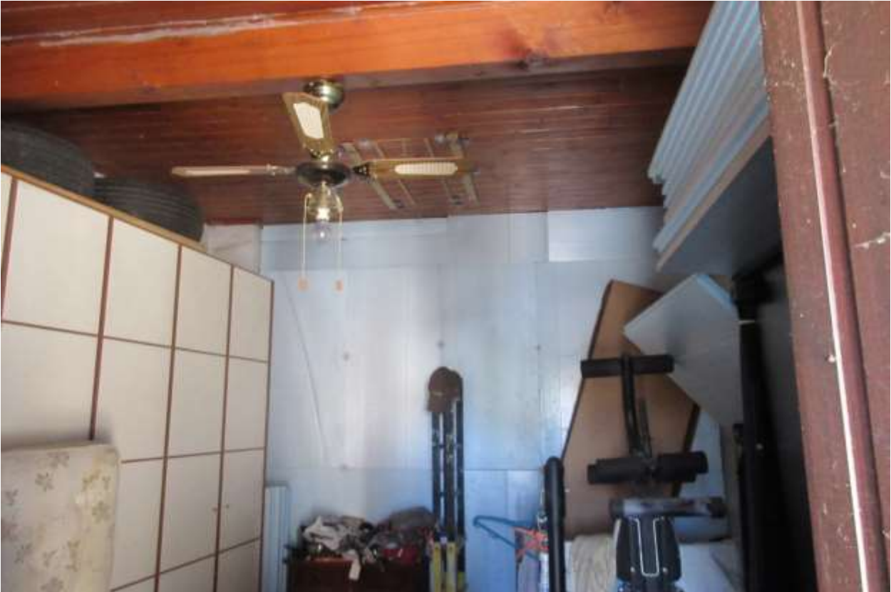
Locale al piano primo con accesso sia dall'esterno che tramite la scala a chioccola interna all'abitazione