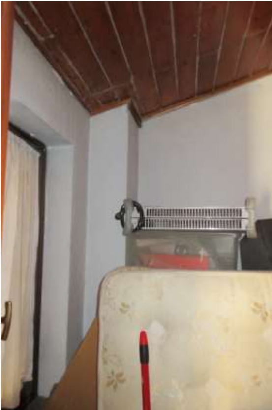
Nel locale al piano primo, è visibile la canna fumaria dove è stato posato il tubo di scarico che va al tetto della stufa a pellet posta al piano terra