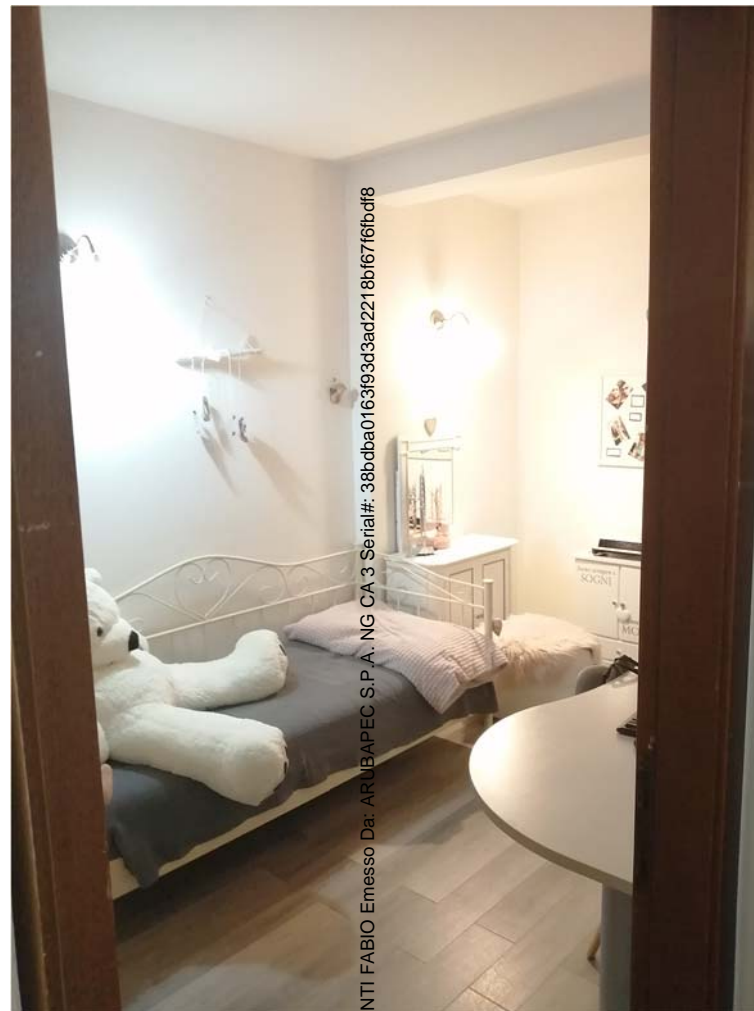
LOCALE ABUSIVO RICAVATO IN GARAGE

Firmato Da: SOTTIPIRELLI FABIO Emesso Da: ARUBAPEC S.P.A. NG CA 3 Serial#: 38bdba0163f93d3ad2218b167f61bdf8