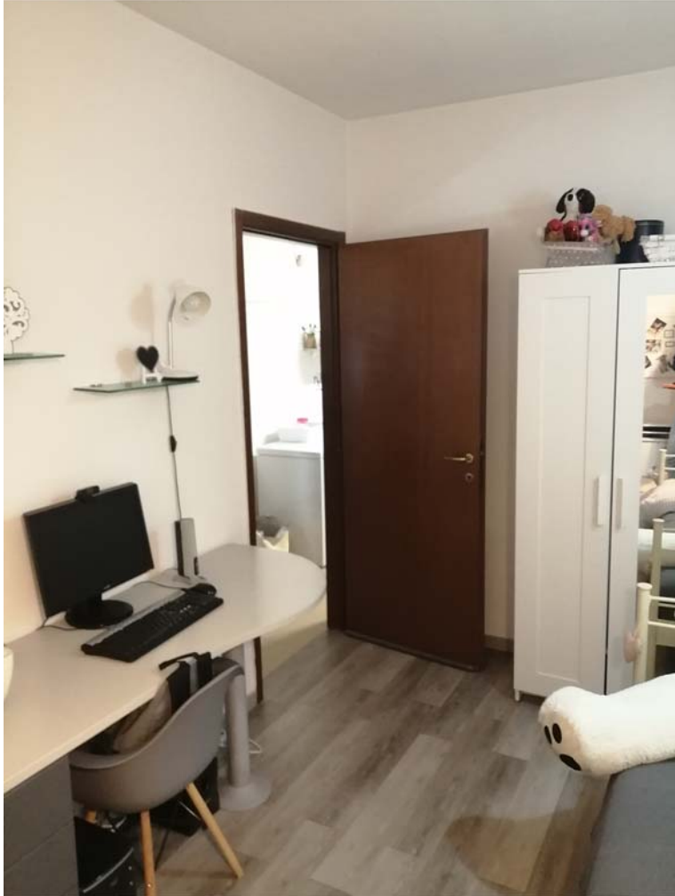
LOCALE ABUSIVO RICAVATO IN GARAGE