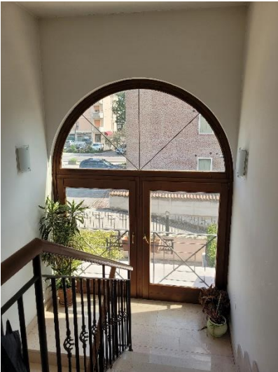
VANO SCALA E TERRAZZO (NON ACCESSIBILE)