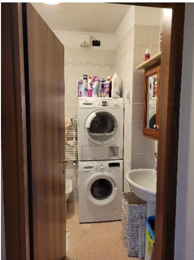
BAGNO NON FINESTRATO