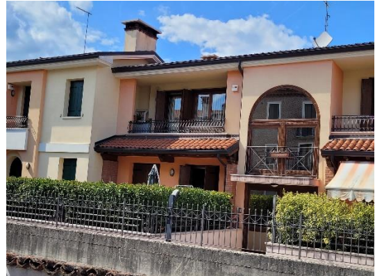
INGRESSO CONDOMINIO E FACCIATA