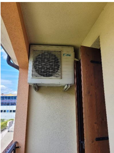
LOGGIA CON IMPIANTO CONDIZIONATORE