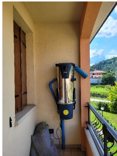
LOGGIA CON ASPIRAZIONE CENTRALIZZATA