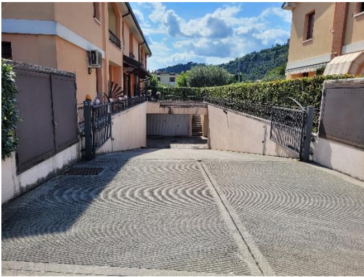
RAMPA ACCESSO AUTORIMESSE