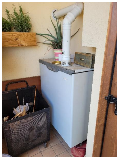
CENTRALE TERMICA ESTERNA