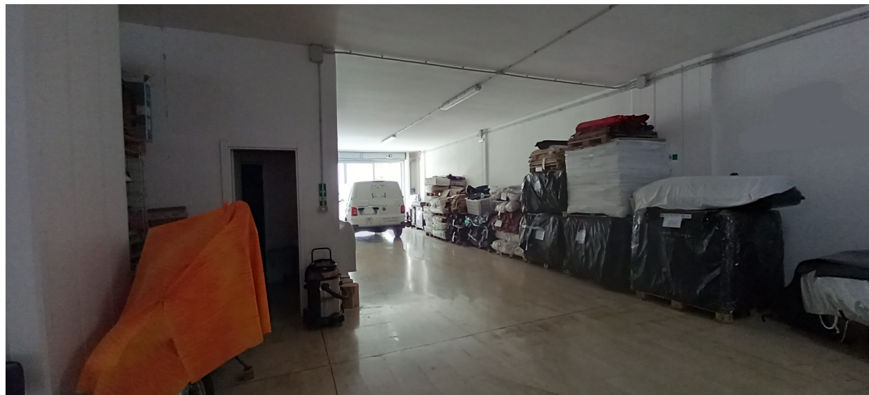
SUB 81 (P.LLA 25) – LOTTO 2