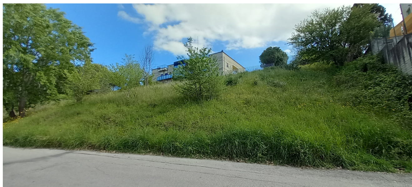
LOTTO 3 – TERRENI – VIA F.LLI CERVI - CONFINE OVEST