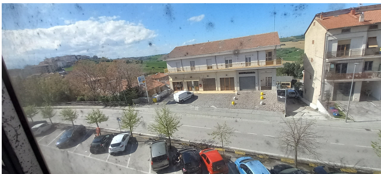
SUB 35 (P.LLA 878) – LOTTO 1- AFFACCIO SU VIA FERMANA NORD