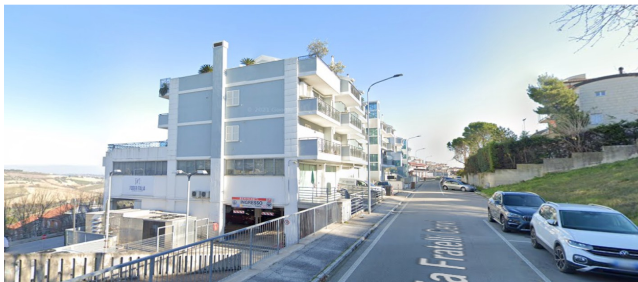
PROSPETTI OVEST E SUD - VIA F.LLI CERVI -