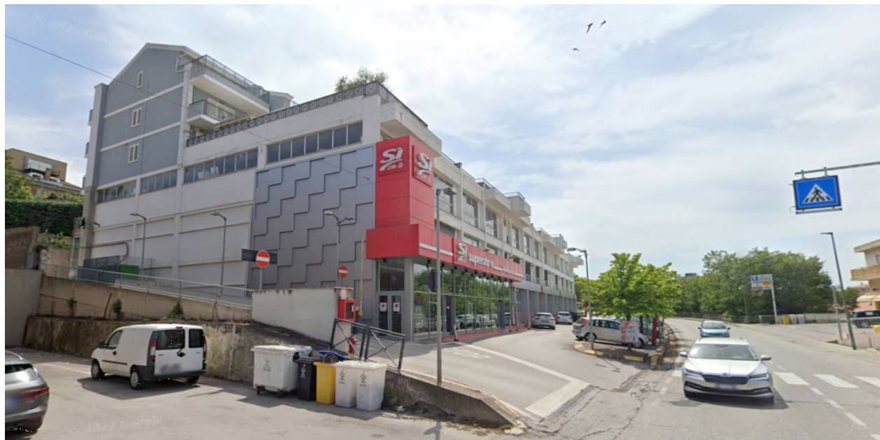
PROSPETTI NORD E EST - VIA FERMANA NORD