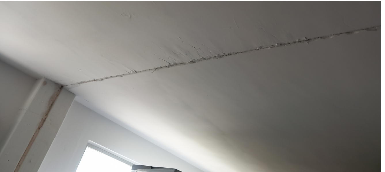
SUB 80 (P.LLA 25) – LOTTO 1