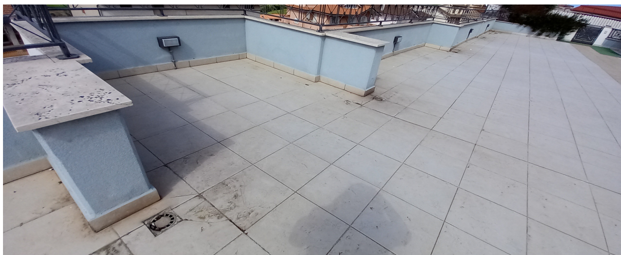
SOVRASTANTE LASTRICO CONDOMINIALE