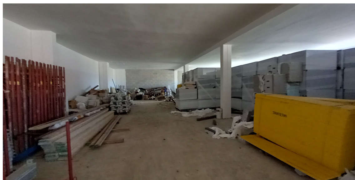
SUB 80 (P.LLA 25) – LOTTO 1