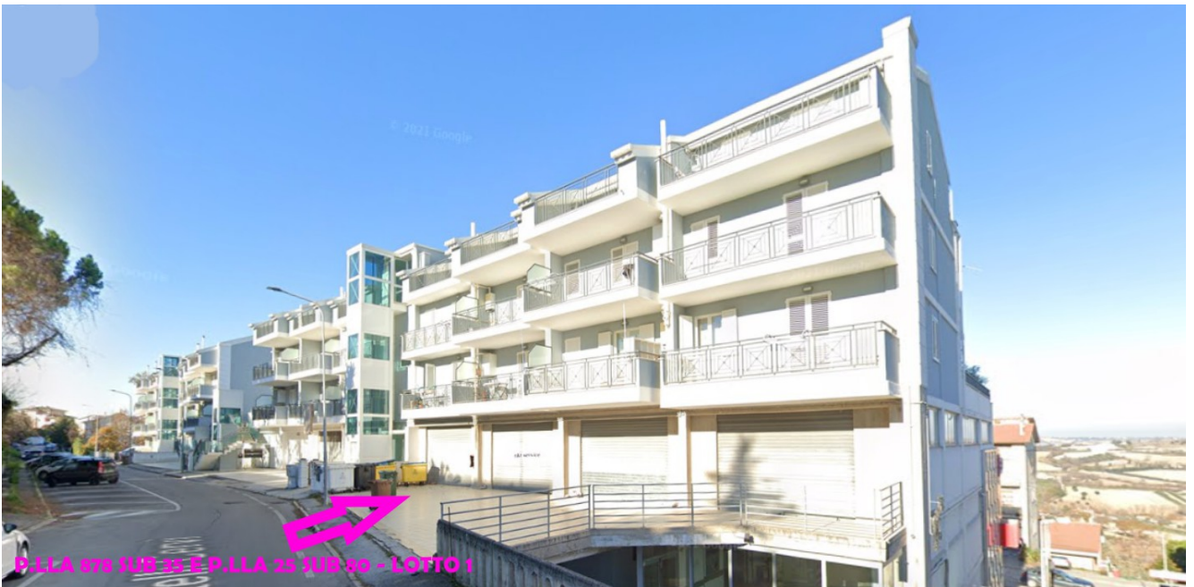
ACCESSO AI SUB 35 (P.LLA 878) E 80 (P.LLA 25) – LOTTO 1 - VIA F.LLI CERVI