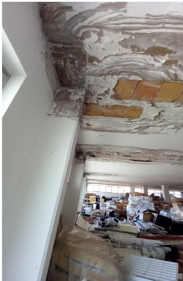
LOTTO 1- PREDISPOSIZIONE VANO W.C. - STATO DI CONSERVAZIONE