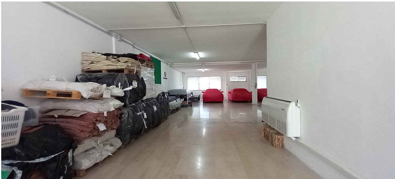
SUB 81 (P.LLA 25) – LOTTO 2