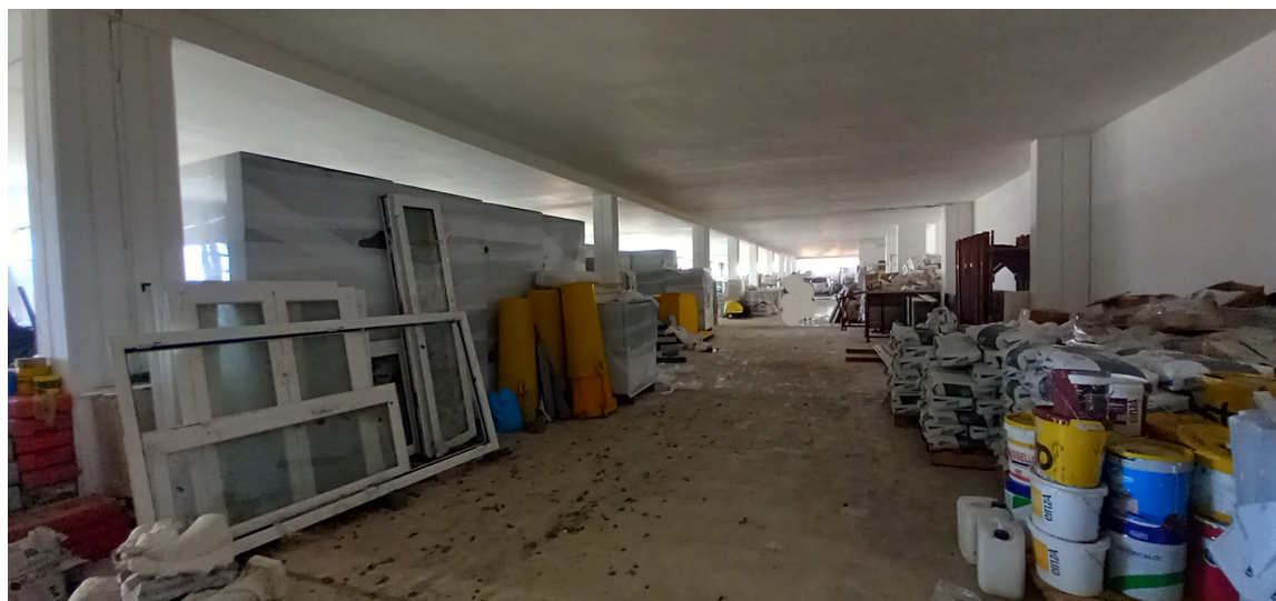
SUB 35 (P.LLA 878) – LOTTO 1