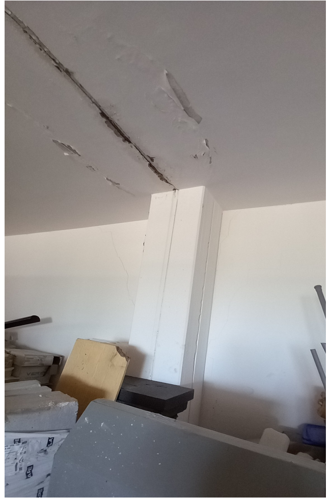
SUB 80 (P.LLA 25) – LOTTO 1