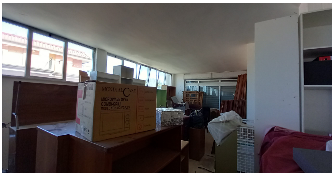
SUB 35 (P.LLA 878) – LOTTO 1