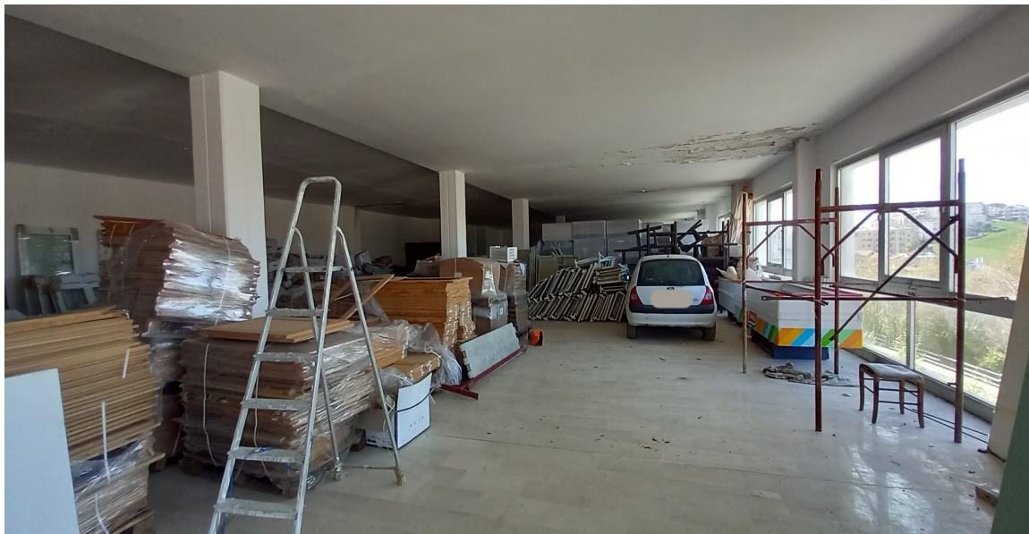
SUB 35 (P.LLA 878) – LOTTO 1