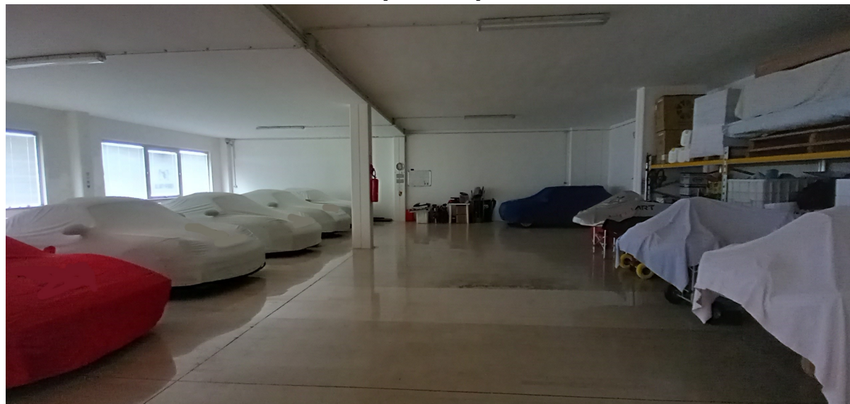
SUB 81 (P.LLA 25) – LOTTO 2