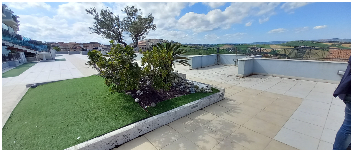
SOVRASTANTE LASTRICO CONDOMINIALE