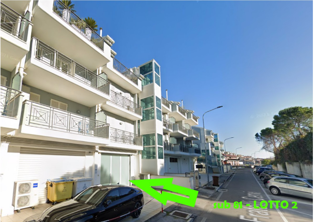
INDIVIDUAZIONE ACCESSO AL SUB 81, P.LLA 25 – LOTTO 2 - VIA F.LLI CERVI