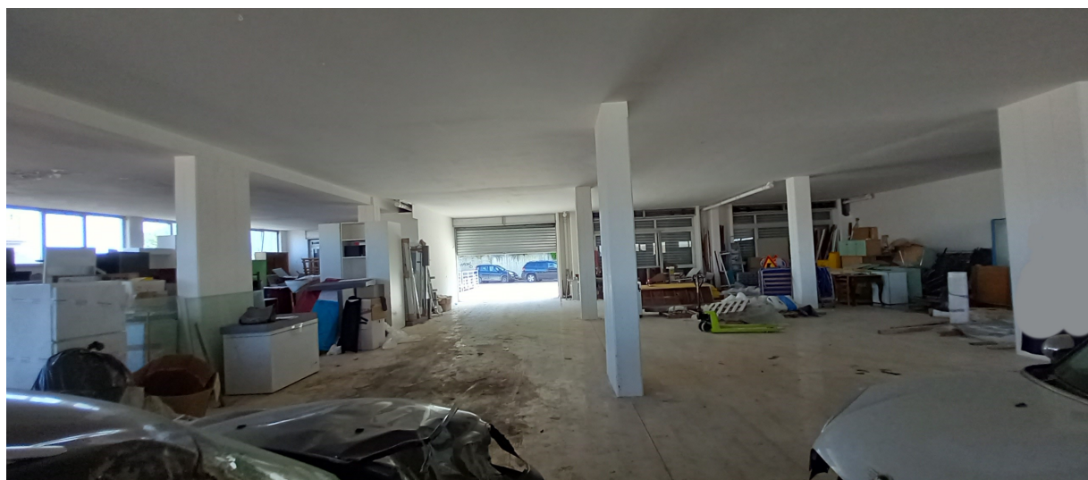
SUB 35 (P.LLA 878) – LOTTO 1