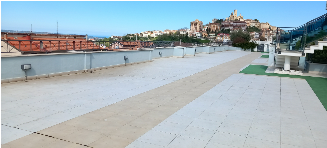
SOVRASTANTE LASTRICO CONDOMINIALE