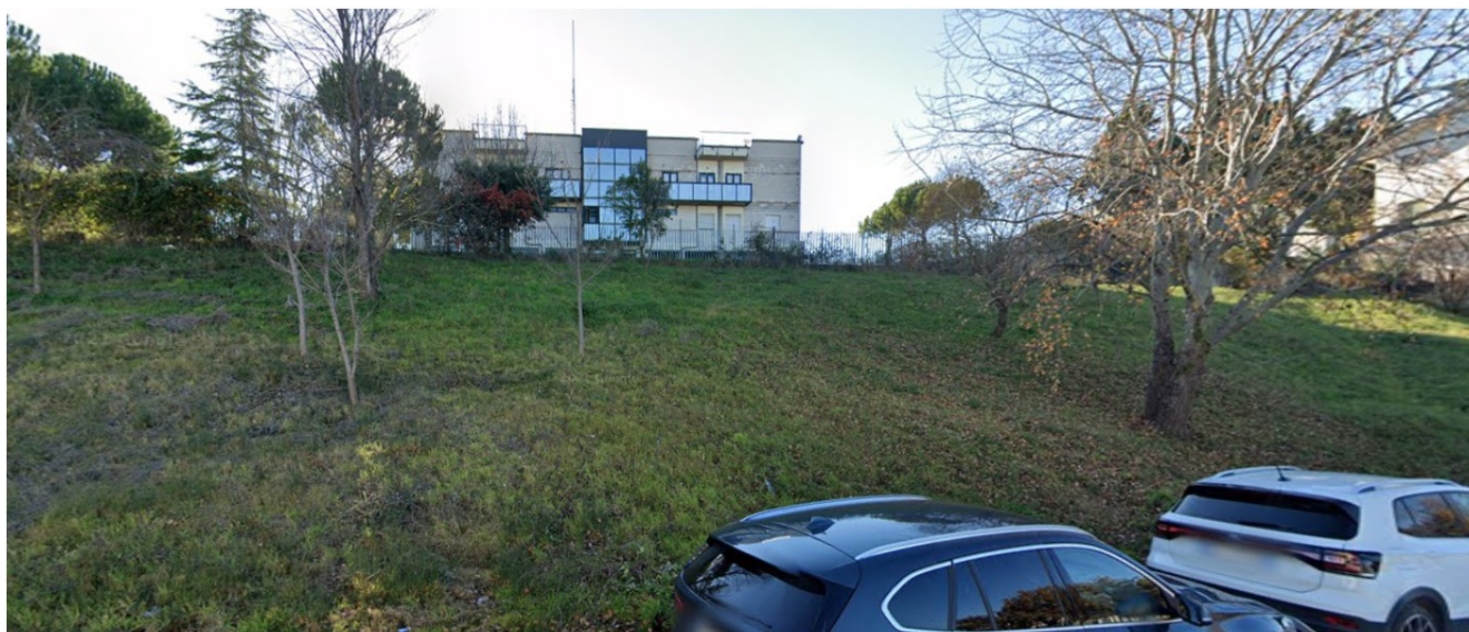
LOTTO 3 – TERRENI - VIA F.LLI CERVI- PORZIONE CENTRALE