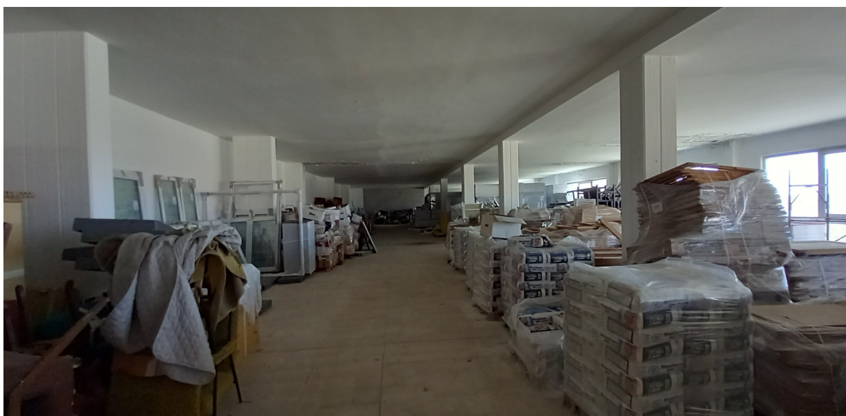
SUB 35 (P.LLA 878) – LOTTO 1