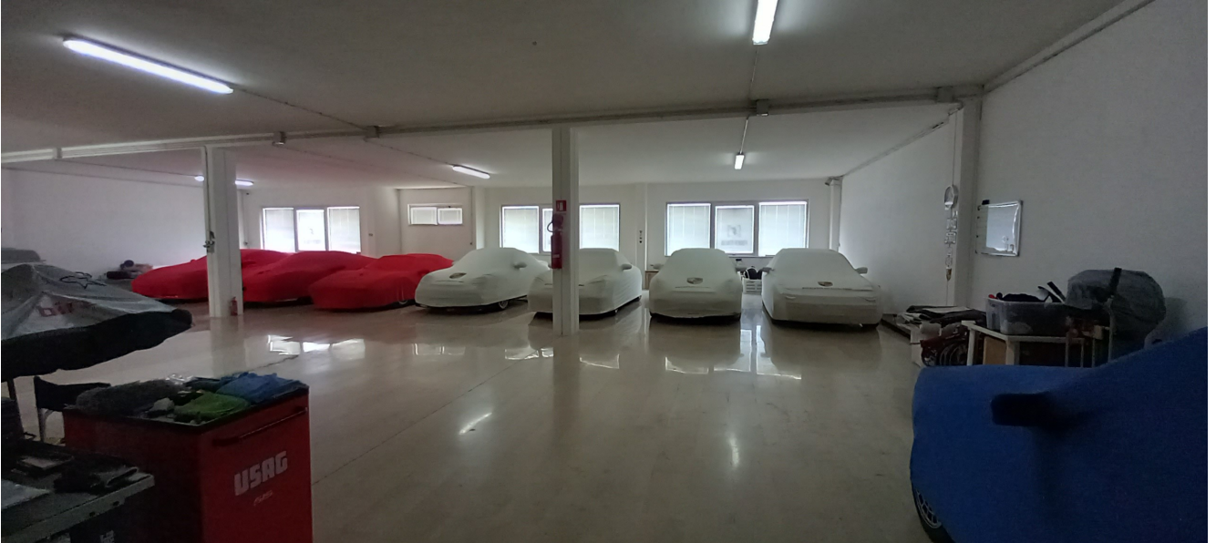
SUB 81 (P.LLA 25) – LOTTO 2