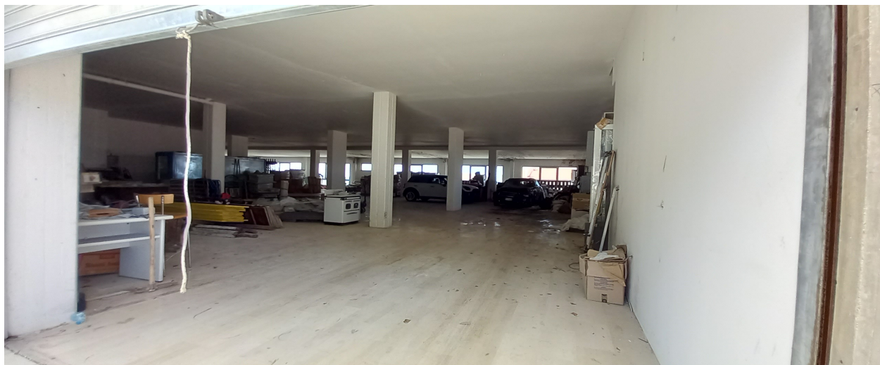
SUB 35 (P.LLA 878) – LOTTO 1