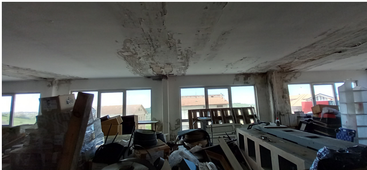
SUB 35 (P.LLA 878) – LOTTO 1