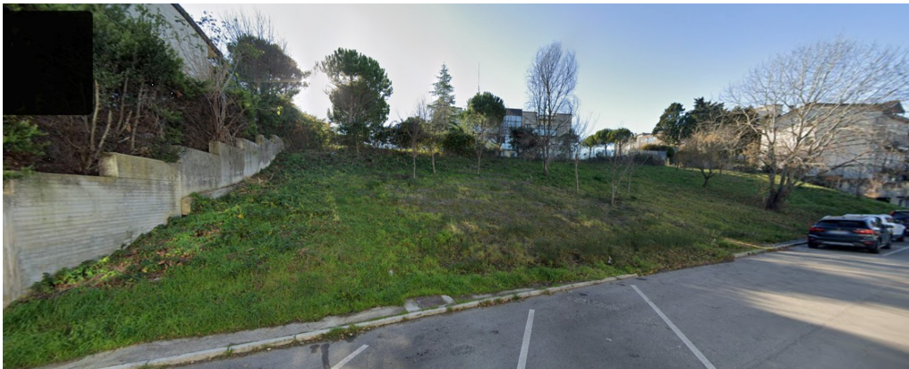
LOTTO 3 – TERRENI - VIA F.LLI CERVI - CONFINE EST -