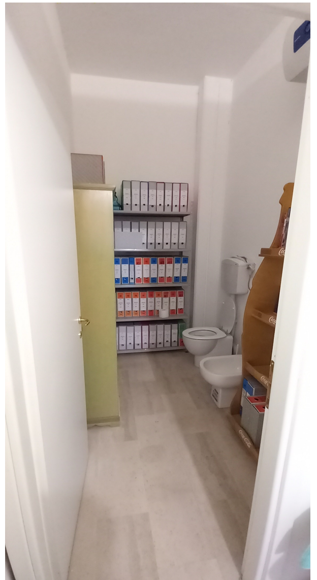
SUB 81 (P.LLA 25) – LOTTO 2 – DISIMPEGNO E W.C.