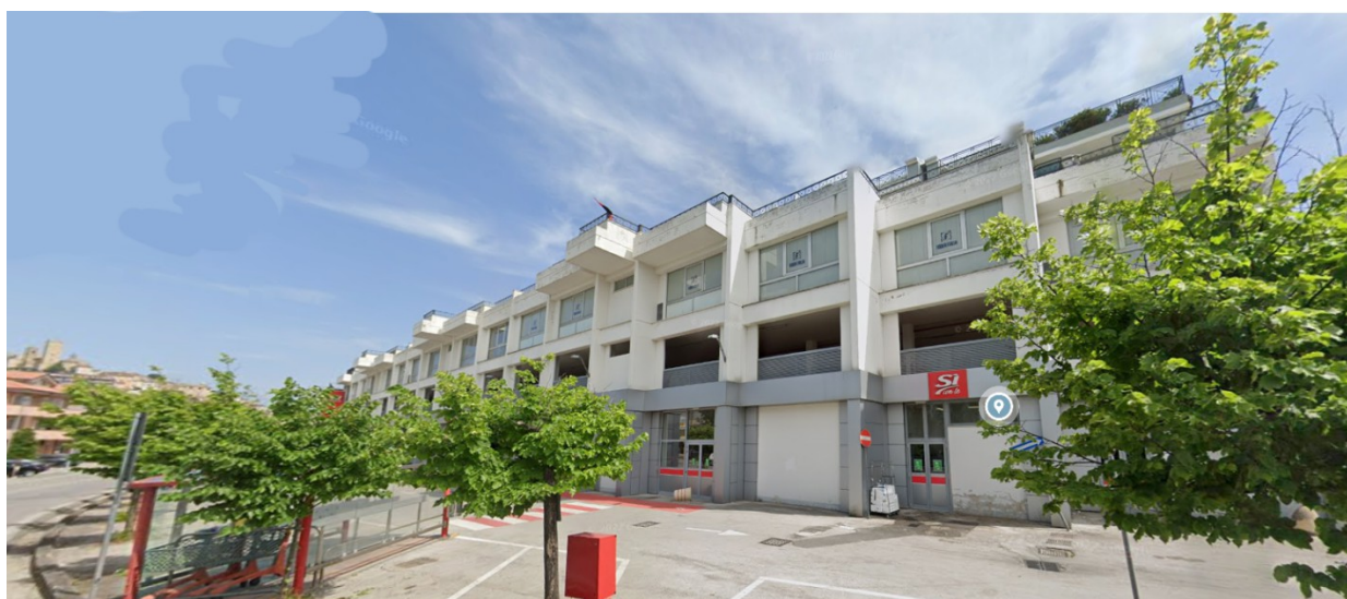
PROSPETTO NORD - VIA FERMANA NORD