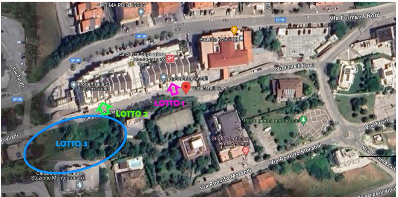
INDIVIDUAZIONE DEI LOTTI