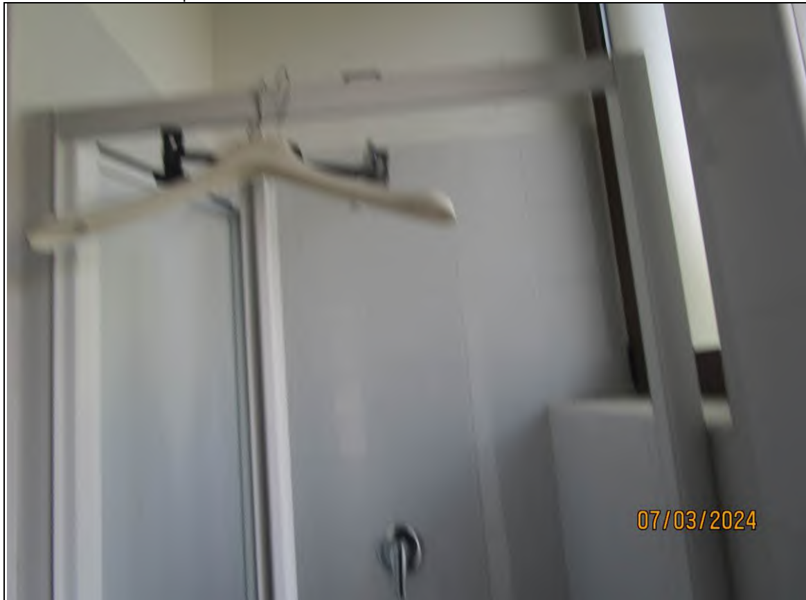
↓Foto49 Vista dello spogliatoio2 dell'opificio sito alla via Generale Vittorio Amato n°8 del comune di San Cipriano Picentino.