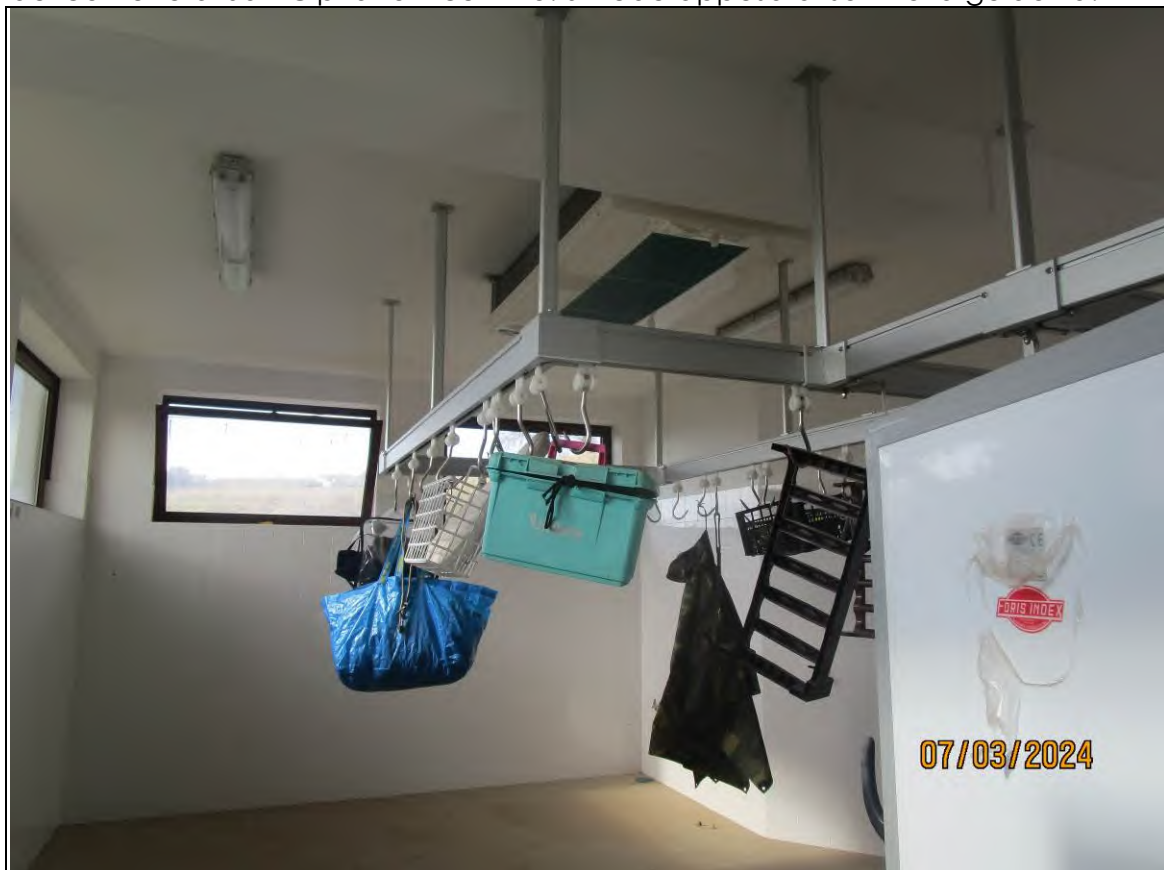
↓ Foto59 Vista del locale lavorazione dell'opificio sito alla via Generale Vittorio Amato n°8 del comune di San Cipriano Picentino. Si vede appesa al soffitto la guidovia.