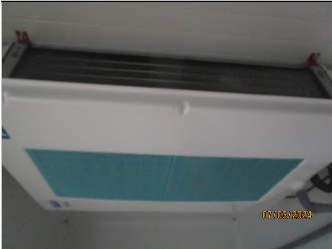
↑ Foto54 Vista della cella1 dell'opificio sito alla via Generale Vittorio Amato n°8 del comune di San Cipriano Picentino.