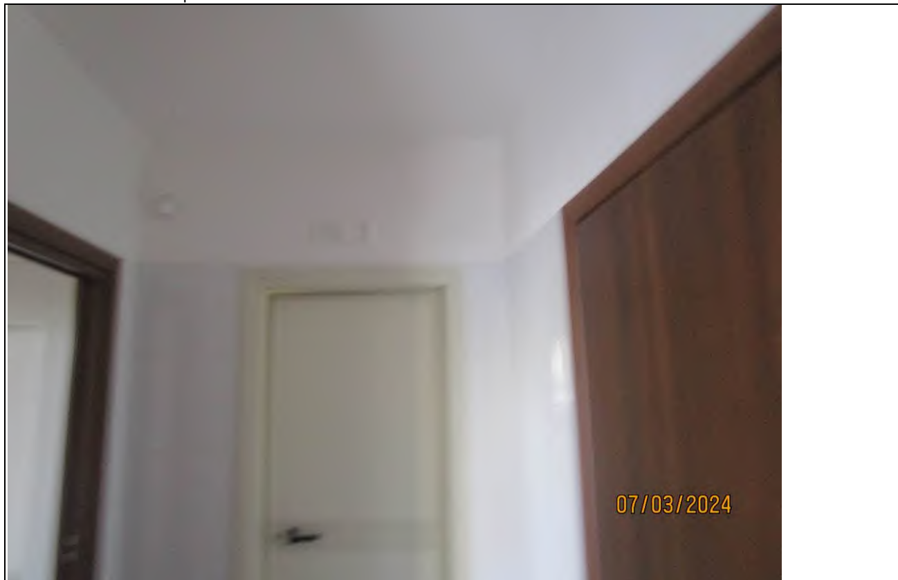
↓ Foto43 Vista del disimpegno dell'opificio sito alla via Generale Vittorio Amato n°8 del comune di San Cipriano Picentino..