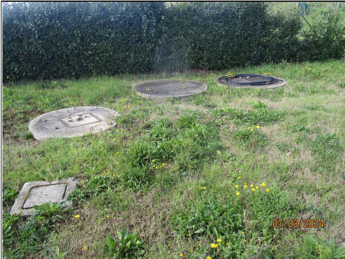
↑Foto32 Vista dell'opificio con pertinenze scoperte, sito alla via Generale Vittorio Amato n°8 del comune di San Cipriano Picentino. Esterno.