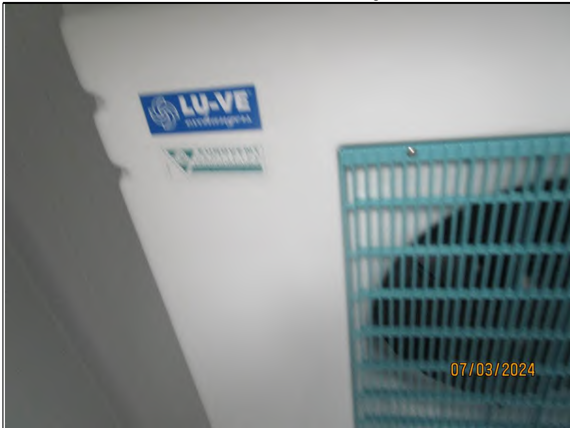
↑Foto56 Vista della cella2 dell'opificio sito alla via Generale Vittorio Amato n°8 del comune di San Cipriano Picentino.