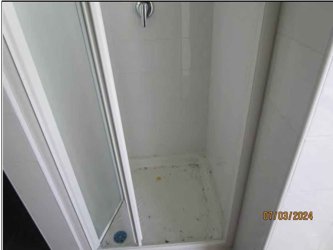
↑Foto48 Vista dello spogliatoio2 dell'opificio sito alla via Generale Vittorio Amato n°8 del comune di San Cipriano Picentino.