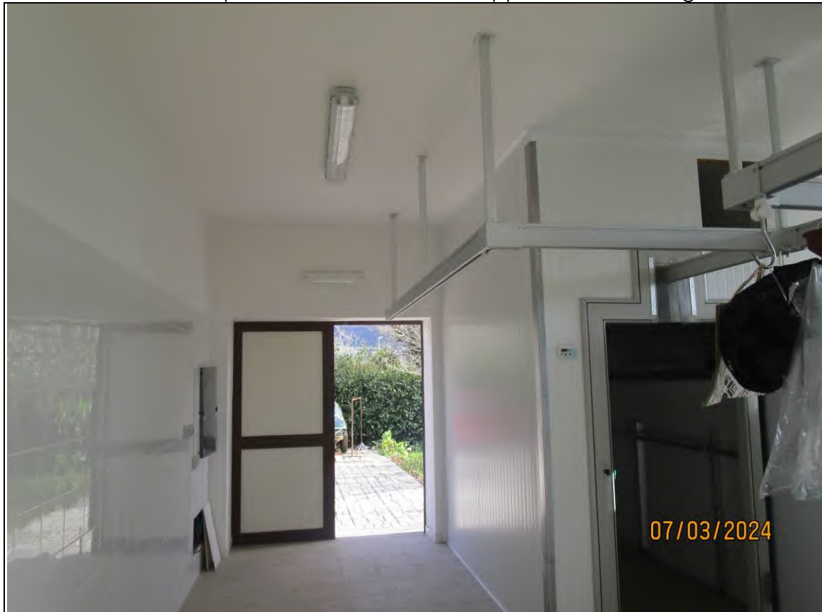
↓Foto57 Vista del locale lavorazione dell'opificio sito alla via Generale Vittorio Amato n°8 del comune di San Cipriano Picentino. Si vede appesa al soffitto la guidovia