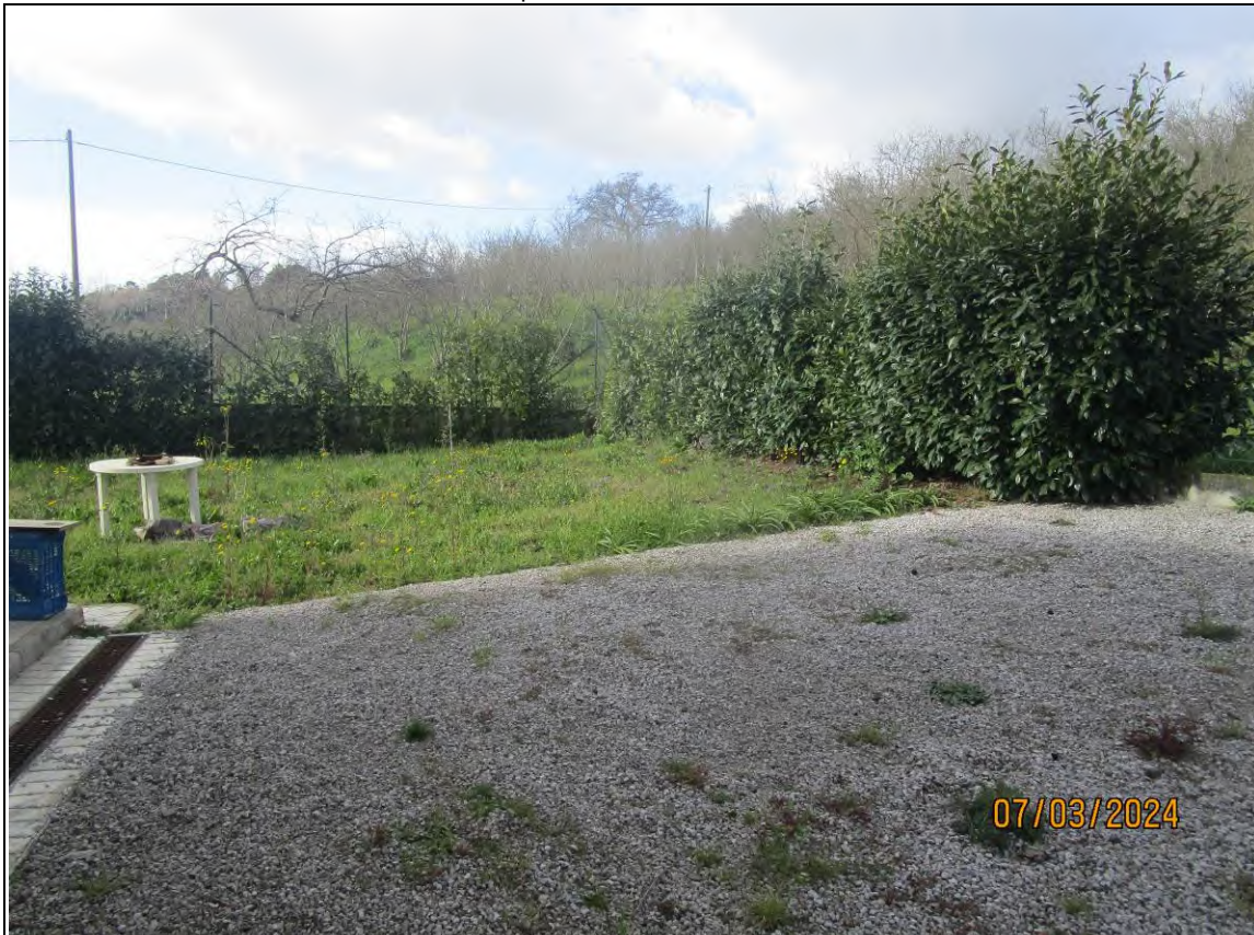
↓Foto33 Vista dell'opificio con pertinenze scoperte, sito alla via Generale Vittorio Amato n°8 del comune di San Cipriano Picentino. Esterno