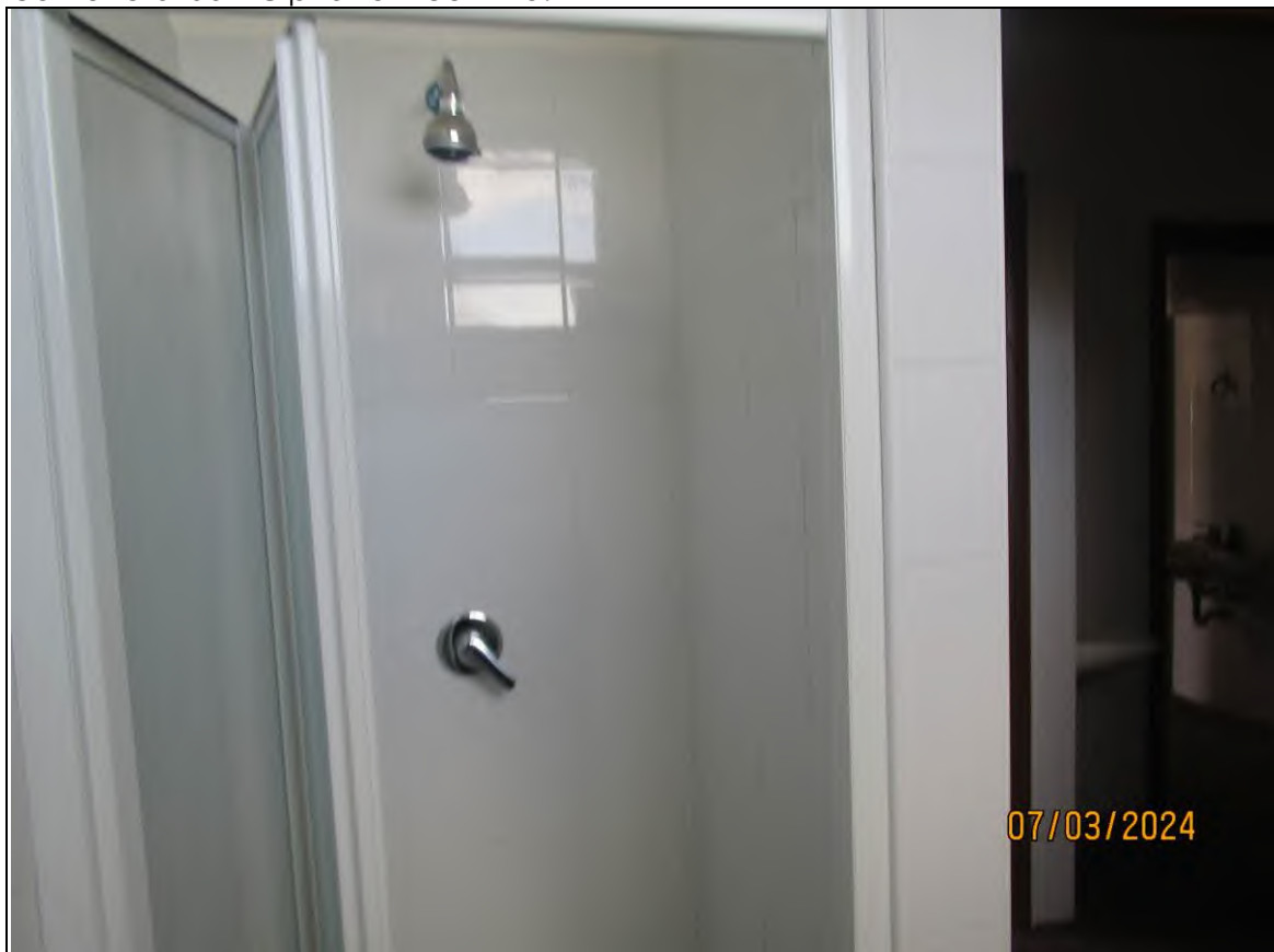
↓Foto45 Vista dello spogliatoio1 dell'opificio sito alla via Generale Vittorio Amato n°8 del comune di San Cipriano Picentino.