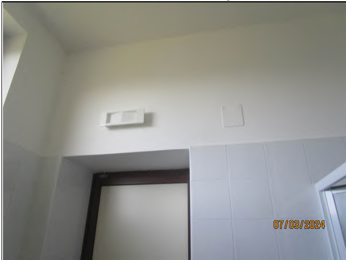
↑Foto46 Vista dello spogliatoio1 dell'opificio sito alla via Generale Vittorio Amato n°8 del comune di San Cipriano Picentino.