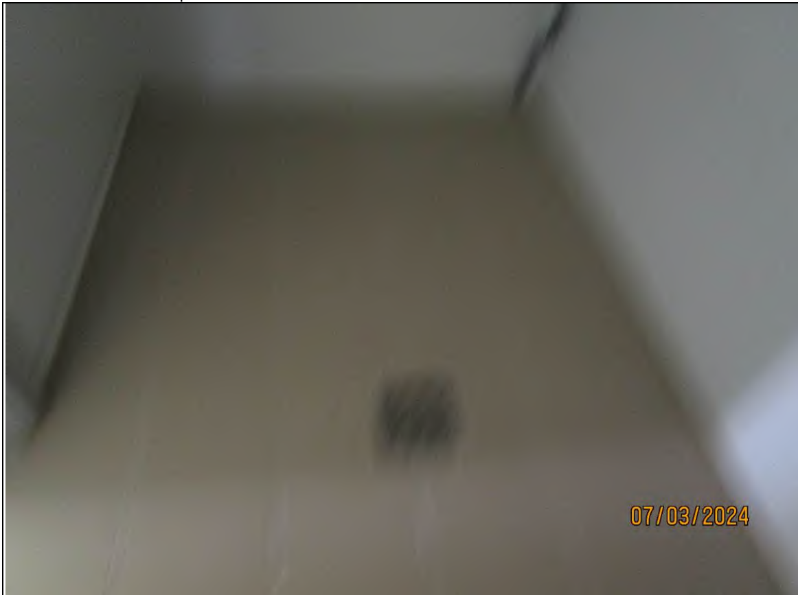
↓ Foto53 Vista della cella1 dell'opificio sito alla via Generale Vittorio Amato n°8 del comune di San Cipriano Picentino.