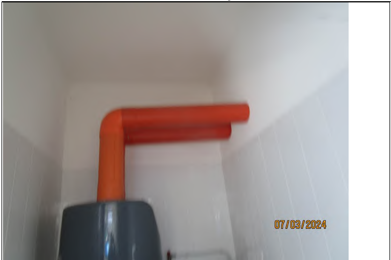
↑ Foto64 Vista del lavaggio dell'opificio sito alla via Generale Vittorio Amato n°8 del comune di San Cipriano Picentino.