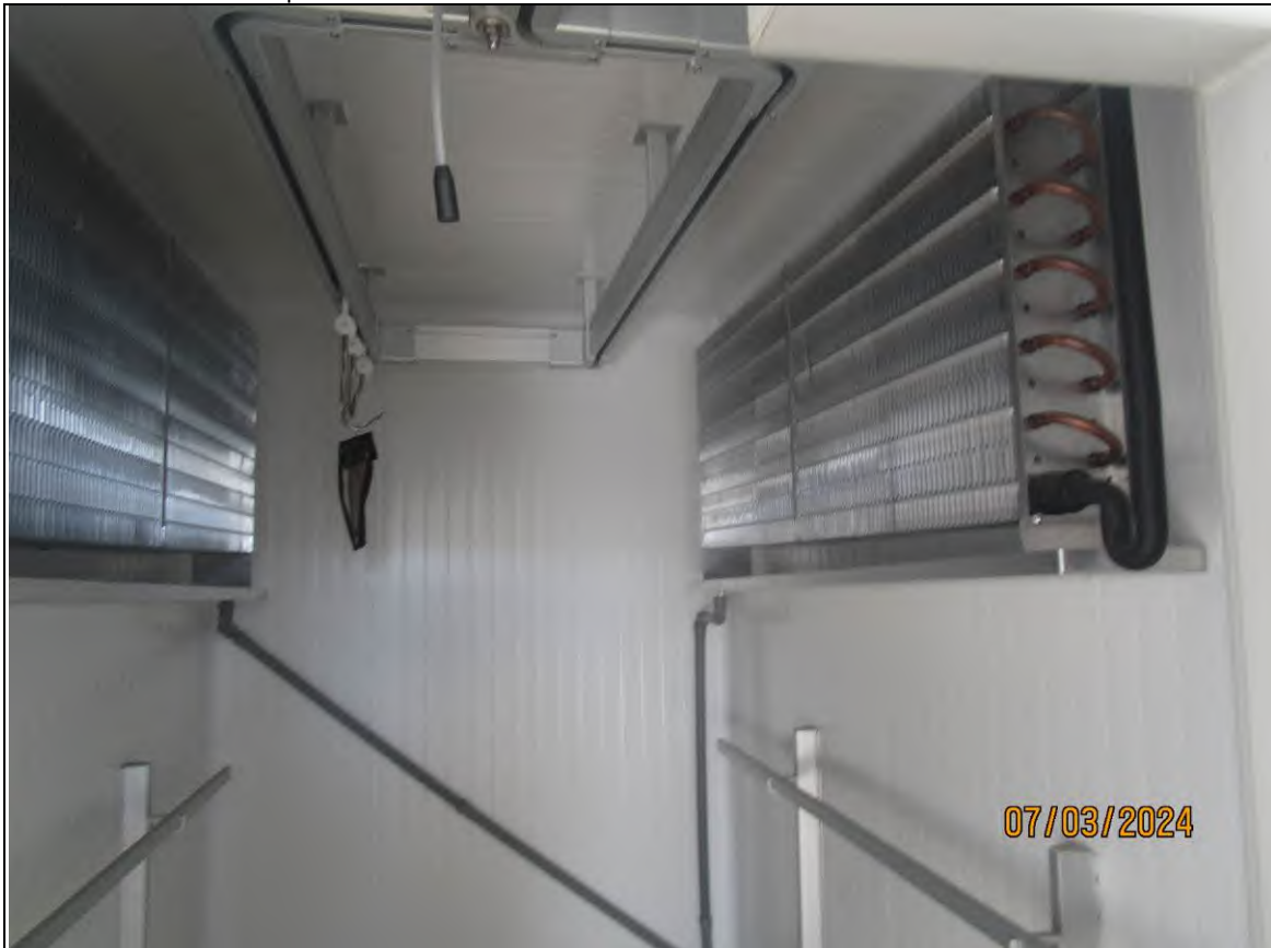
↓ Foto61 Vista della cella carni dell'opificio sito alla via Generale Vittorio Amato n°8 del comune di San Cipriano Picentino.