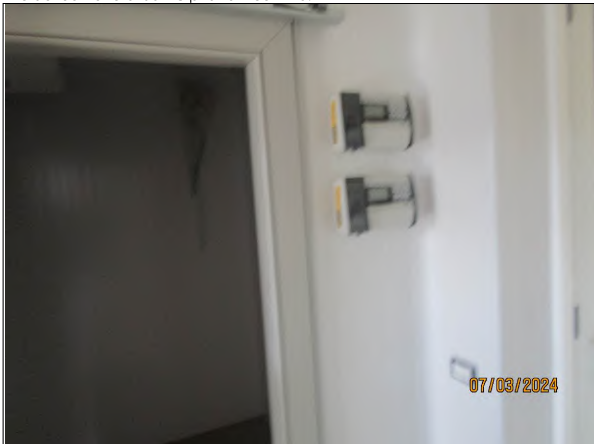
↓ Foto51 Vista del locale spazzolatura dell'opificio sito alla via Generale Vittorio Amato n°8 del comune di San Cipriano Picentino.