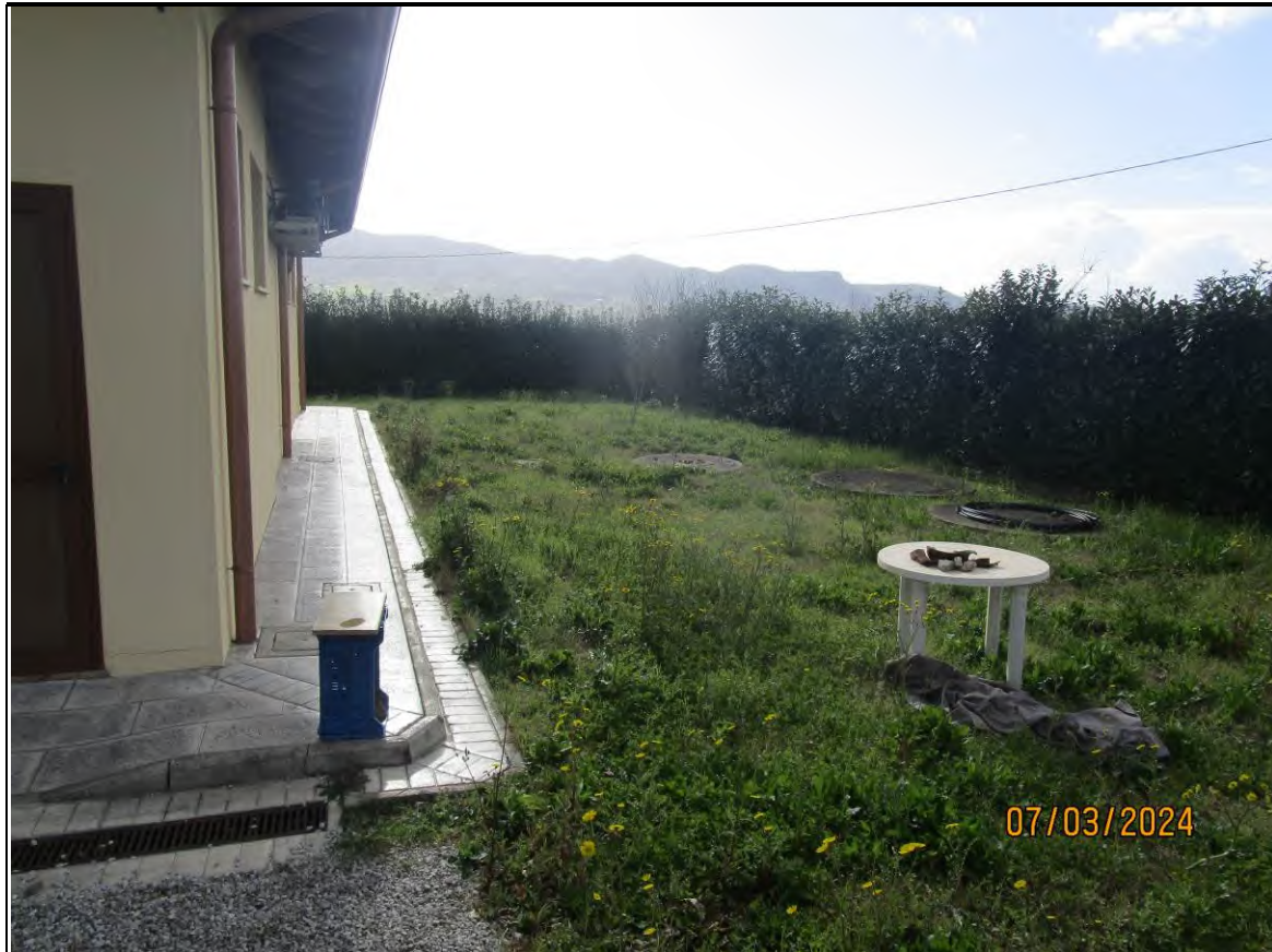
↑Foto34 Vista dell'opificio con pertinenziale area scoperta, sito alla via Generale Vittorio Amato n°8 del comune di San Cipriano Picentino. Esterno.