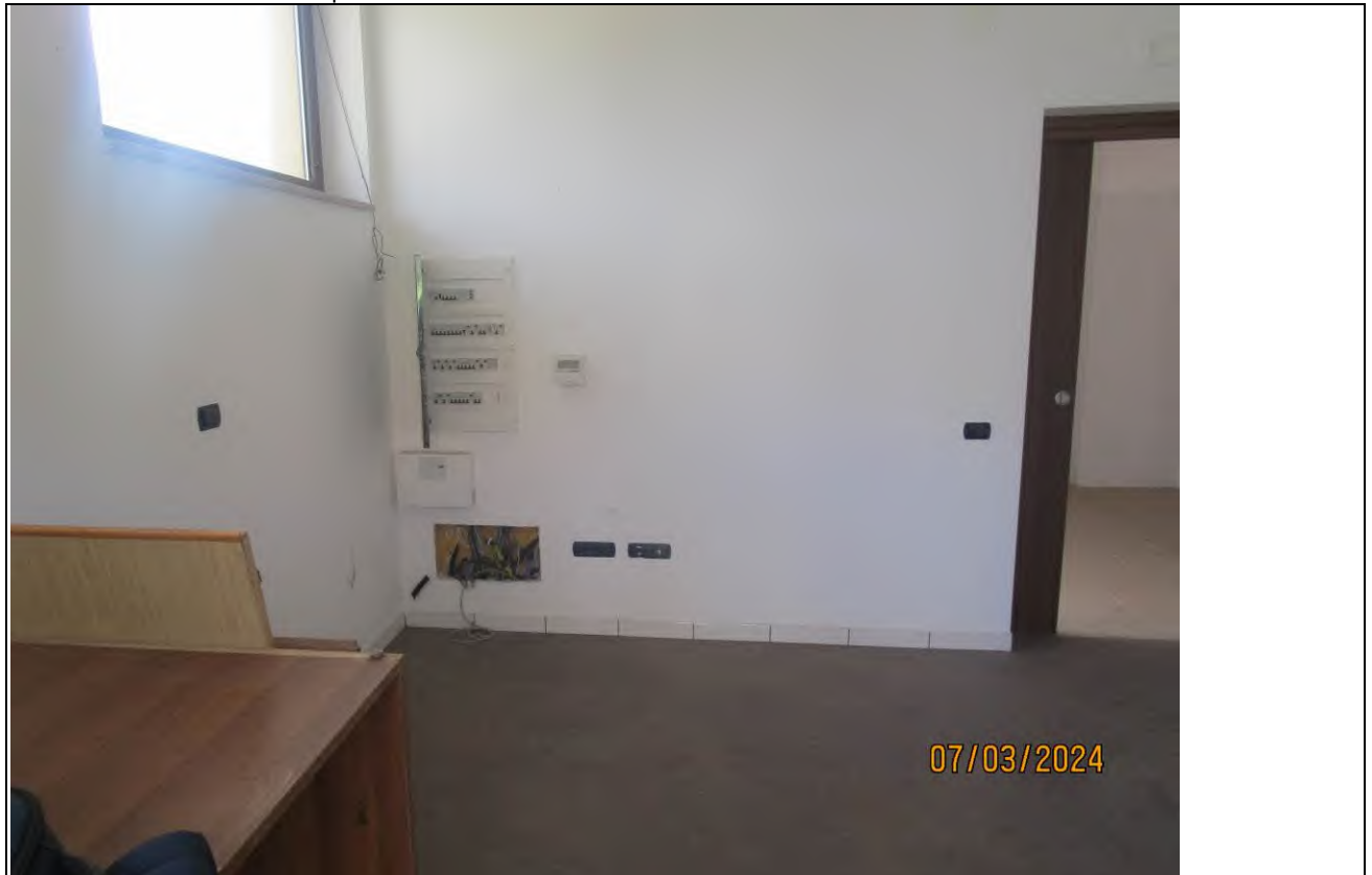
↓ Foto37 Vista dell'ufficio vendita dell'opificio sito alla via Generale Vittorio Amato n°8 del comune di San Cipriano Picentino