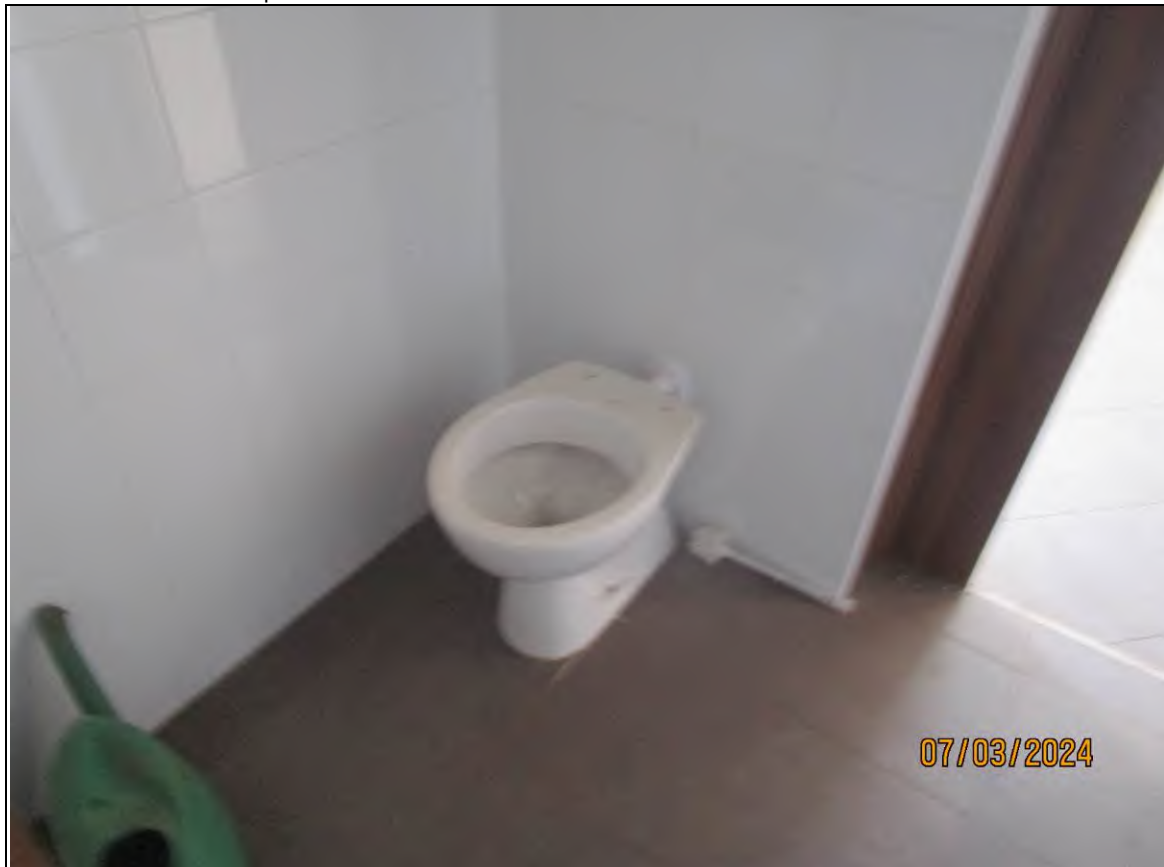
↓ Foto41 Vista del bagno2 dell'opificio sito alla via Generale Vittorio Amato n°8 del comune di San Cipriano Picentino.