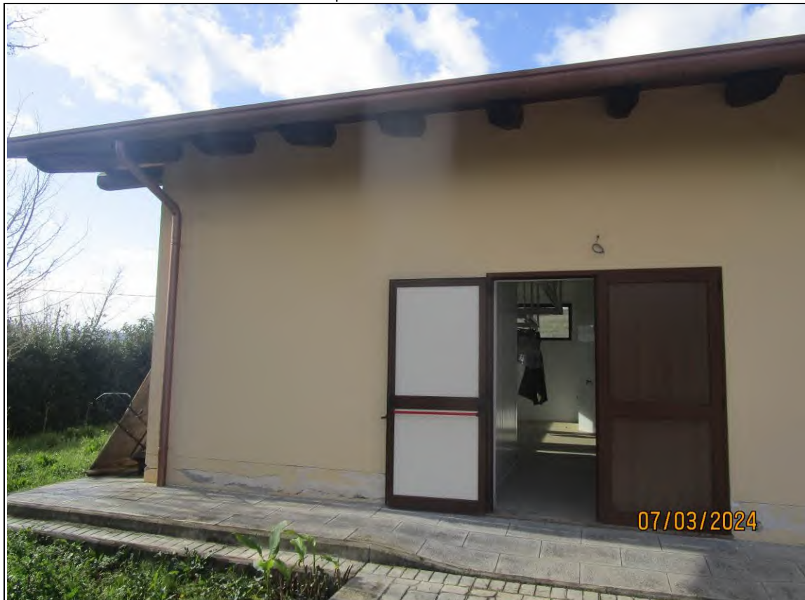
↓Foto29 Vista dell'opificio con pertinenziale area scoperta, sito alla via Generale Vittorio Amato n°8 del comune di San Cipriano Picentino. Esterno.