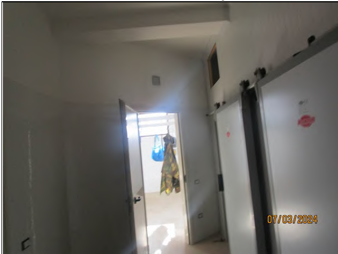
↑ Foto50 Vista del locale spazzolatura dell'opificio sito alla via Generale Vittorio Amato n°8 del comune di San Cipriano Picentino.