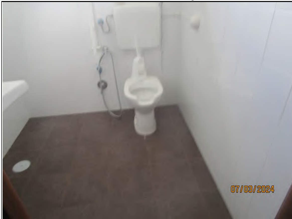
↑Foto44 Vista del bagno1 dell'opificio sito alla via Generale Vittorio Amato n°8 del comune di San Cipriano Picentino.