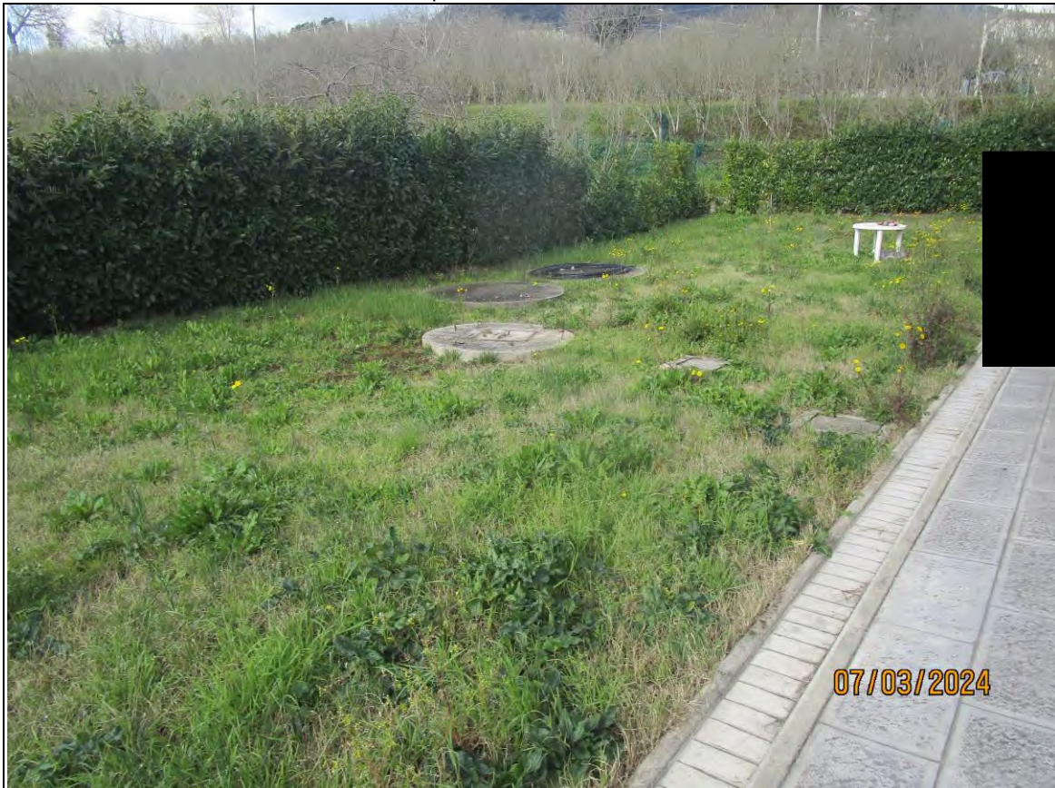
↓ Foto31 Vista dell'opificio con pertinenziale area scoperta, sito alla via Generale Vittorio Amato n°8 del comune di San Cipriano Picentino. Esterno.