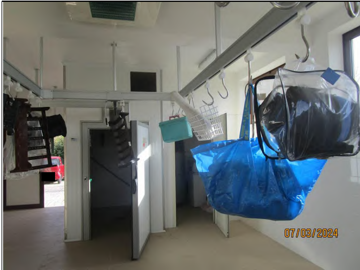
↑ Foto58 Vista del locale lavorazione dell'opificio sito alla via Generale Vittorio Amato n°8 del comune di San Cipriano Picentino. Si vede appesa al soffitto la guidovia.