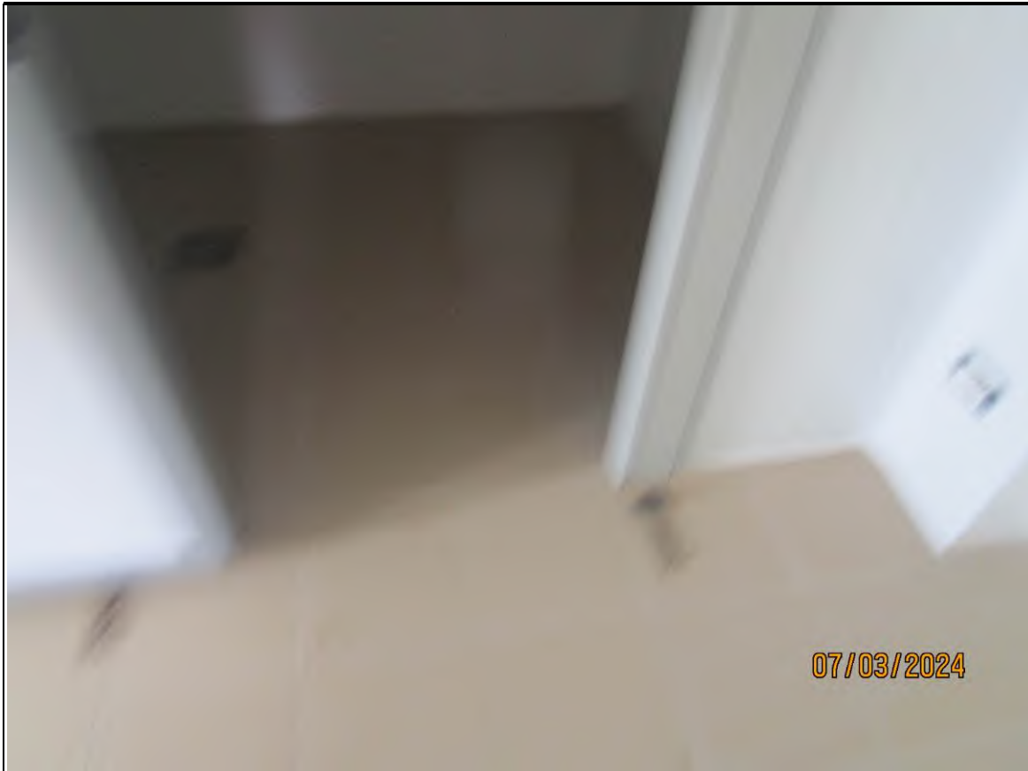
↑ Foto52 Vista della cella1 dell'opificio sito alla via Generale Vittorio Amato n°8 del comune di San Cipriano Picentino.