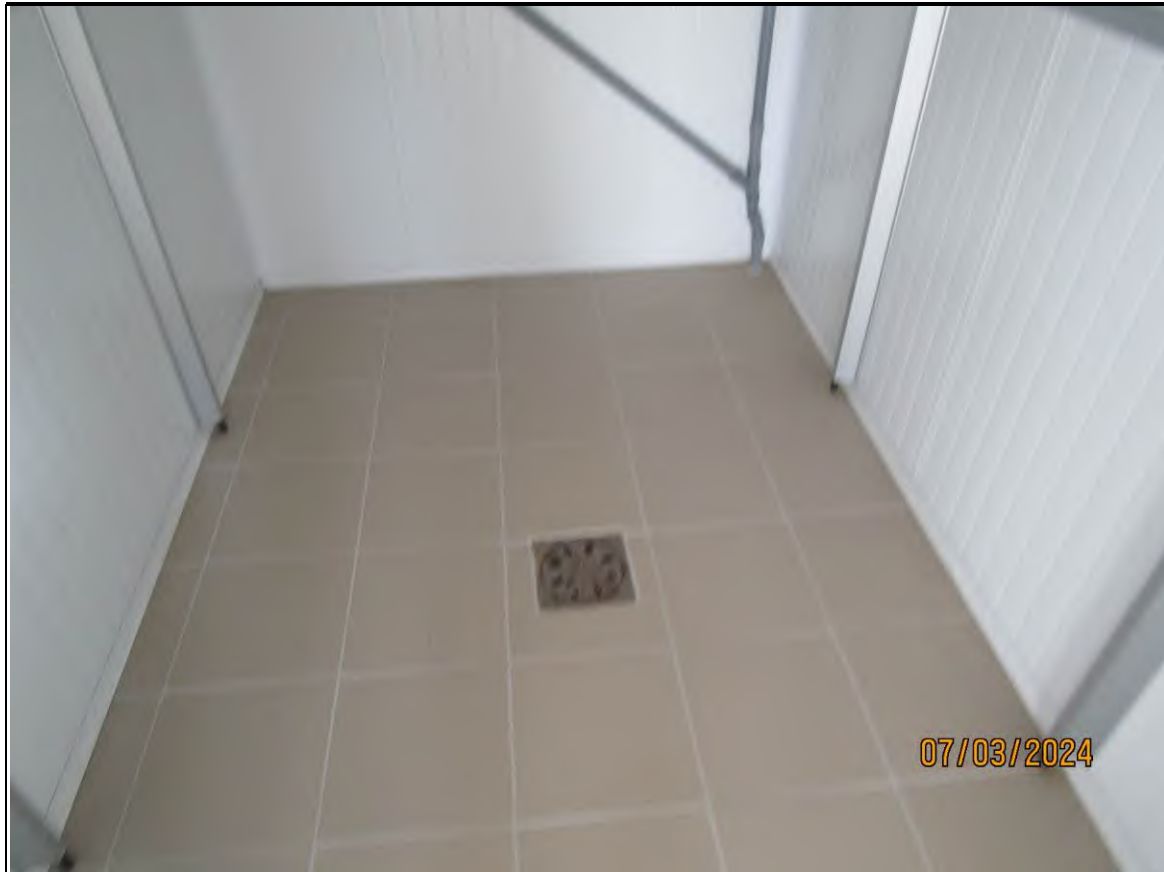
↑Foto62 Vista della cella carni dell'opificio sito alla via Generale Vittorio Amato n°8 del comune di San Cipriano Picentino.