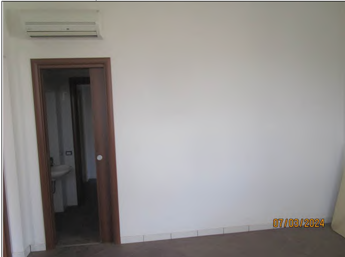
↓Foto35 Vista dell'ufficio vendita dell'opificio sito alla via Generale Vittorio Amato n°8 del comune di San Cipriano Picentino.