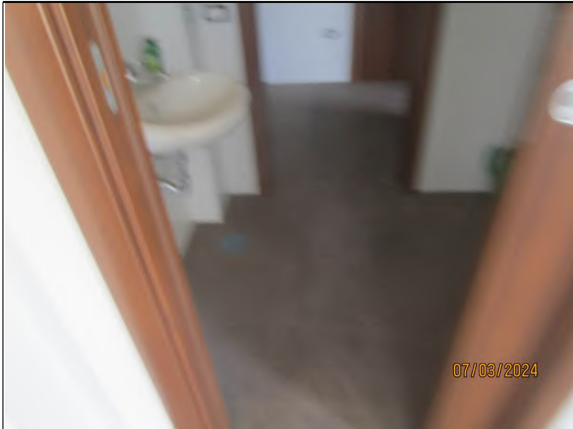
↑ Foto40 Vista dell'antibagno2 dell'opificio sito alla via Generale Vittorio Amato n°8 del comune di San Cipriano Picentino.