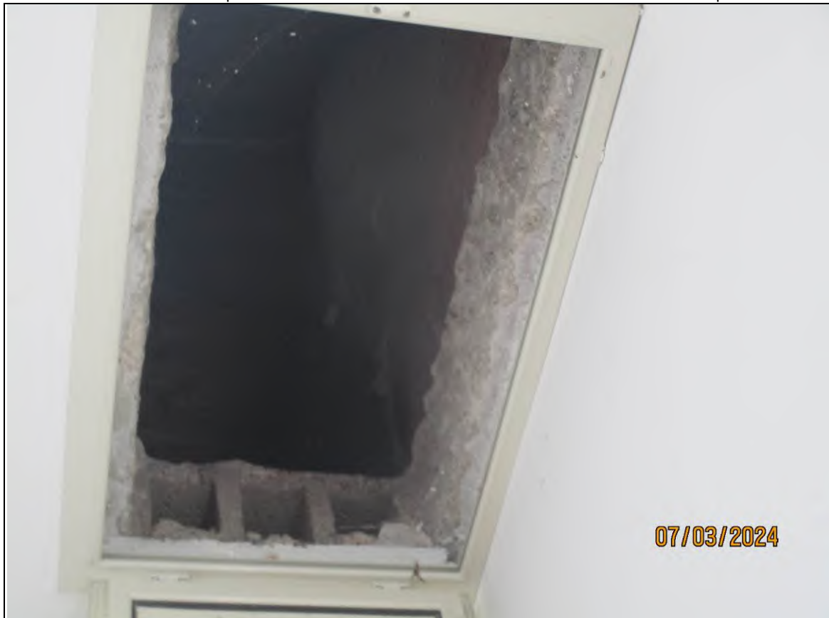
↓Foto39d Vista dell'ufficio vendita dell'opificio sito alla via Generale Vittorio Amato n°8 del comune di San Cipriano Picentino. Botola sul soffitto di accesso al piano sottotetto