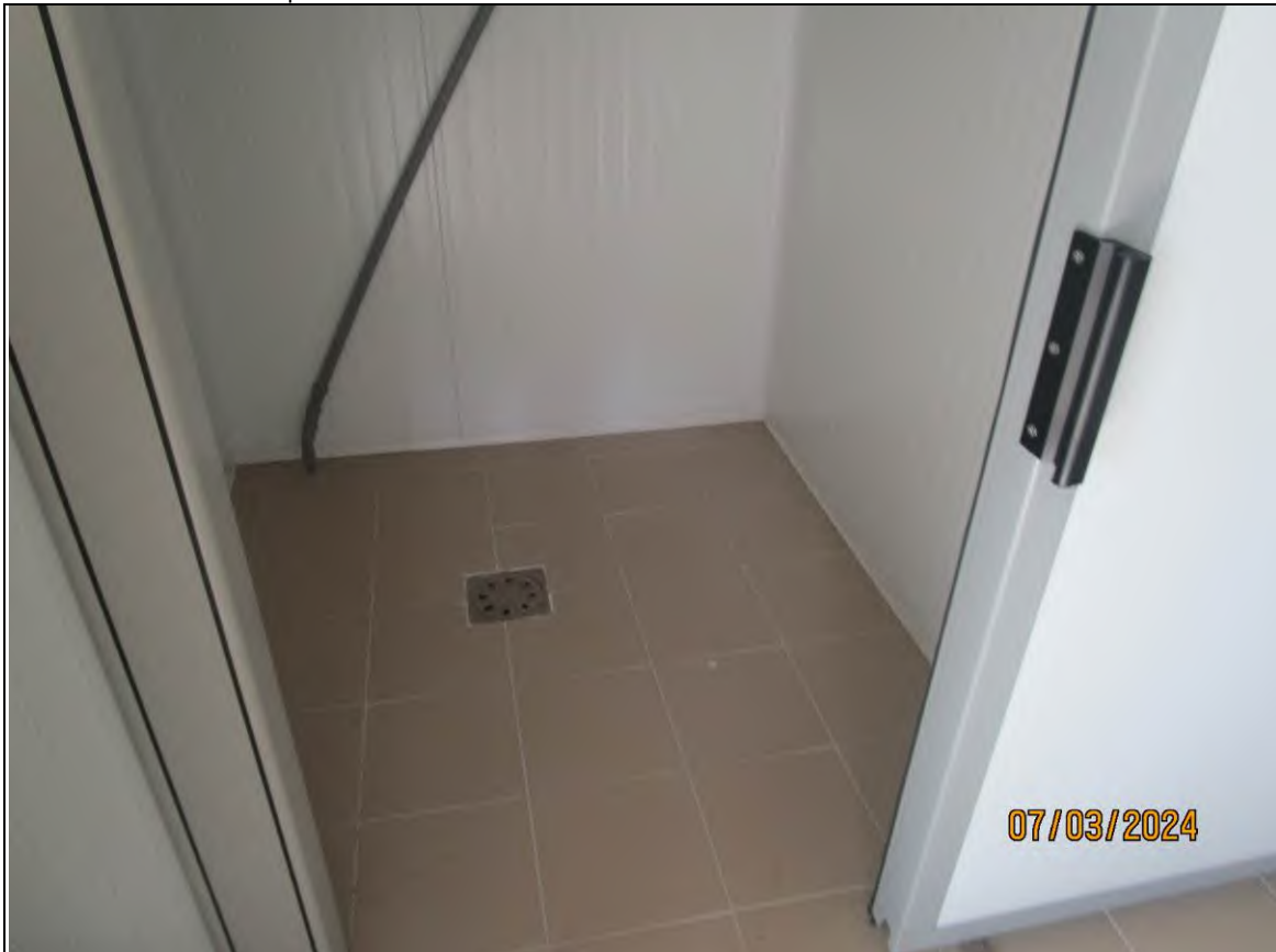
↓ Foto55 Vista della cella2 dell'opificio sito alla via Generale Vittorio Amato n°8 del comune di San Cipriano Picentino.