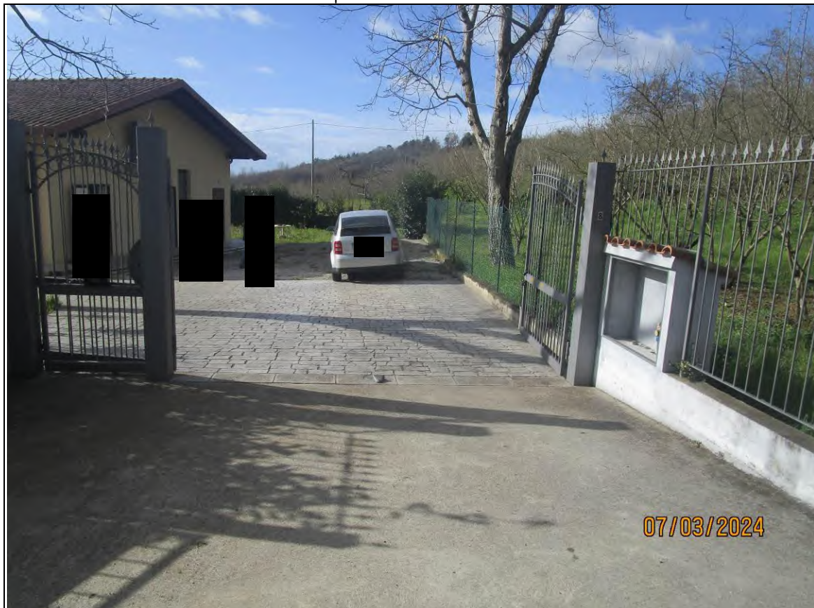
↓Foto27 Vista dell'opificio con pertinenziale area scoperta, sito alla via Generale Vittorio Amato n°8 del comune di San Cipriano Picentino. Accesso.