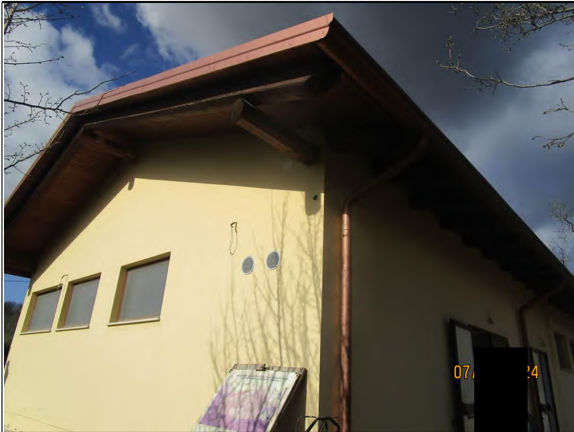
↑ Foto30 Vista dell'opificio con pertinenziale area scoperta, sito alla via Generale Vittorio Amato n°8 del comune di San Cipriano Picentino. Esterno.