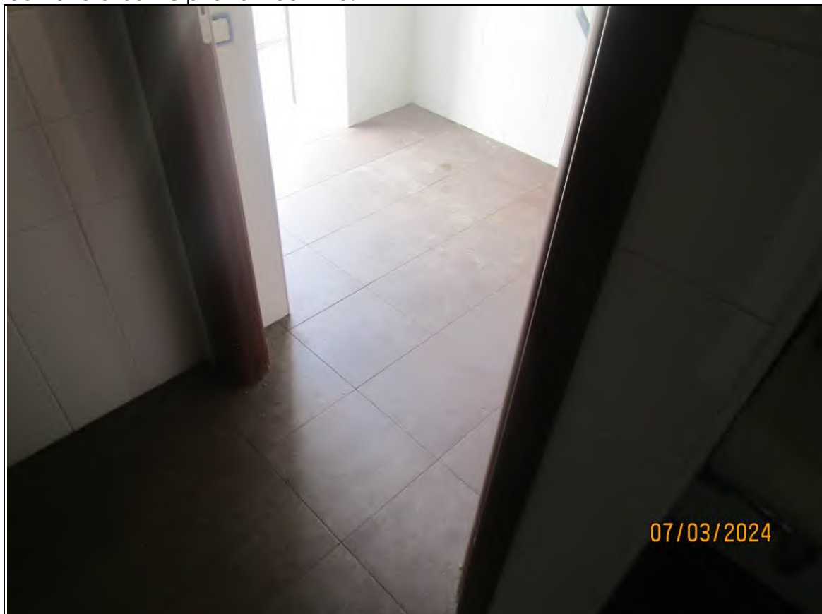
↓Foto47 Vista dello spogliatoio2 dell'opificio sito alla via Generale Vittorio Amato n°8 del comune di San Cipriano Picentino.