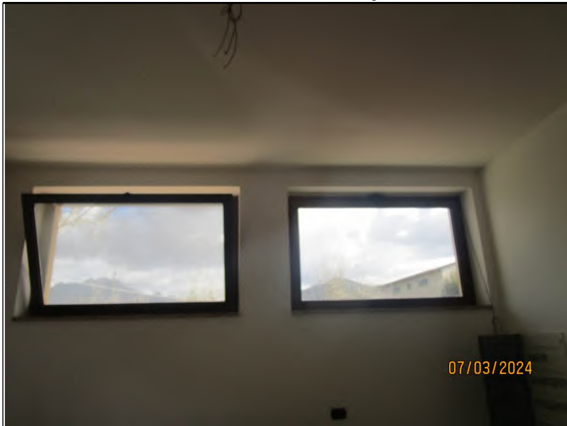
↑Foto38 Vista dell'ufficio vendita dell'opificio sito alla via Generale Vittorio Amato n°8 del comune di San Cipriano Picentino.