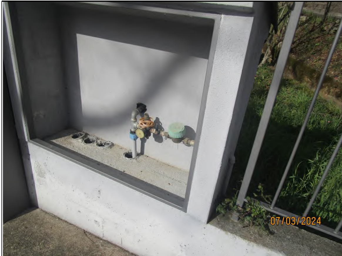
↑Foto28 Vista dell'opificio con pertinenziale area scoperta, sito alla via Generale Vittorio Amato n°8 del comune di San Cipriano Picentino. Nicchia per i contatori, manca quello elettrico.