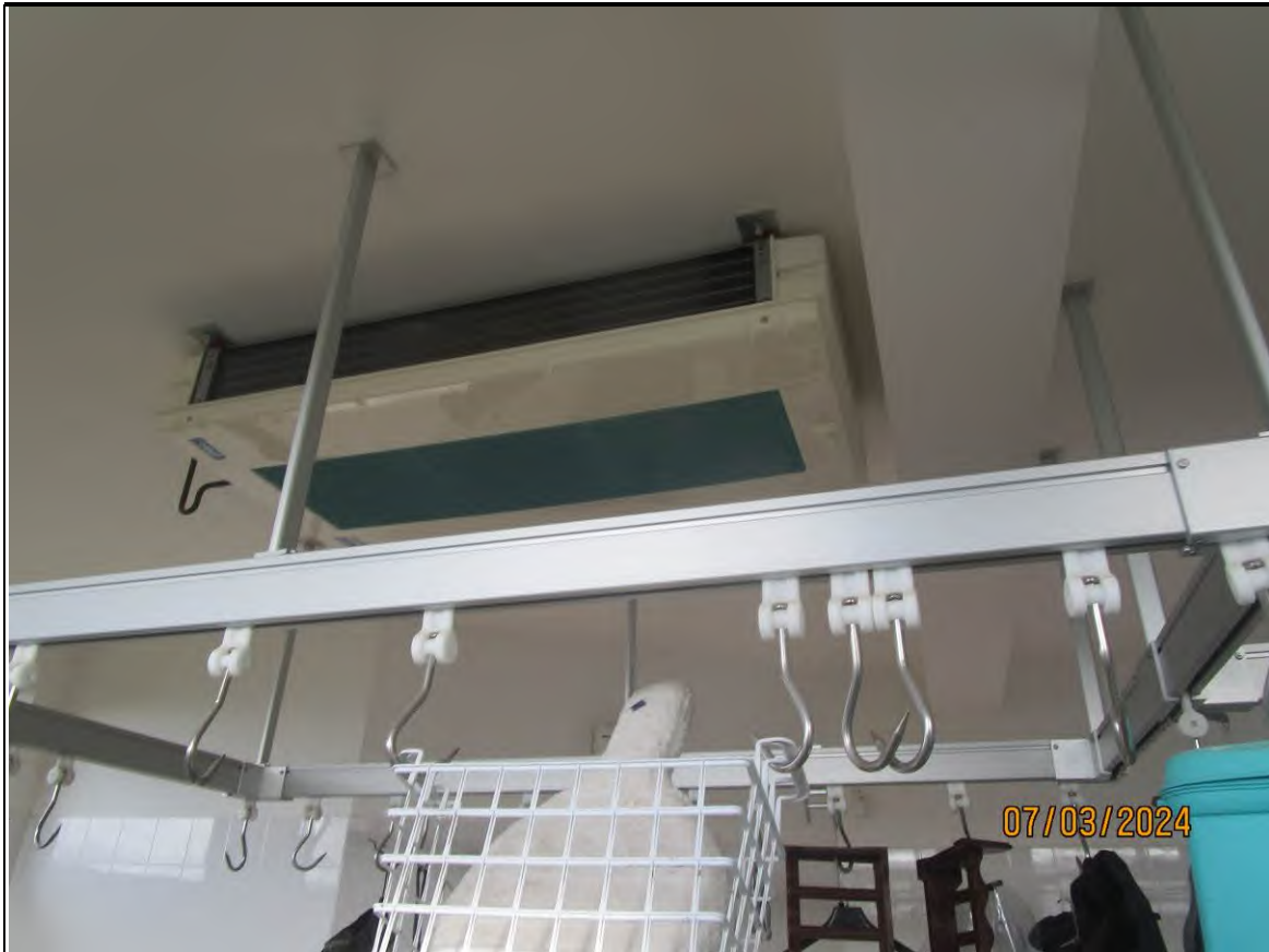
↑ Foto60 Vista del locale lavorazione dell'opificio sito alla via Generale Vittorio Amato n°8 del comune di San Cipriano Picentino. Si vede appesa al soffitto la guidovia.