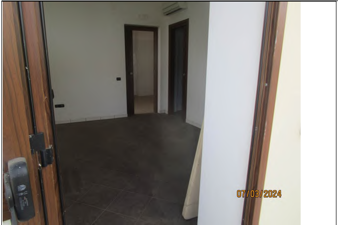
↑ Foto36 Vista dell'ufficio vendita dell'opificio sito alla via Generale Vittorio Amato n°8 del comune di San Cipriano Picentino.