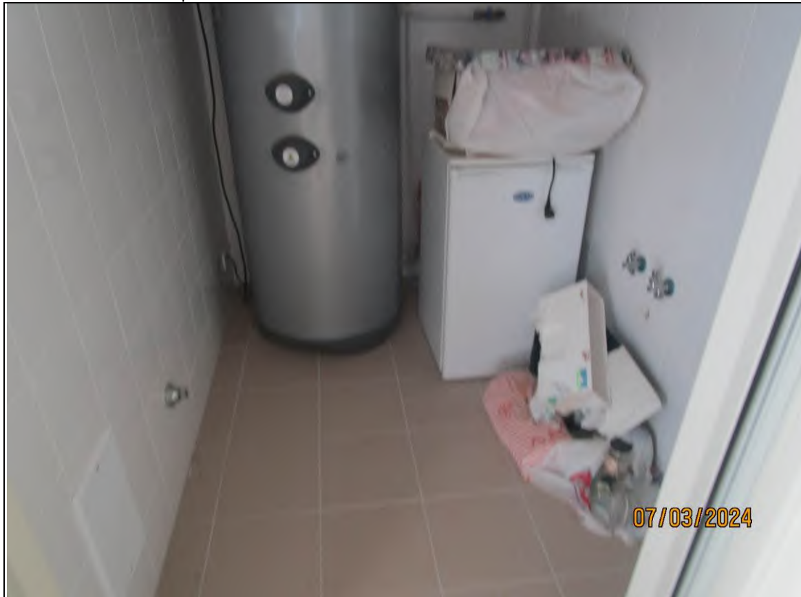
↓Foto63 Vista del lavaggio dell'opificio sito alla via Generale Vittorio Amato n°8 del comune di San Cipriano Picentino.