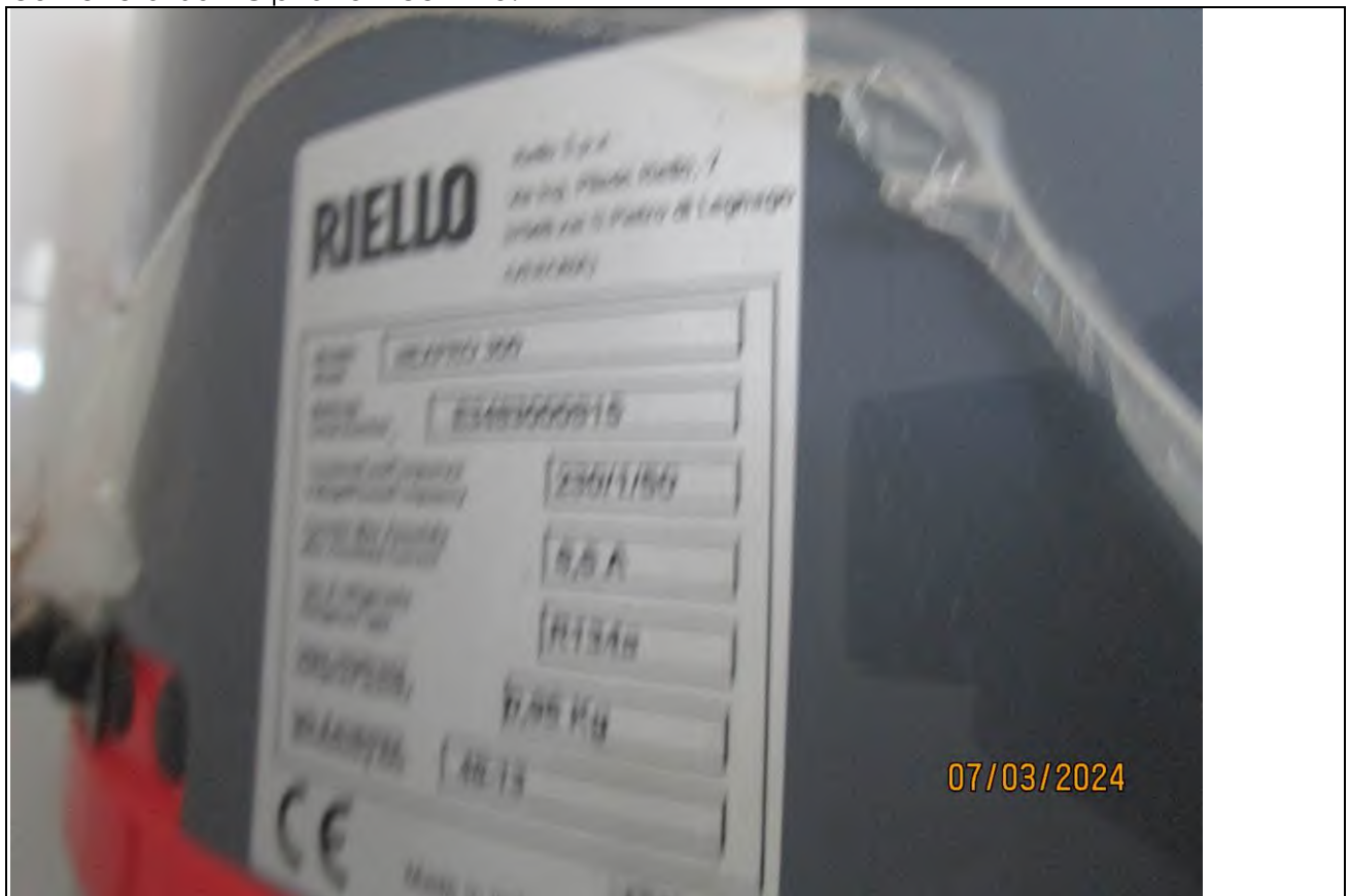
↓ Foto65 Vista del lavaggio dell'opificio sito alla via Generale Vittorio Amato n°8 del comune di San Cipriano Picentino.