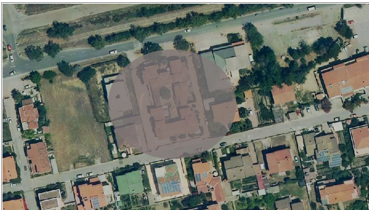
Figura 1: Ortofoto della zona antistante la Via Monsignor Virgilio e Via Turati, in cui ricade il complesso immobiliare nel quale è presente l'appartamento oggetto della presente scheda

BENE N° 2 - POSTO AUTO (N.C.E.U. di Tortoli - Foglio 5 Particella 2196 Sub 27)