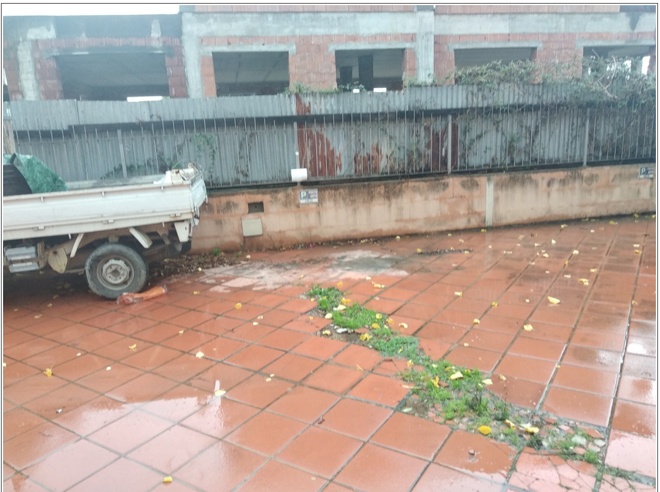
Figura 5: Posto auto scoperto esclusivo all'interno del complesso immobiliare