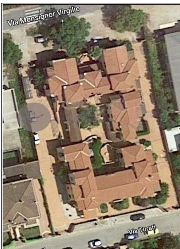
Figura 2: Ortofoto di dettaglio del complesso immobiliare nel quale è presente il posto auto scoperto oggetto della presente scheda