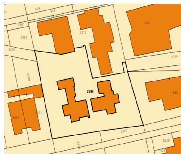
Figura 3: Mappa Catastale "Terreni", della zona antistante Via Monsignor Virgilio e Via Turati, in cui ricade il posto auto scoperto oggetto della presente scheda distinta al Foglio 5 particella 2196 sub 27- immagine tratta dal sito https://www.topoprogram.it/