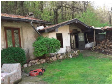
Foto accessorio adiacente