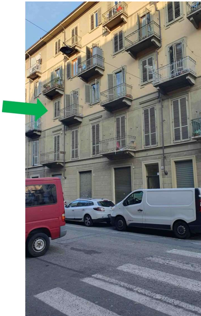
Fig. – facciata stabile sulla via Belmonte

L'intero edificio sviluppa 4 piani (5 fuori terra), 1 piano interrato.