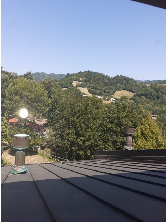
Tetto in lamiera di rame