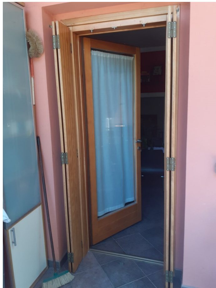
Ingresso zona giorno