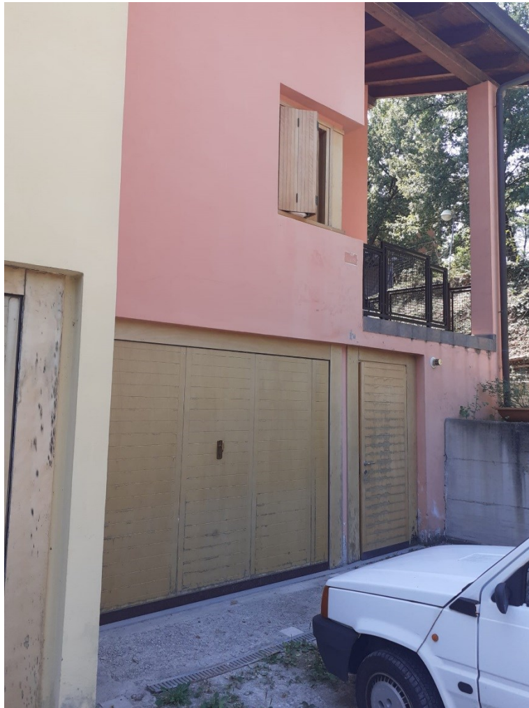
Accesso a cantina e garage