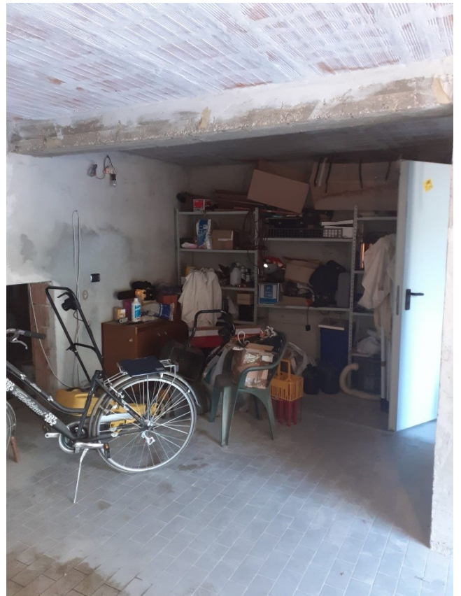
Cantina e garage