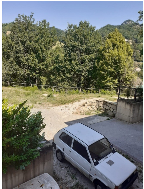
Terreno in comproprietà