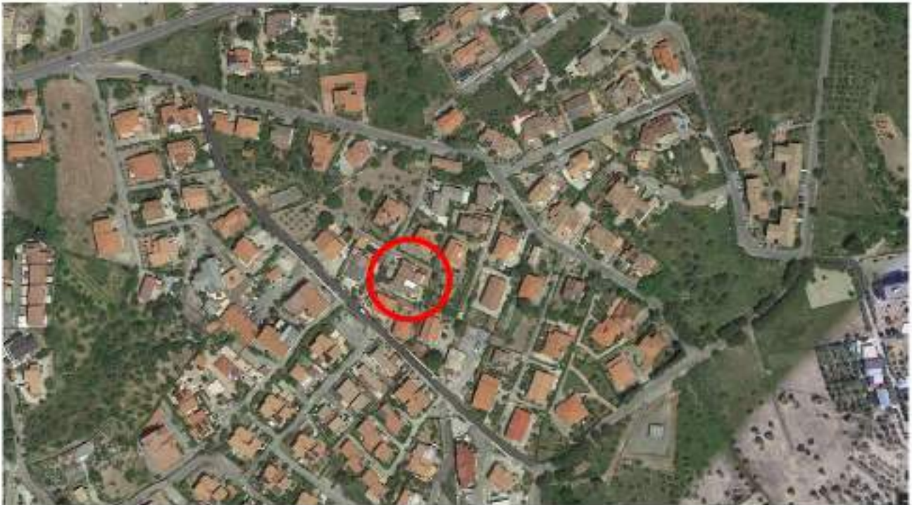
Figura 1: ubicazione degli immobili oggetto di pignoramento.