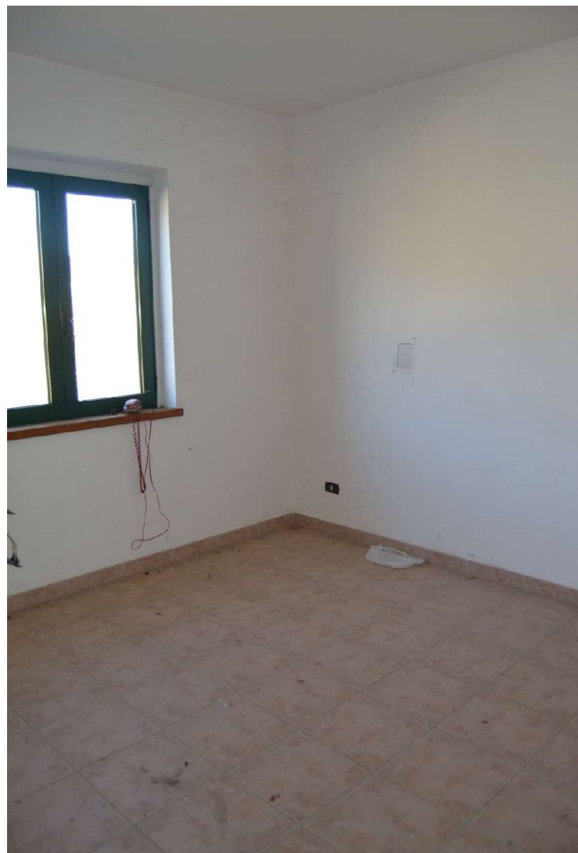
Il corpo uffici –w.c. – mensa e spogliatoi