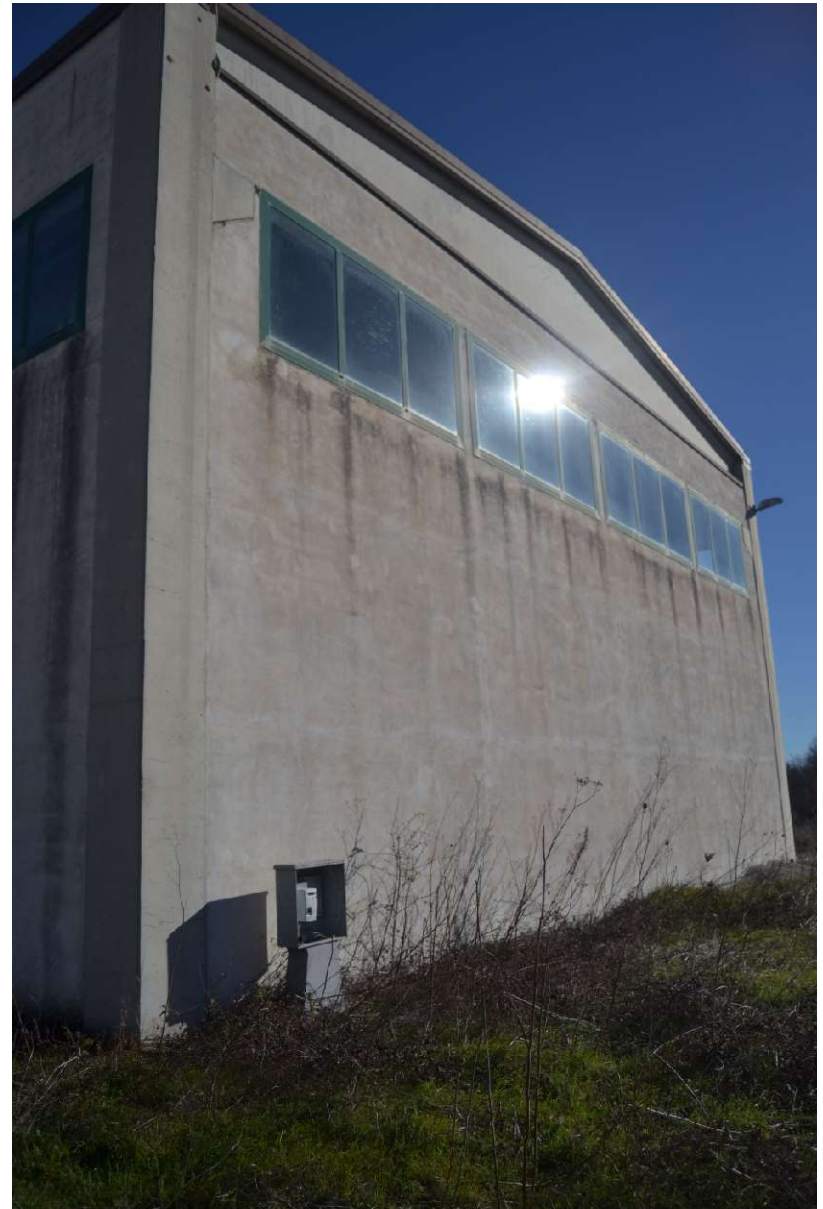
Facciata sud -ovest