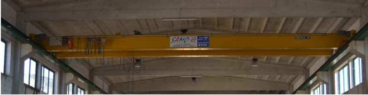
gru a ponte bitrave, datata 2005, Classe A5, ed avente una capacità max di sollevamento di 6300 Kg