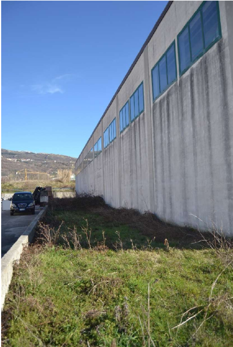
Facciata nord -ovest