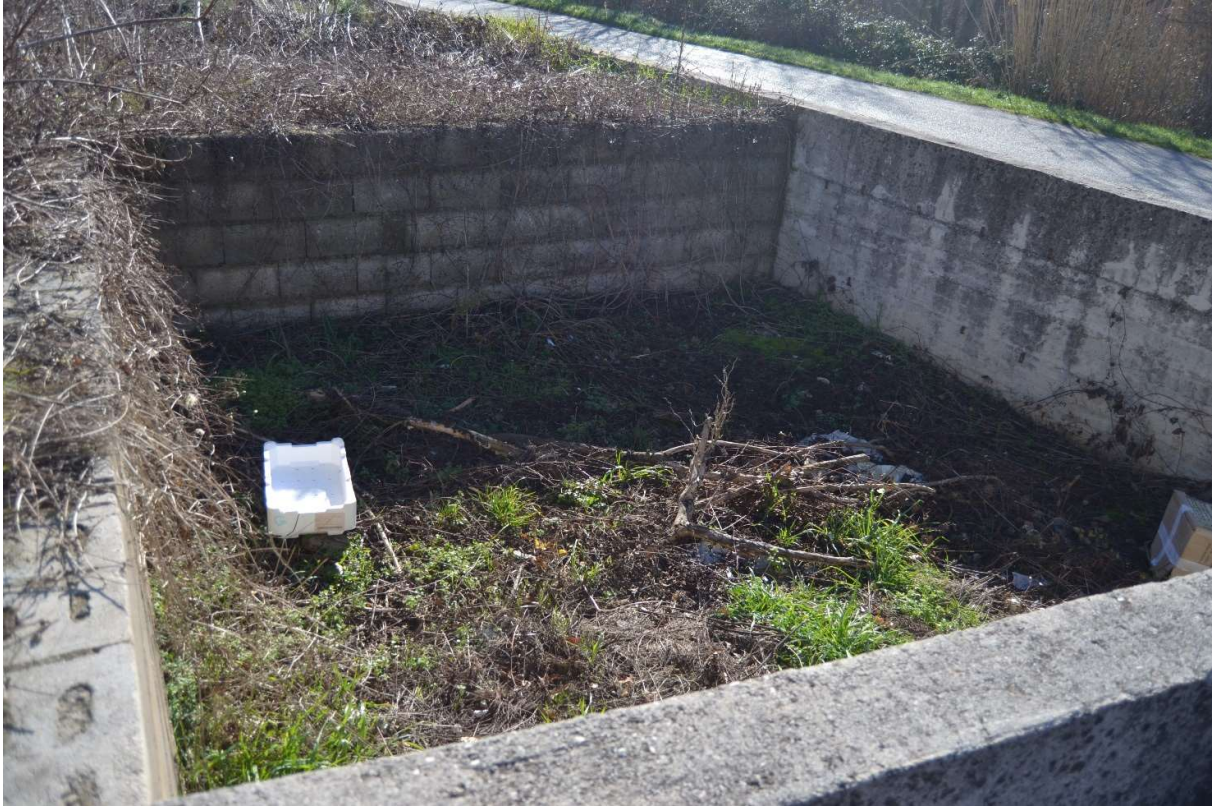
Fossa all'angolo ovest del Lotto