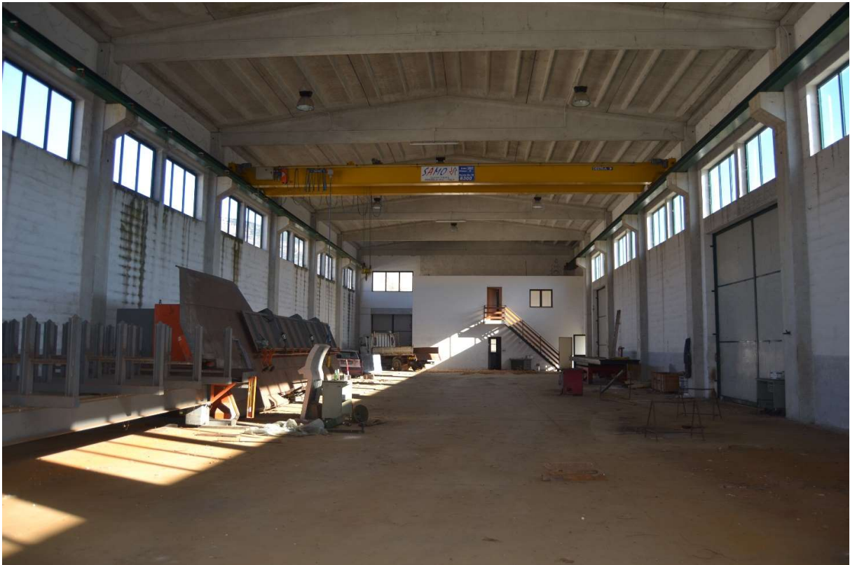
Interno del capannone con vista lato uffici