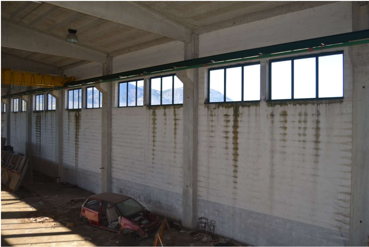
Da notare le infiltrazioni di acqua piovana