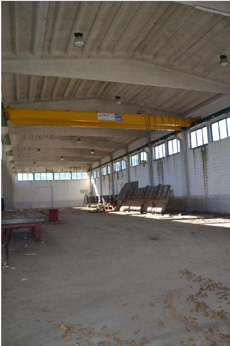
Interno con vista sud-ovest