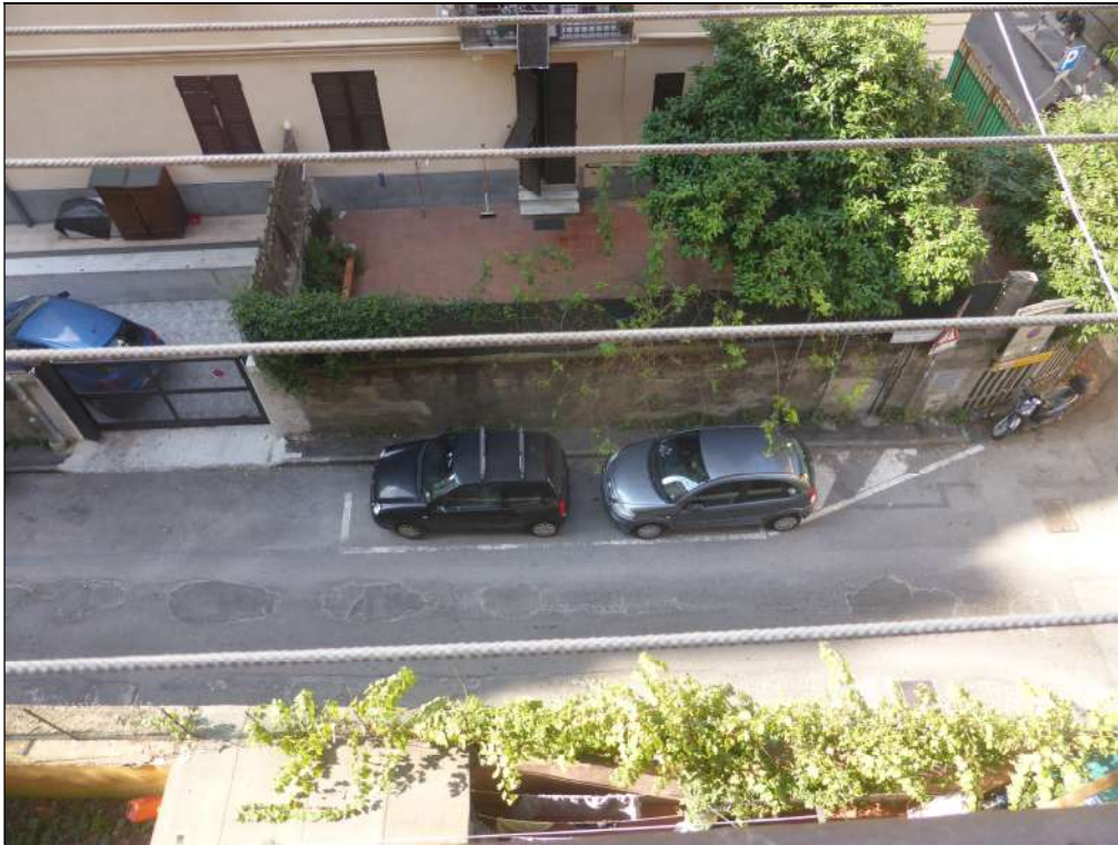
FOTOGRAFIA N. 21 Vista dal balcone della cucina su Via Donaver