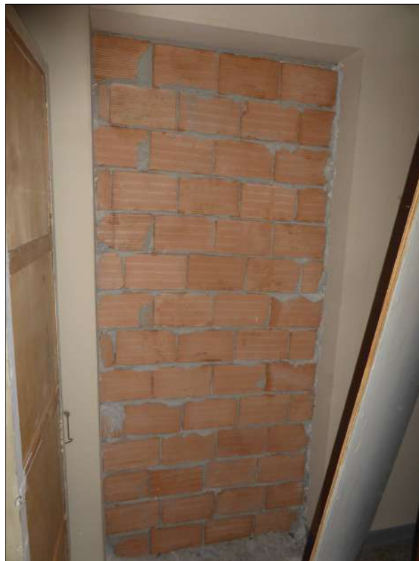
FOTOGRAFIA N. 30 Muro di divisione con l'attiguo int. 15 a seguito di accorpamento del presente locale posto appena entrando sulla sinistra; anche in questo caso si tratta di opere da completare