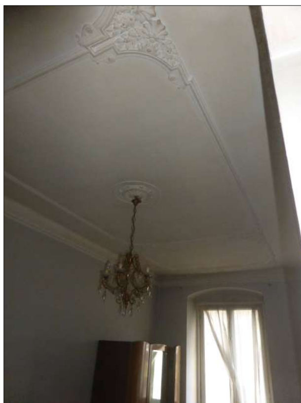
FOTOGRAFIA N. 24 Particolare soffitti