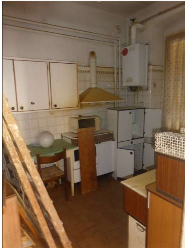
FOTOGRAFIA N. 19 Cucina attigua al bagno