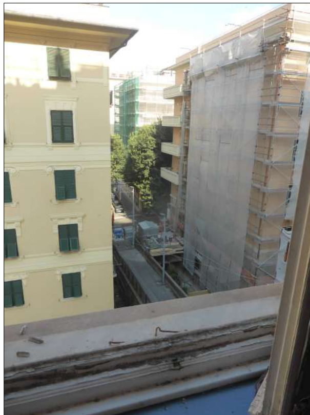
FOTOGRAFIA N. 14 Vista verso Via Bozzano