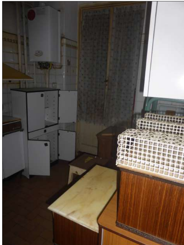
FOTOGRAFIA N. 20 Porta finestra della cucina con accesso sul balcone lato Via Donaver