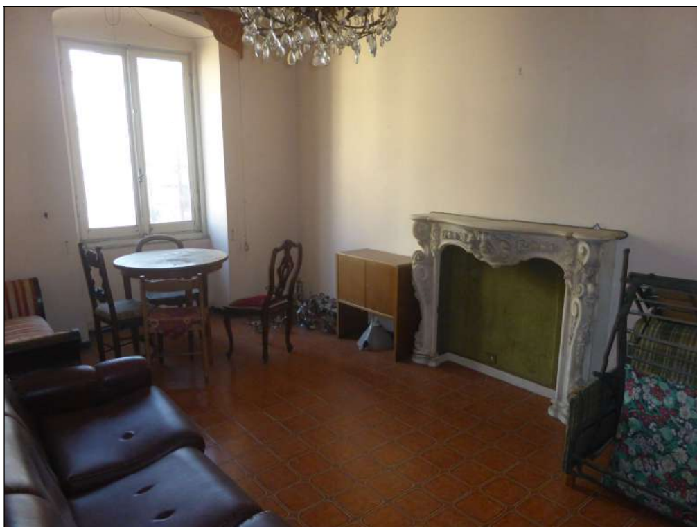
FOTOGRAFIA N. 11 Particolare della predetta stanza