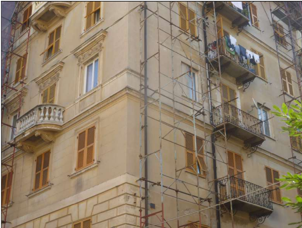
FOTOGRAFIA N. 4 Particolare della predetto angolo ove è ubicato l'appartamento - balcone tondo a sinistra nella facciata est e balcone normale nella facciata sud