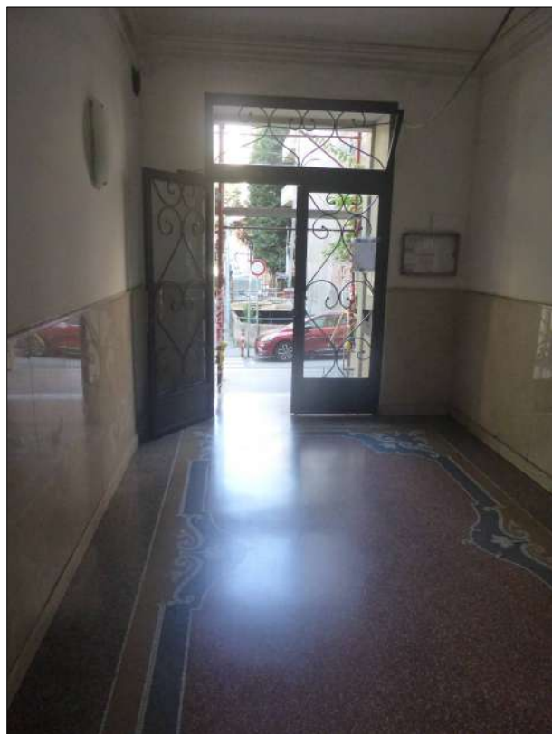
FOTOGRAFIA N. 6

Portone ed atrio nella facciata est con, in secondo piano, la prima rampa del vano scala