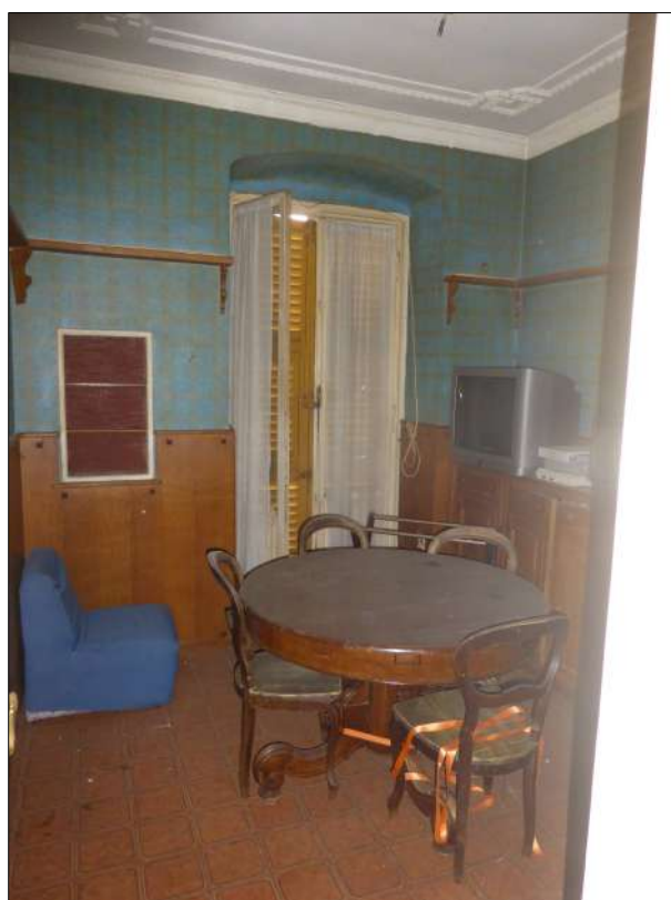
FOTOGRAFIA N. 12 Stanza con il balcone tondo prospiciente il fronte est