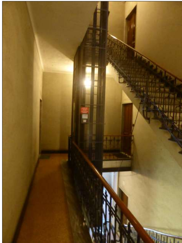
FOTOGRAFIA N. 8 Primo piano dove parte l'ascensore