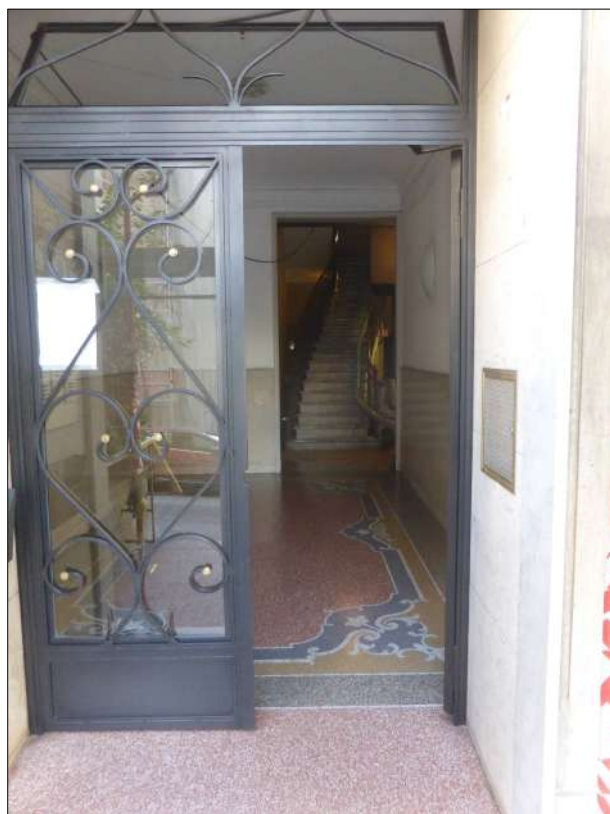
FOTOGRAFIA N. 5

Portone ed atrio nella facciata est con, in secondo piano, la prima rampa del vano scala