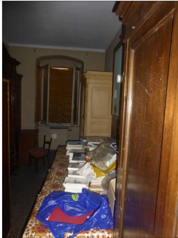
FOTOGRAFIA N. 29 Ultima stanza lato Via Donaver