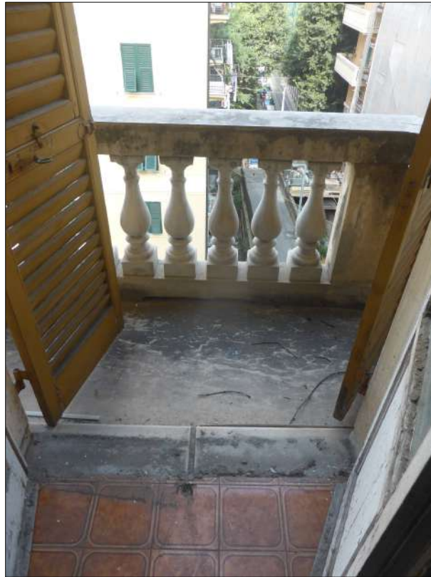
FOTOGRAFIA N. 13 Balcone tondo