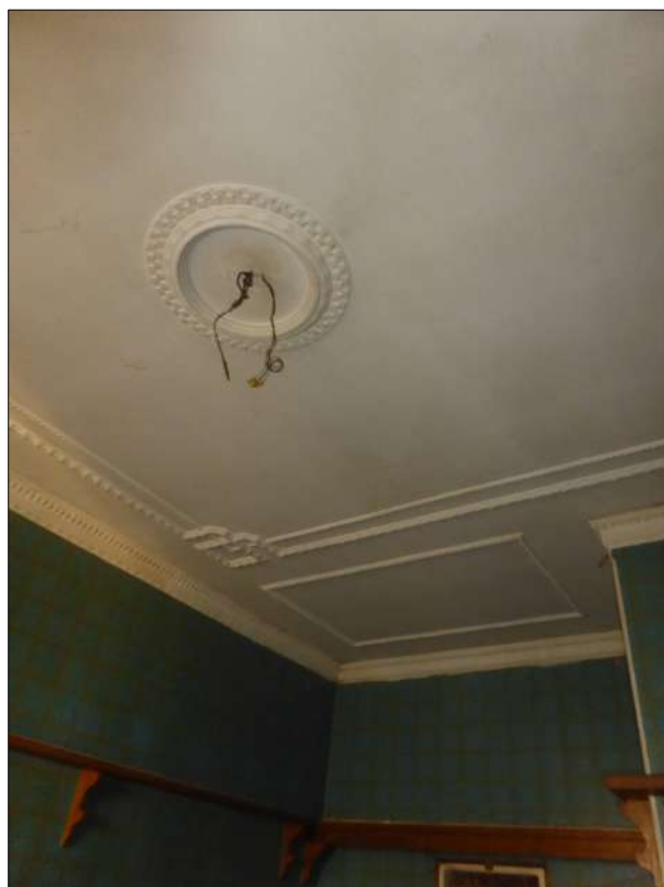
FOTOGRAFIA N. 23 Particolare soffitti