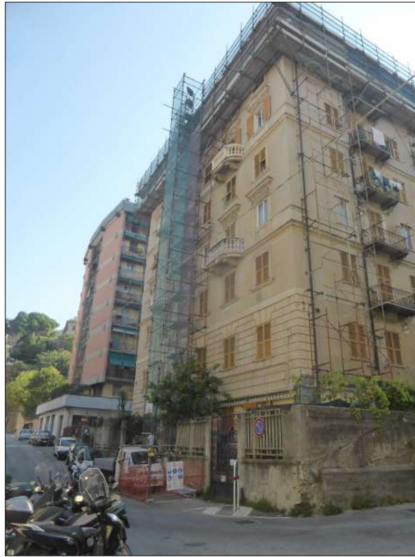
FOTOGRAFIA N. 3 Angolo sud-est e facciata sud su Via Donaver