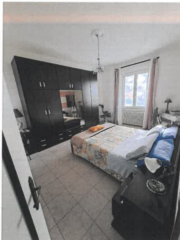
Foto 08 - camera