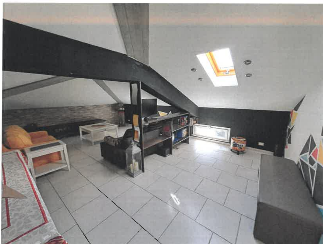
Foto 10 - soffitta