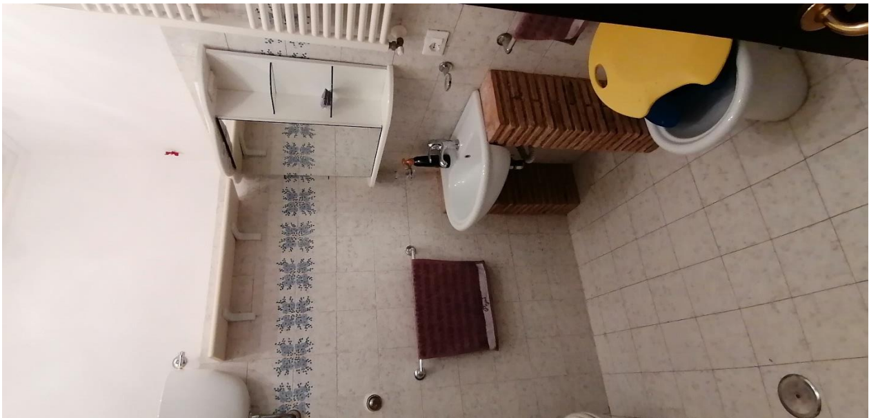
FOTO 11 Bagno zona notte