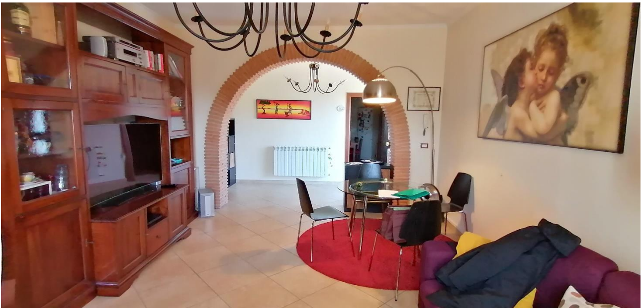
FOTO 3 Soggiorno