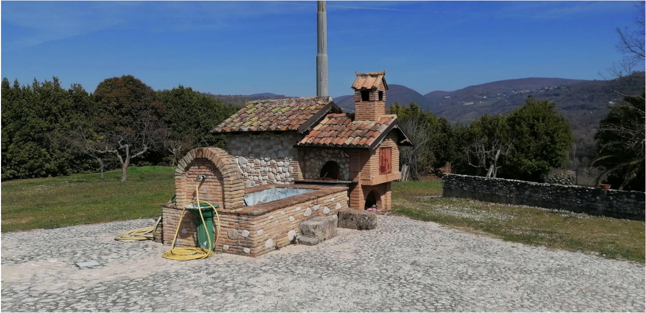
FOTO 16 Particolare corte