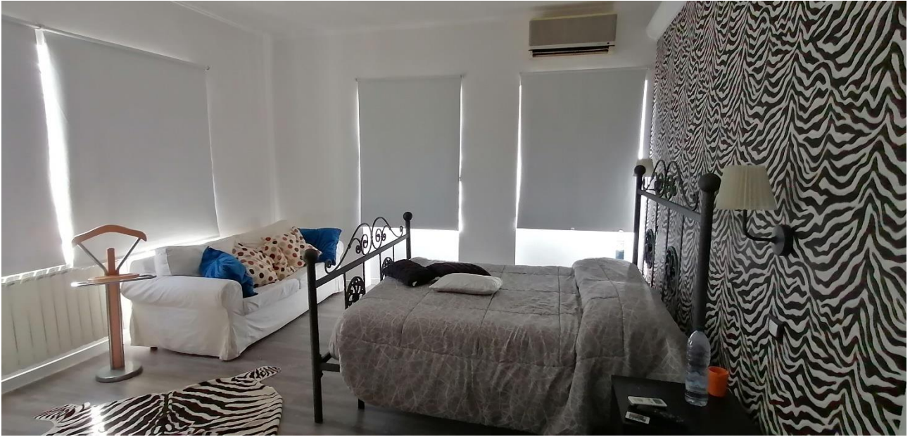
FOTO 6 Vano letto