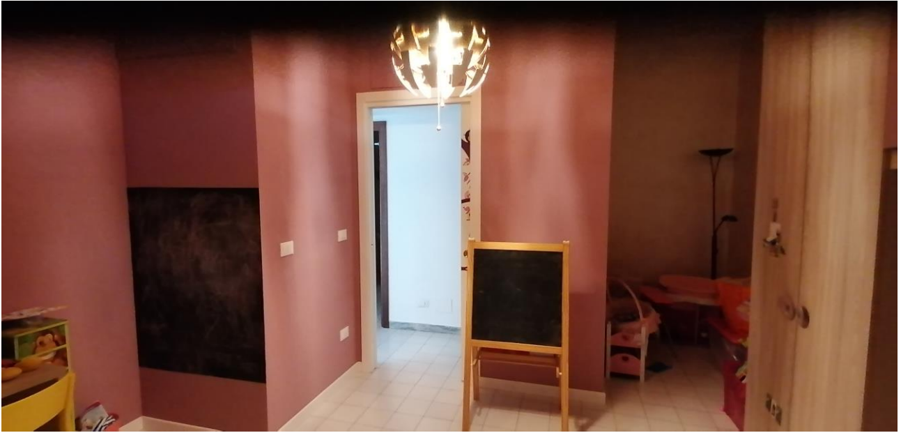
FOTO 8 vano letto