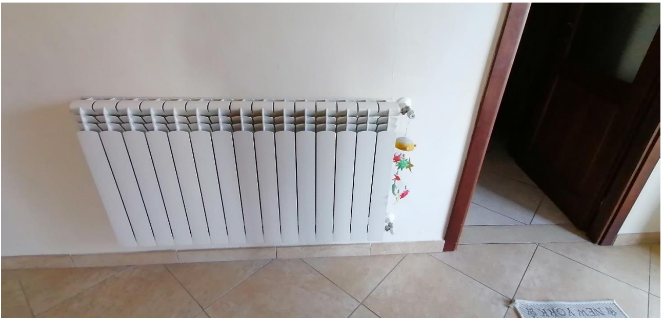
FOTO 15 Particolare elementi radianti