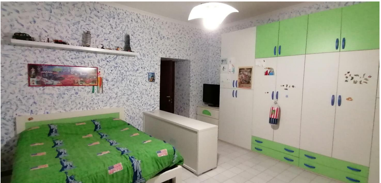
FOTO 9 Vano letto