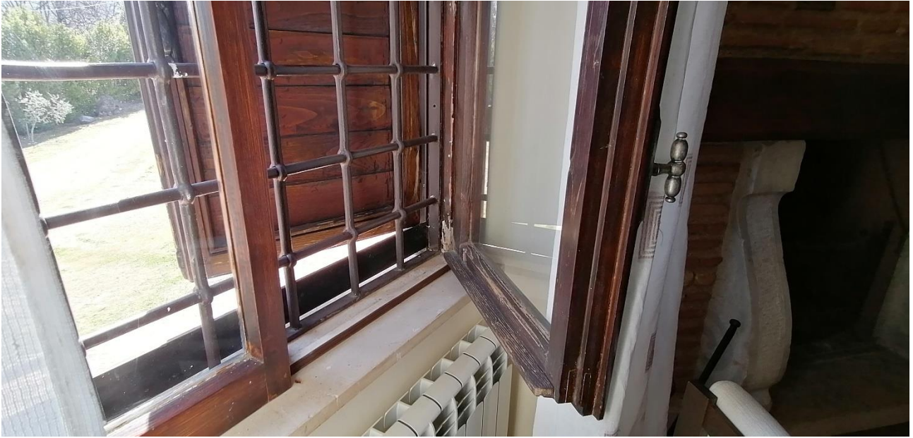
FOTO 14 Particolare infisso esterno