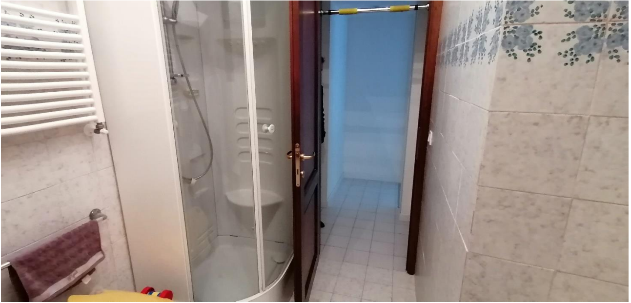
FOTO 10 Bagno zona notte