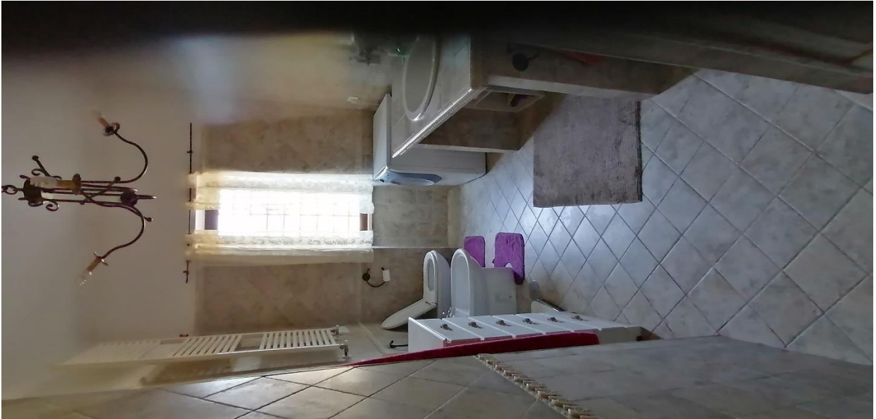
FOTO 12 Bagno principale