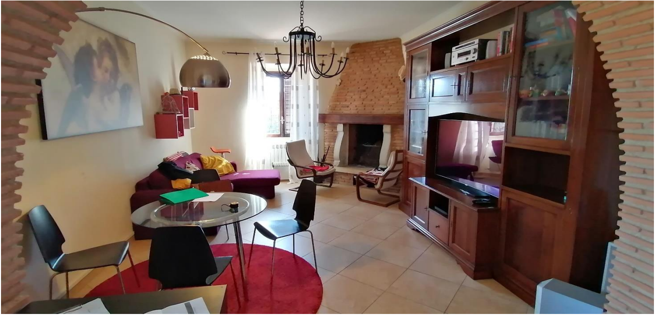
FOTO 4 Soggiorno