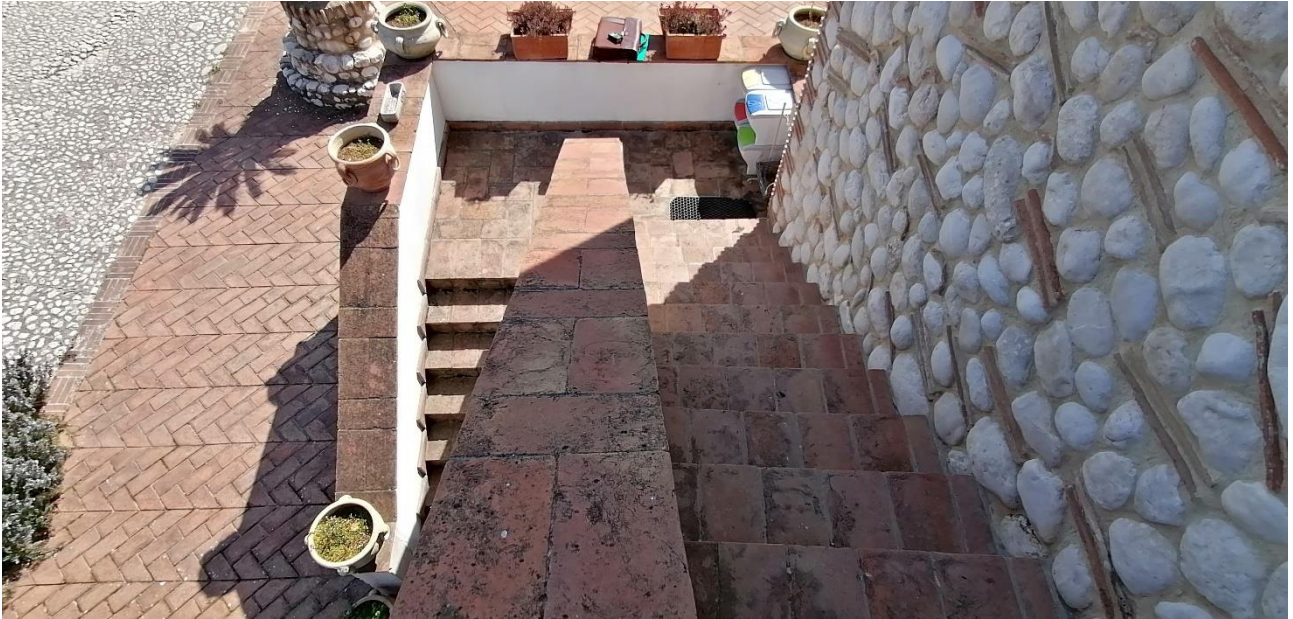
FOTO 2 Scala accesso esterna