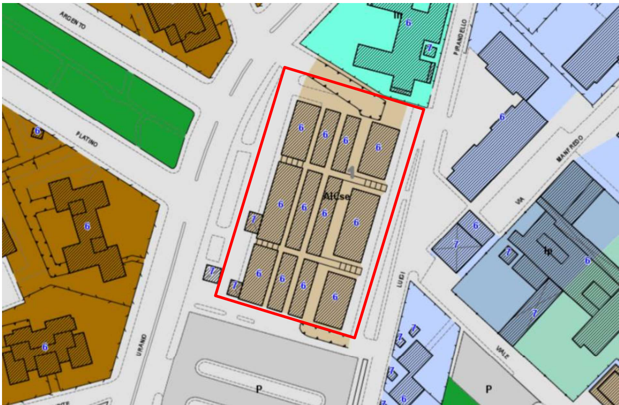
Figura 1 – Estratto Regolamento Urbanistico

L'unità immobiliare oggetto della presente relazione è ubicata tra viale Uranio e via Pirandello e dalla consultazione del Regolamento Urbanistico vigente del Comune di Grosseto approvato con D.C.C. n. 48/2013 e D.C.C. n. 35 e 115/2015 ricade nel UTOE Grosseto, Perimetro "Limite del centro abitato di Grosseto"- Attrezzature di interesse comune: Servizio, normata dall'art. 80 del Regolamento Urbanistico vigente.