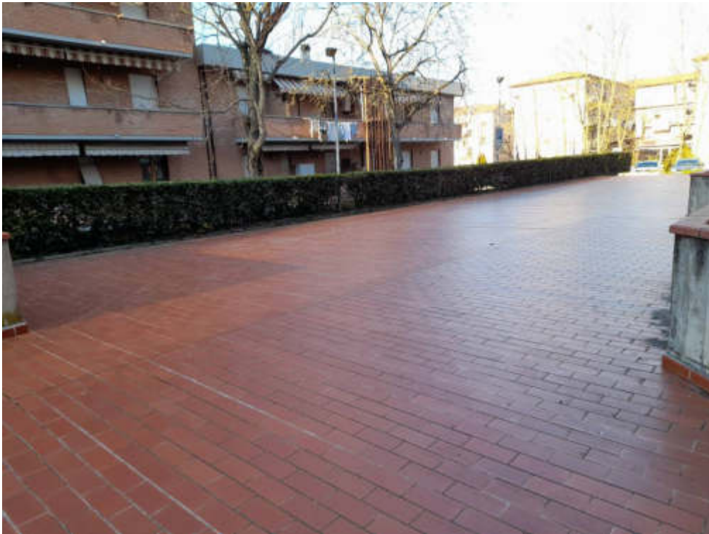
Lastrico solare edificio B