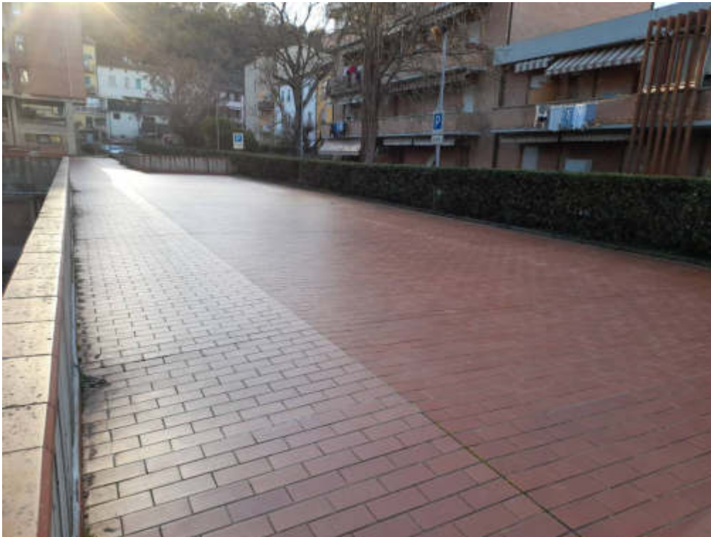
Lastrico solare edificio B