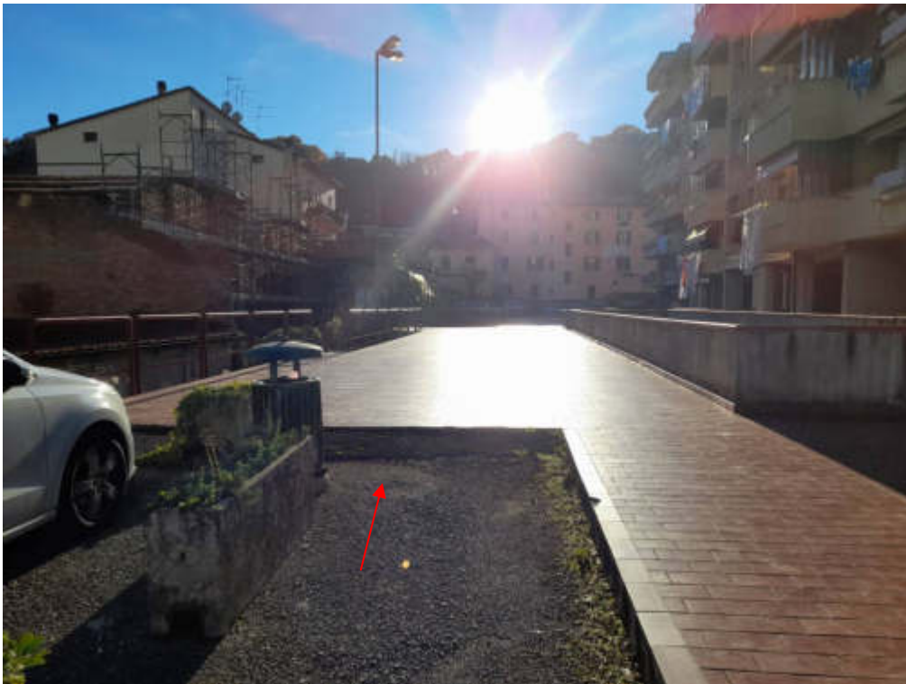
Rampa di accesso lastrico solare edificio D