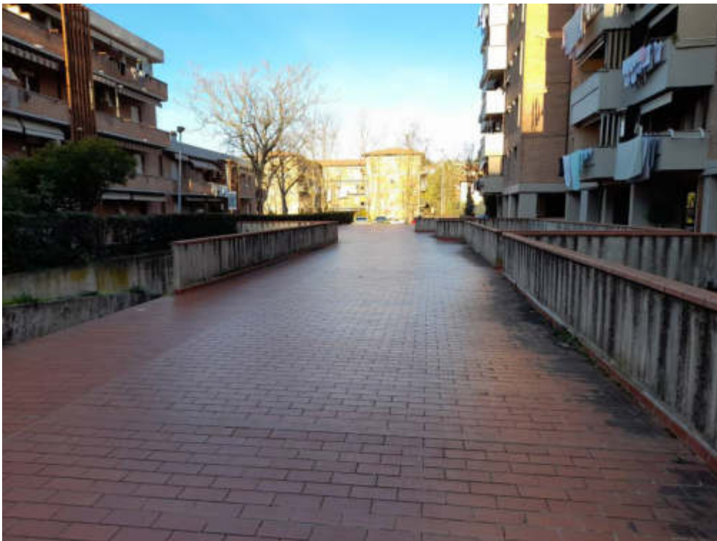
Lastrico solare edificio B