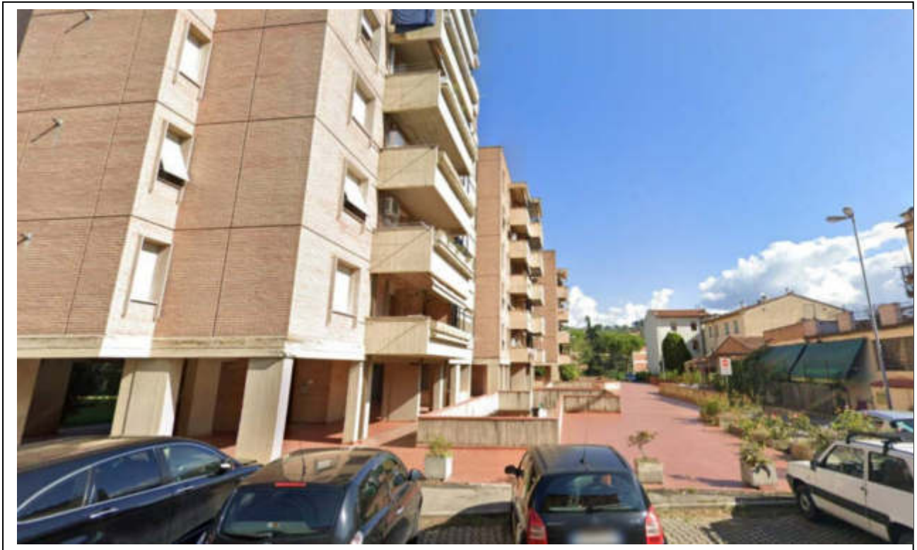
Lastrico edificio D