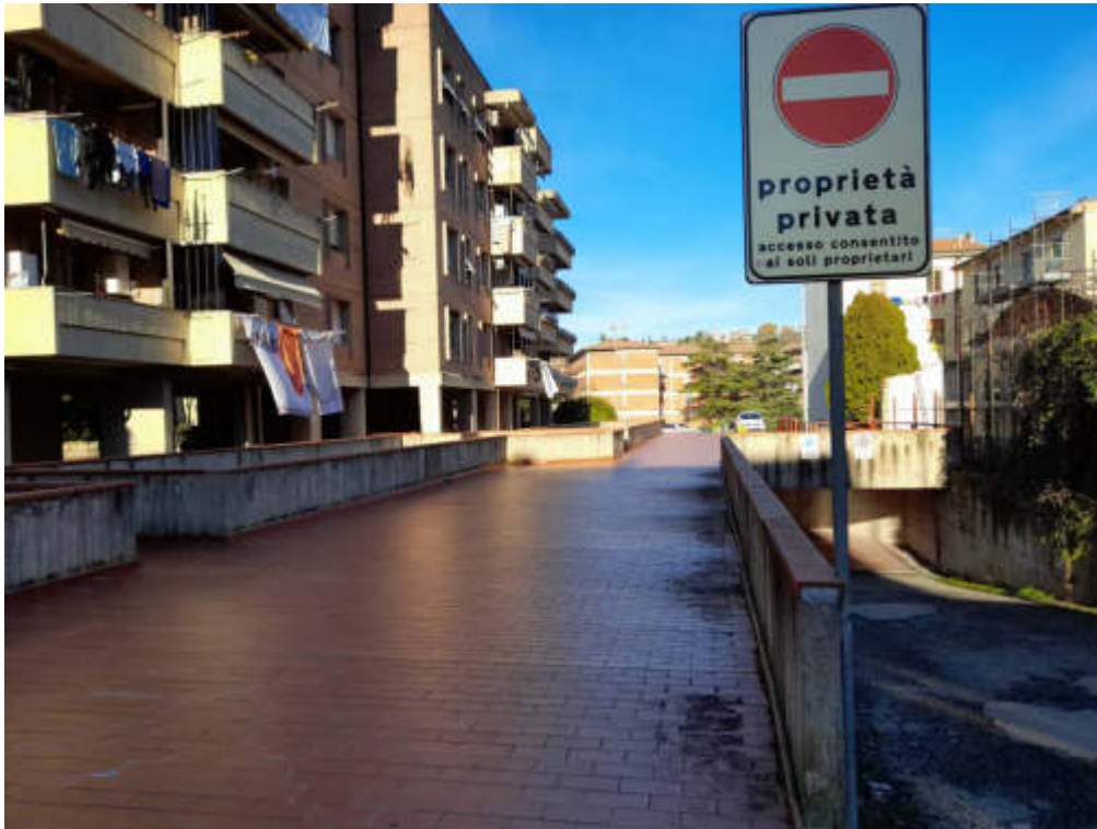
Lastrico edificio D