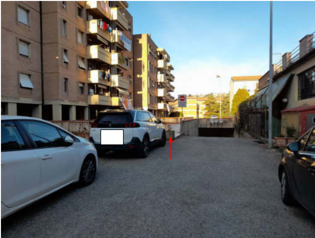
Rampa di accesso lastrico solare edificio D