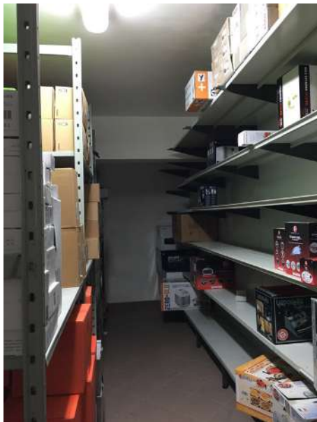
Foto n. 15 - Vano comunicante dei Lotto A e B