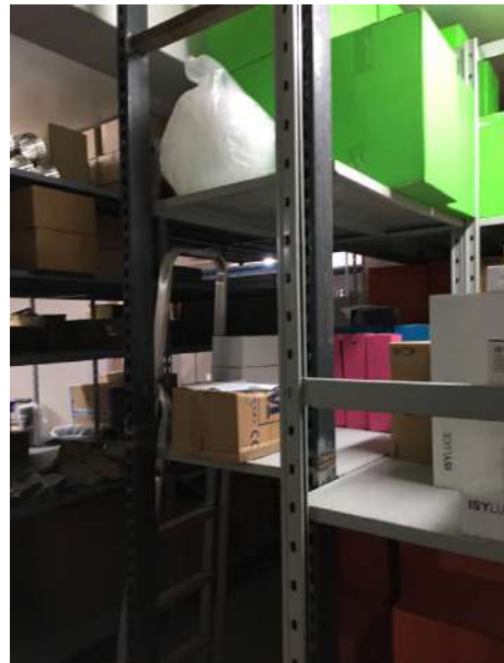
Foto n. 16 - Vano comunicante dei Lotto A e B