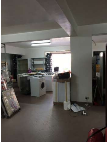
Foto n. 5 - Vano comunicante dei Lotto A e B

Allegato A - Documentazione fotografica - Lotti A e B