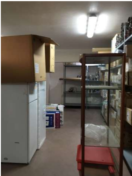
Foto n. 7 - Vano comunicante dei Lotto A e B