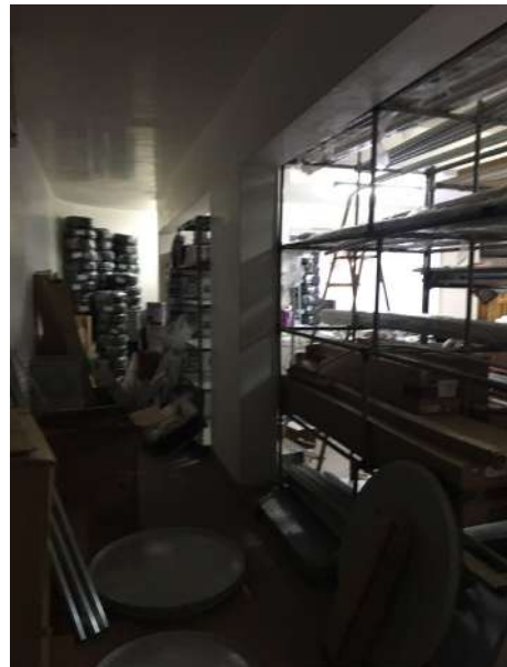
Foto n. 12 - Vano comunicante dei Lotto A e B