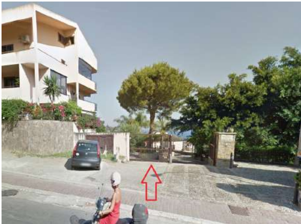
Foto n. 1 - Ingresso carrabile prospiciente su Via Giubileo Magno

Allegato A - Documentazione fotografica - Lotti A e B