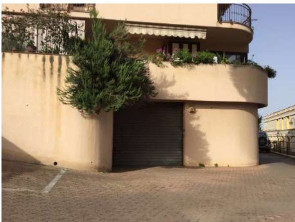
Foto n. 3 - Vista dell'ingresso del lotto A