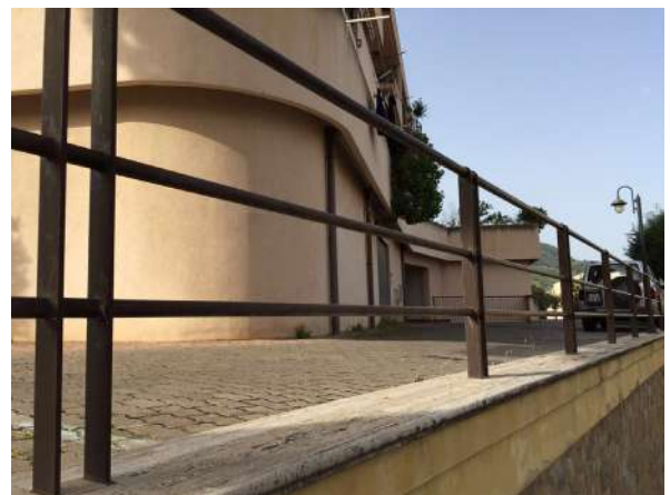
Foto n. 4 - Vista dell'ingresso del lotto B