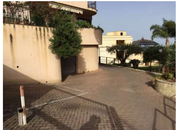
Foto n. 2 - Vista dell'ingresso del lotto A e della pertinenza esculsiva ad uso parcheggio