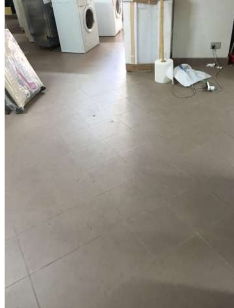
Foto n. 6 - Vano comunicante dei Lotto A e B