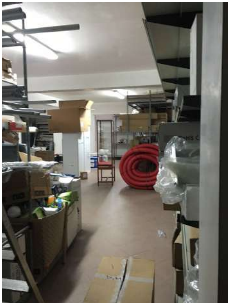
Foto n. 11 - Vano comunicante dei Lotto A e B