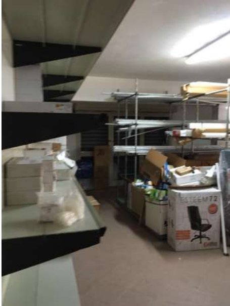
Foto n. 9 - Vista della porta di ingresso Lotto B dall'interno

Allegato A - Documentazione fotografica - Lotti A e B