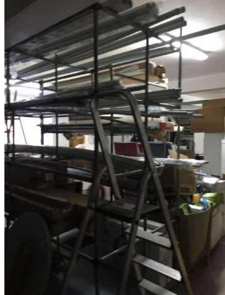
Foto n. 14 - Vano comunicante dei Lotto A e B