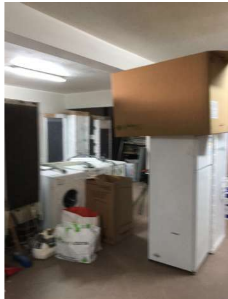
Foto n. 8 - Vano comunicante dei Lotto A e B