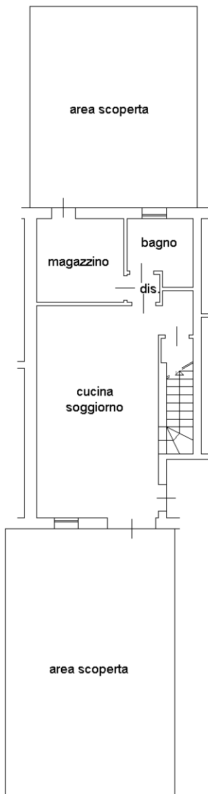
Piano terra h 2.60m con corte esclusiva