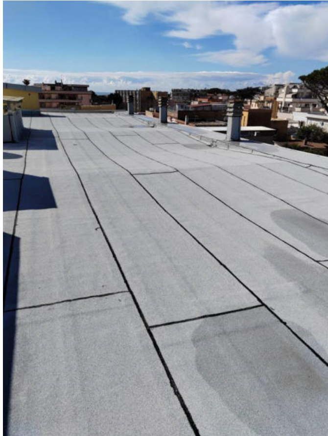
Fotografia n. 3