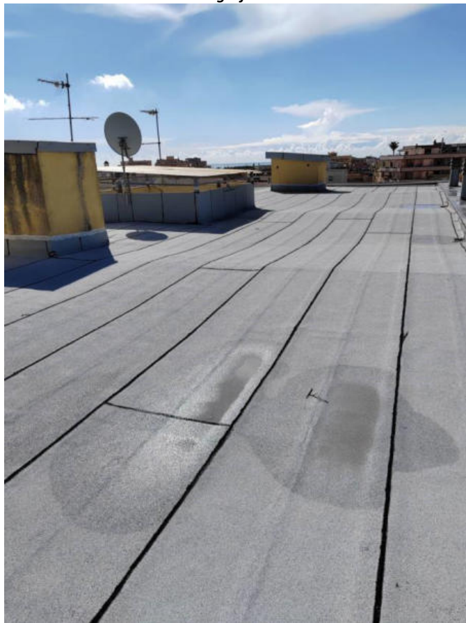
Fotografia n. 4