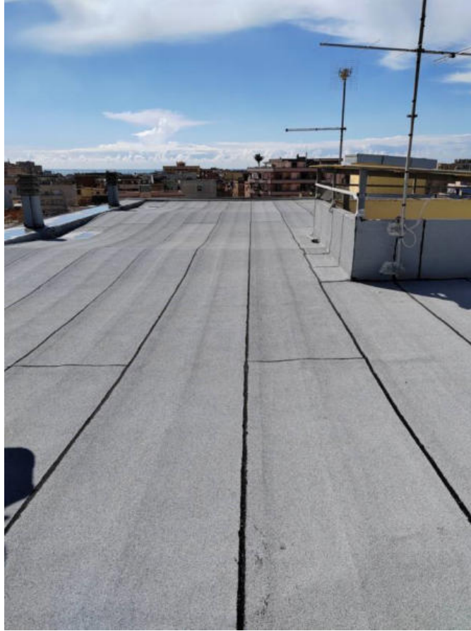
Fotografia n. 1