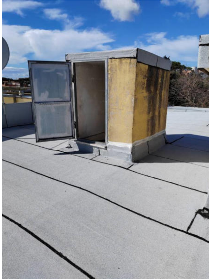
Fotografia n. 5