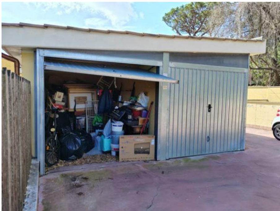
Fotografia n. 10