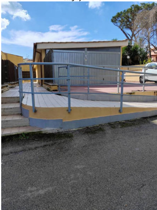
Fotografia n. 12