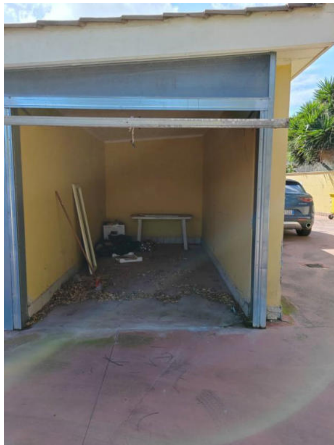
Fotografia n. 8