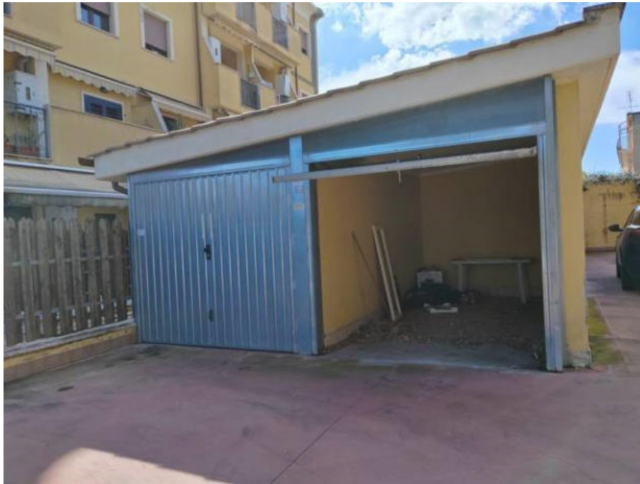
Fotografia n. 7