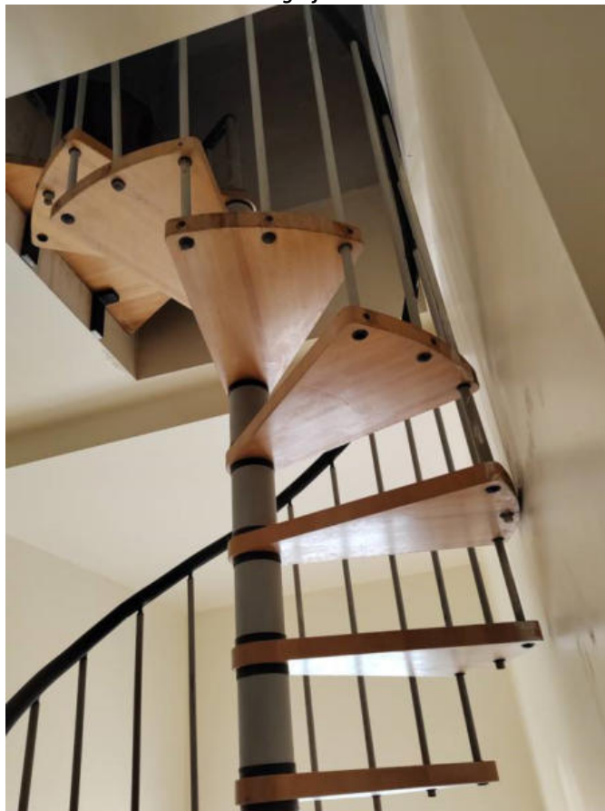
Fotografia n. 6