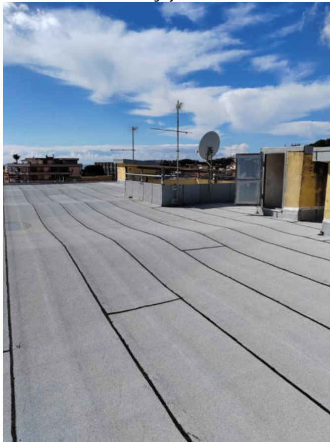
Fotografia n. 2