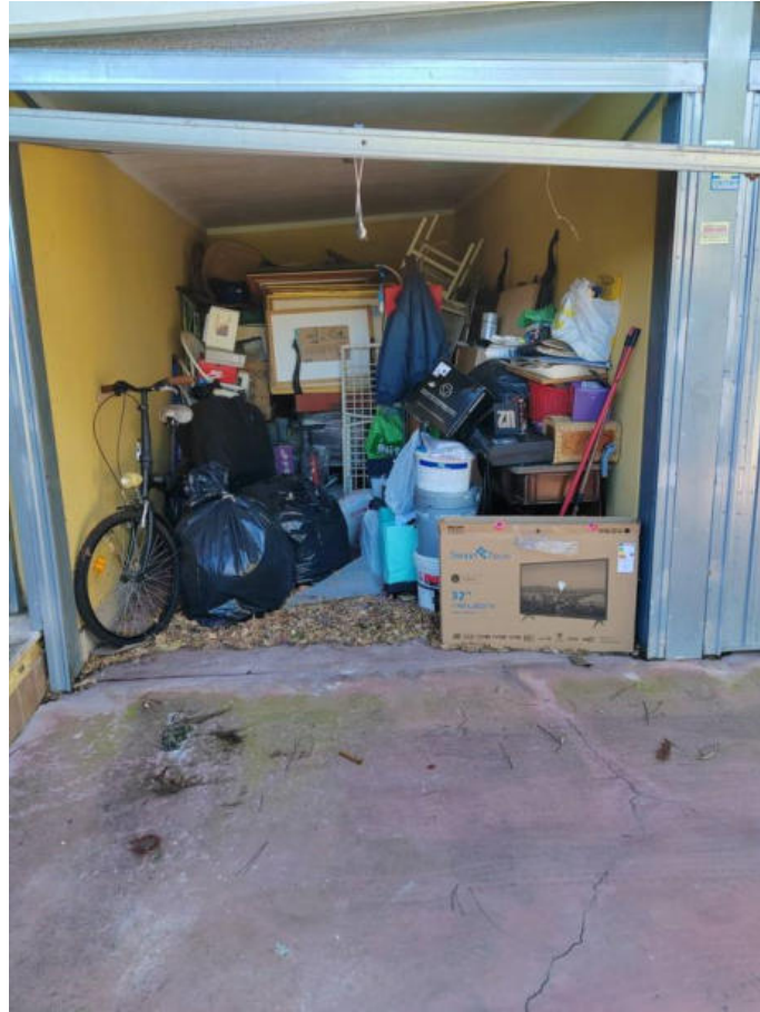
Fotografia n. 9