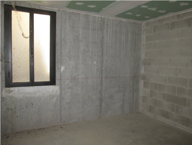
LOTTO 031.A1. COMPARTO D box 1490/25