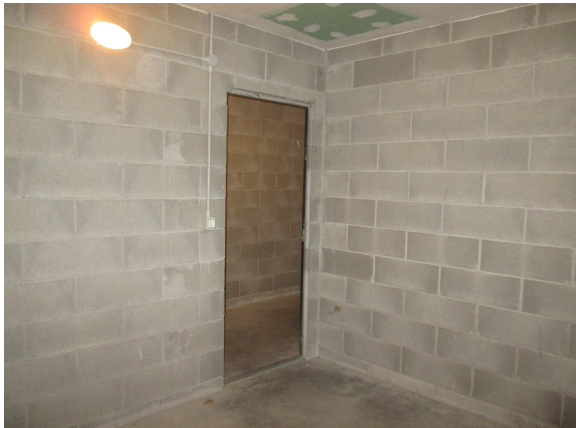
LOTTO 027.A1. COMPARTO D box 1490/34