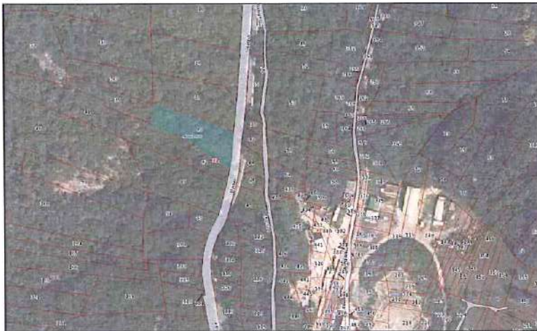
Ortofoto con sovrapposizione mappa catastale