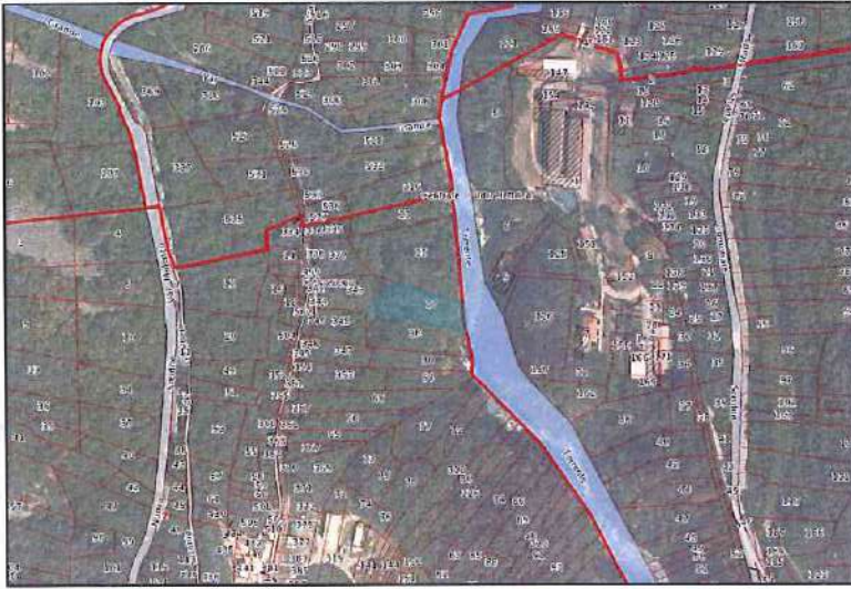
Ortofoto con sovrapposizione mappa catastale