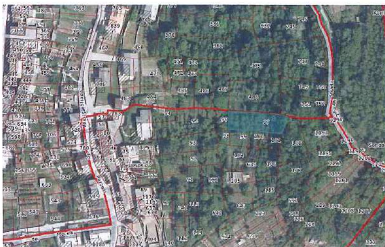
Ortofoto con sovrapposizione mappa catastale