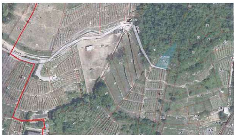
Ortofoto con sovrapposizione mappa catastale