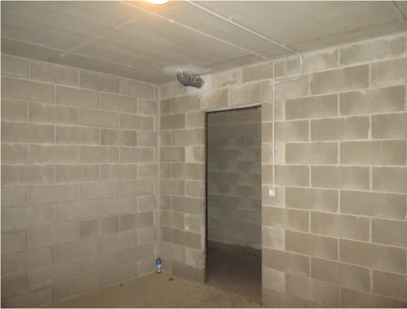
LOTTO 010.A1. COMPARTO B box