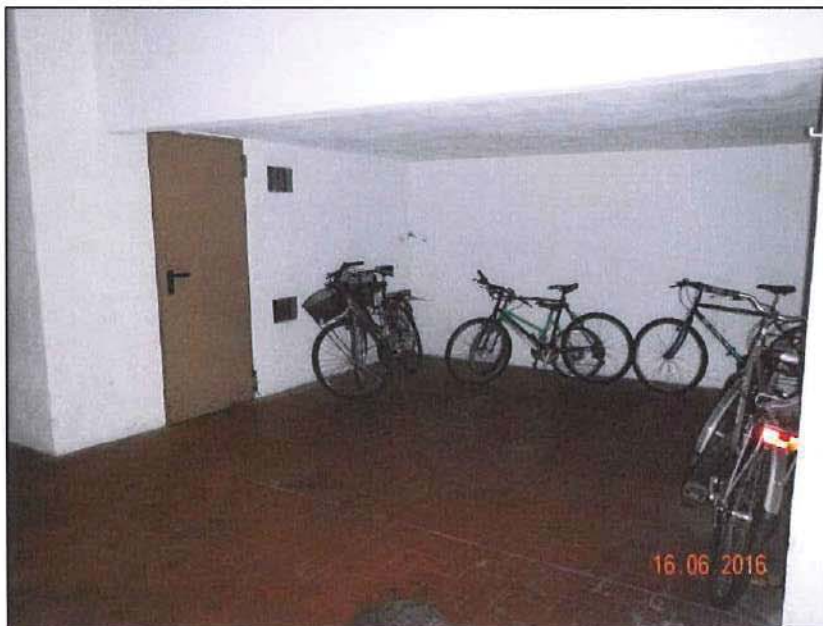
Vista sub 57 deposito bici e porta ingresso sub 59