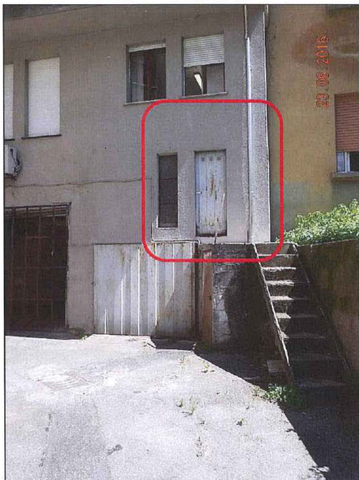
Vista dal piazzale a sud ingresso al sub 155 dalla scala in cls