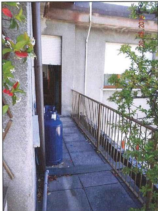
Vista terrazzo al piano 7 - fronte est