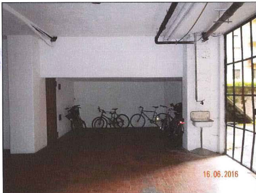
Vista dal corsello sub 57 deposito bici