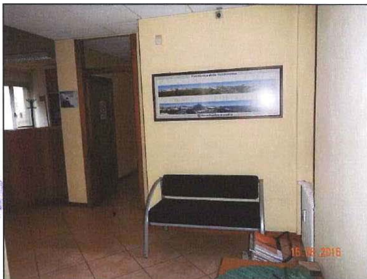
Vista interna reception