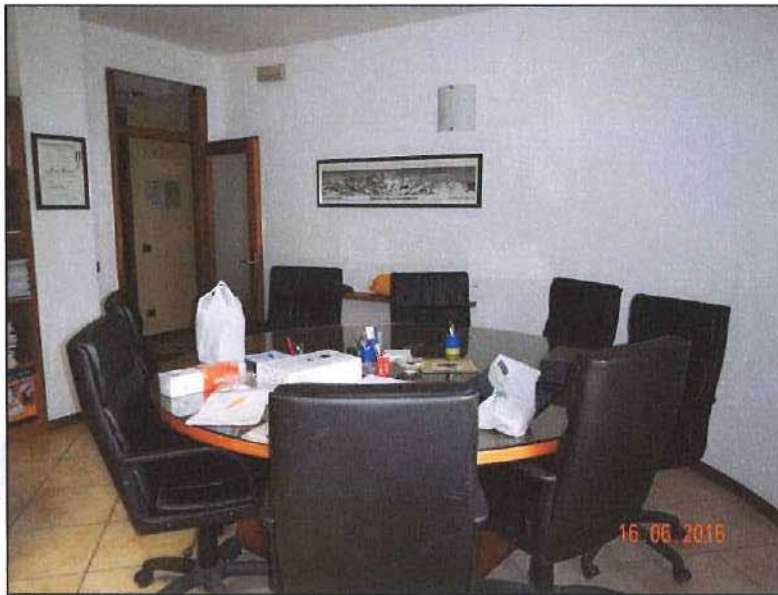
Vista interna uffici