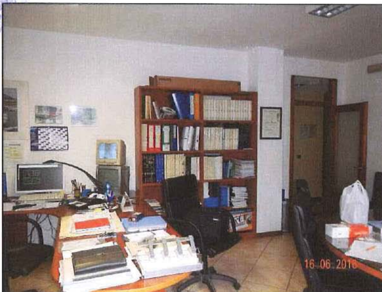
Vista interna uffici