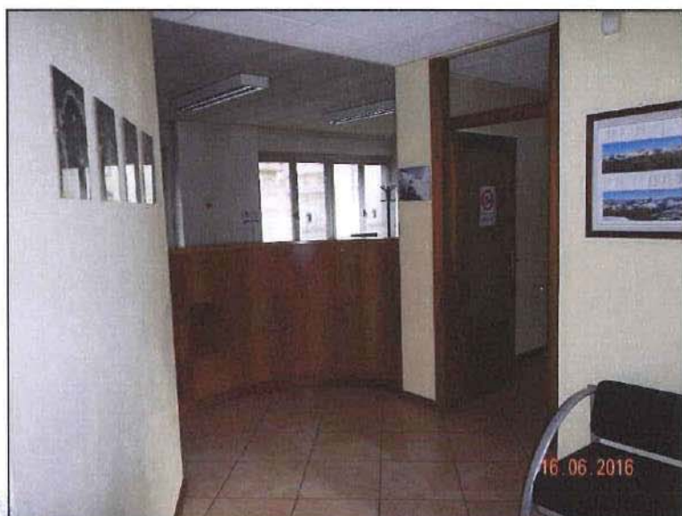
Vista interna reception