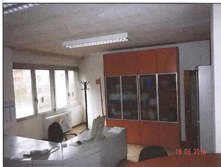
Vista interna uffici