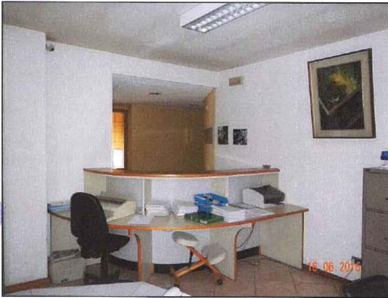
Vista interna uffici