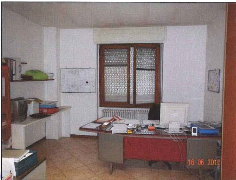
Vista interna uffici