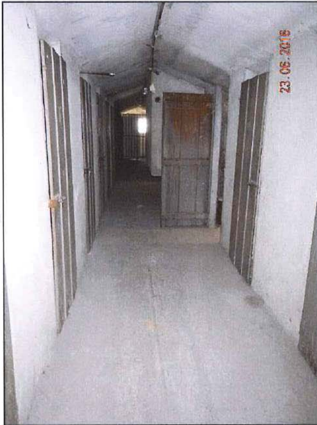
Vista corridoio d'accesso alle soffitte