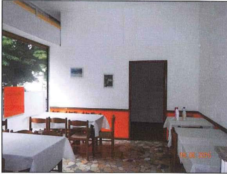
Vista interna sala