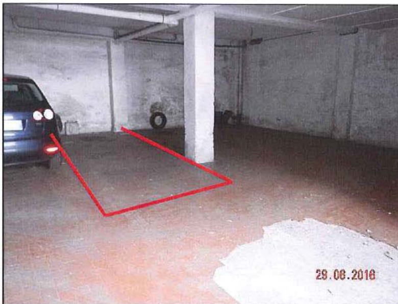
Vista posto auto sub 53

Nuovo Catasto dei Fabbricati: foglio 41 - particella 287 sub 53