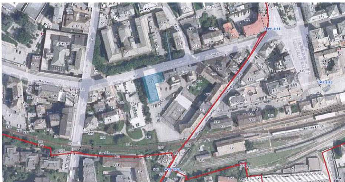
Ortofoto con sovrapposizione mappa catastale