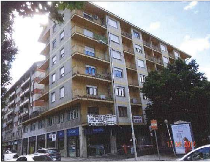
Vista esterna fronte nord- ovest