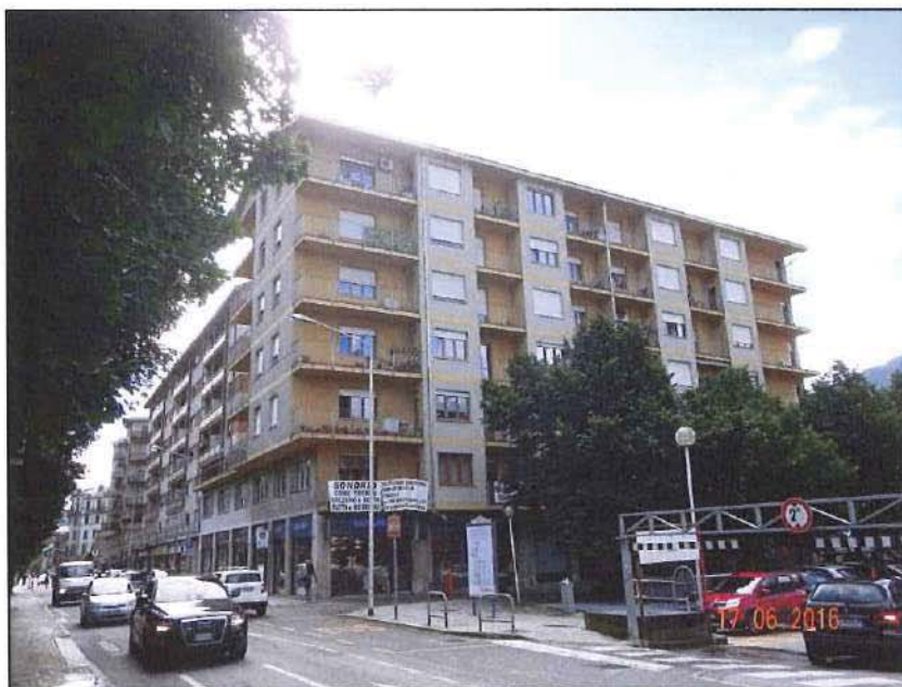
Vista esterna fronte ovest