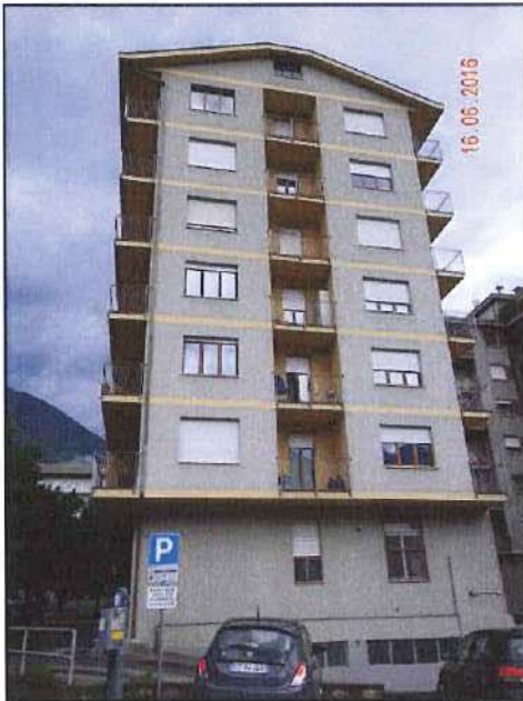
Vista esterna fronte sud