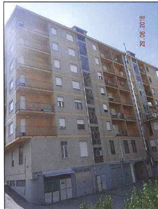
Vista esterna fronte est