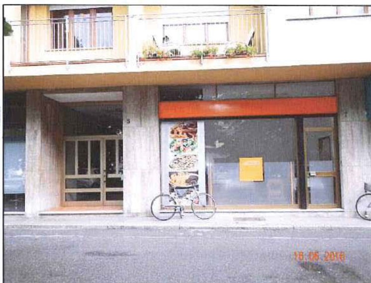
Vista ingresso dall'esterno del sub 48