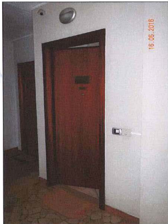
Vista ingresso sub 4

Nuovo Catasto dei Fabbricati: foglio 41 - particella 287sub 4