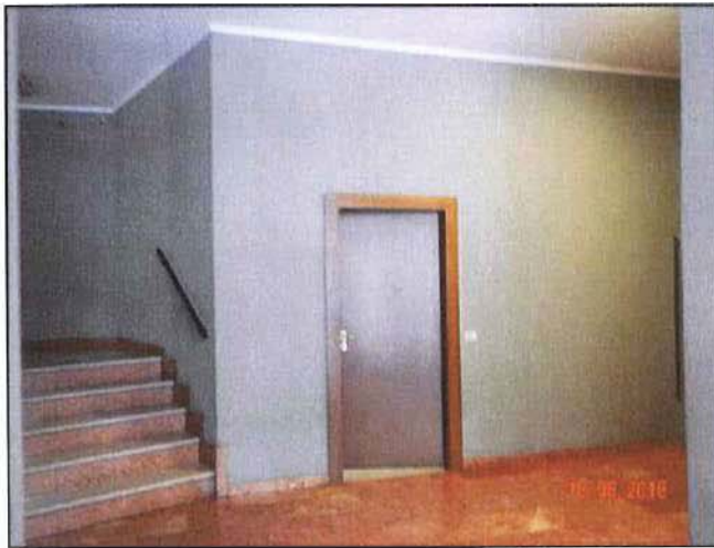
Vista ingresso sub 3