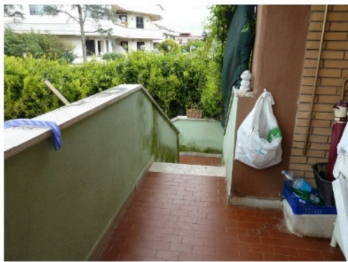
Foto n. 7 – La scala di accesso all'appartamento pignorato, posto ai piani 1° e 2°