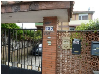
Foto n. 1 – L'accesso comune ai due villini frontali, rispetto a Lungomare degli Ardeatini, 282 dell'edificio che s'intravede sul fondo, dove a sinistra si stende la corte dell'immobile pignorato.