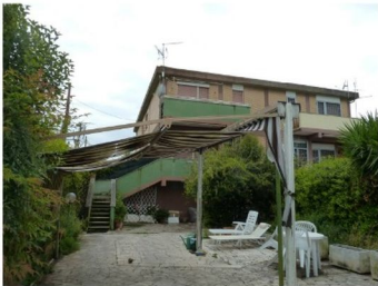
Foto n. 2 – La corte pavimentata e sul fondo la scala che raggiunge il piano 1°, dove si accede all'appartamento, attraverso il balcone frontale.