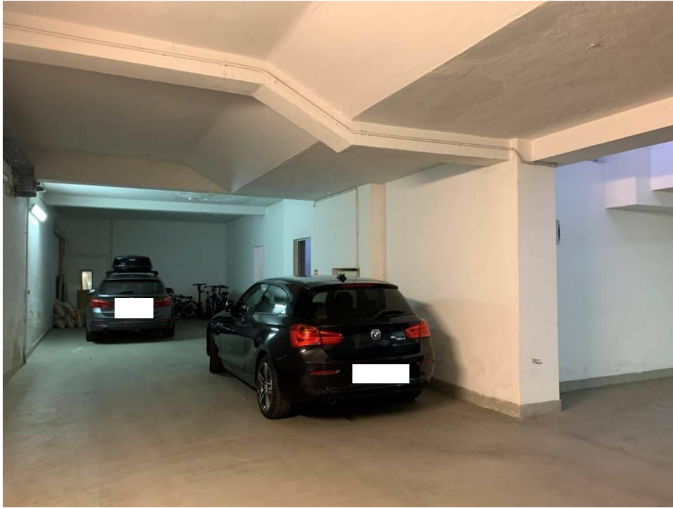
Fotografia n. 1 – Vista del corsello che conduce all'unità immobiliare I (posto auto piano interrato)