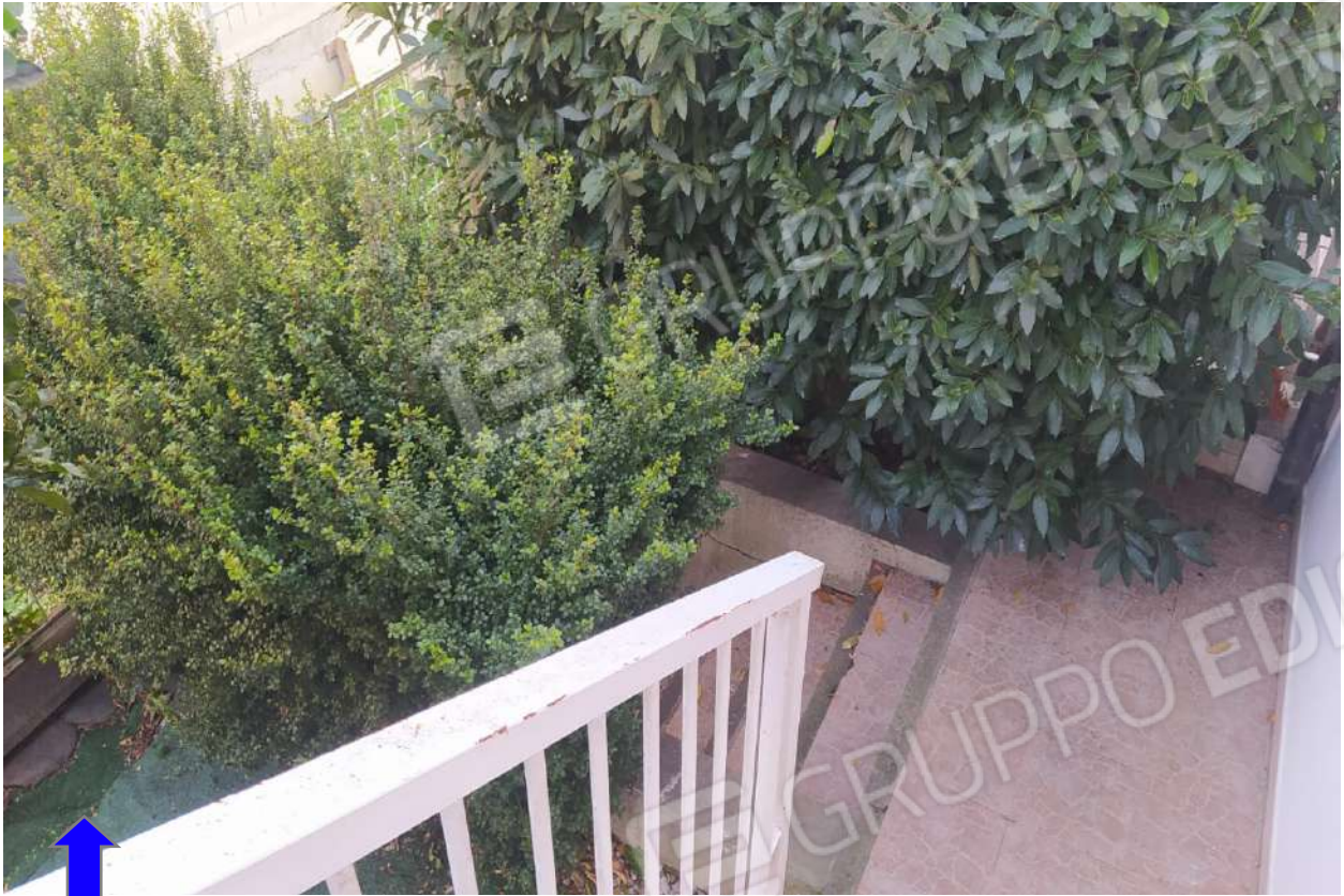
Foto 9 - Vista scaletta esterna e particolare corte-giardino privato.

Foto 10 - Vista tettoia in ferro non autorizzata prospetto secondario - terrazzino.