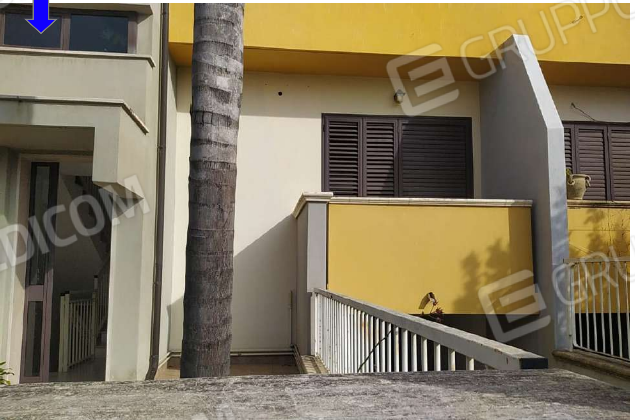
Foto 3 - Vista prospetto principale - Particolare infissi e finiture esterne.

Foto 2 - Vista ingresso androne comune-accesso dell'abitazione al piano rialzato.