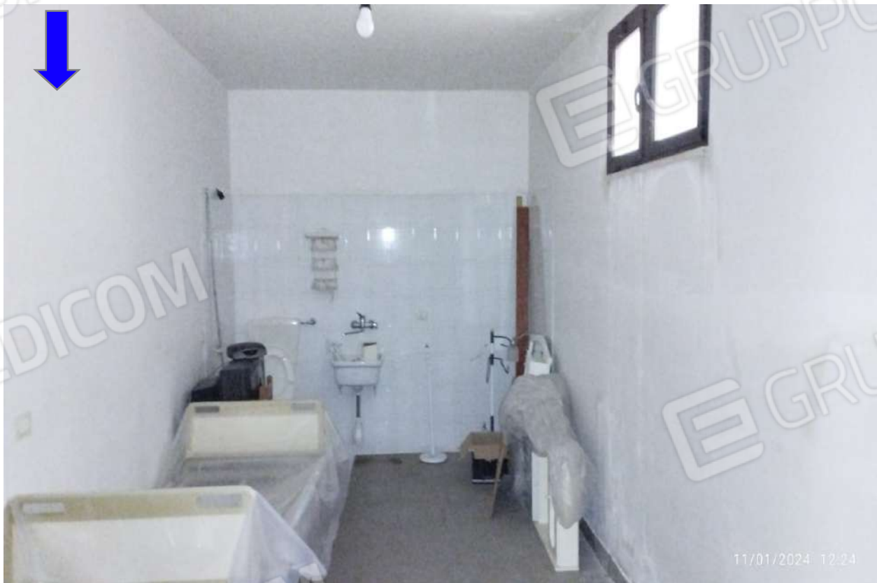
Foto 12 - Vista interna box seminterrato.