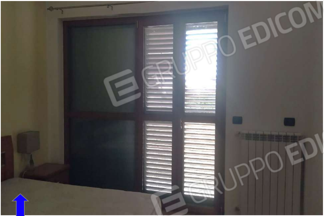
Foto 4 - Vista interna - Particolare infisso interno ed impianto radiante.