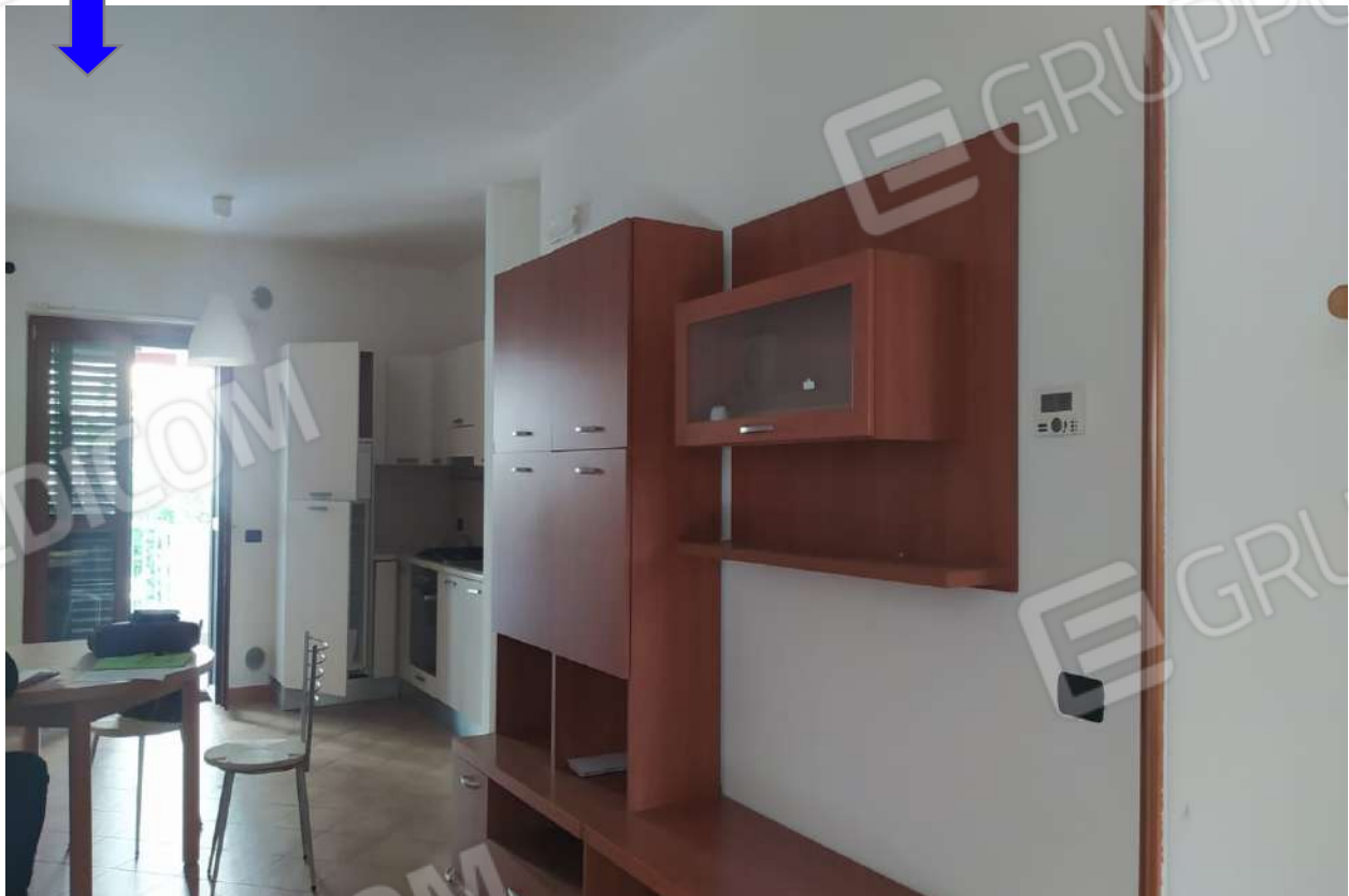
Foto 5 - Vista interna - Particolare finiture interne ed impianti.