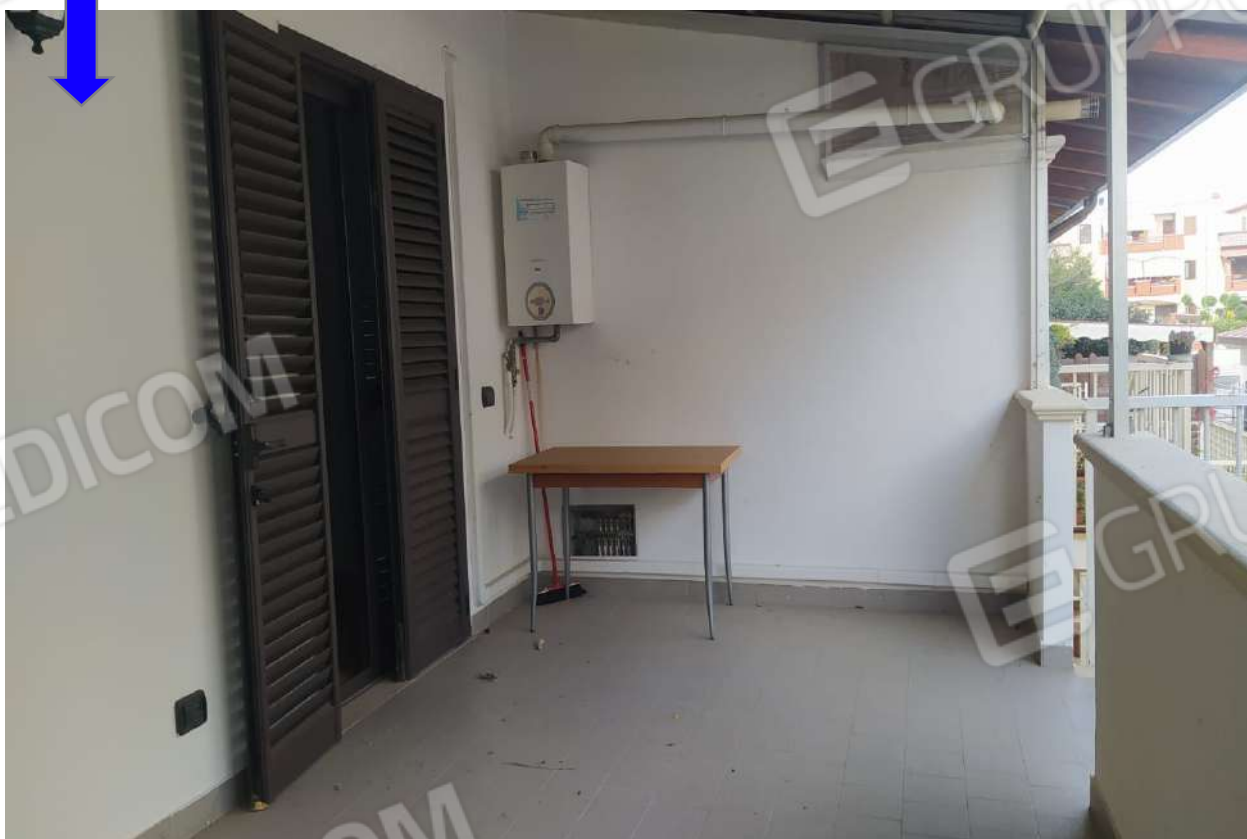
Foto 8 - Vista prospetto secondario lato terrazzino e particolare caldaia.