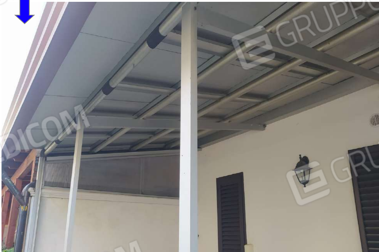
Foto 10 - Vista tettoia in ferro non autorizzata prospetto secondario - terrazzino.

Foto 9 - Vista scaletta esterna e particolare corte-giardino privato.