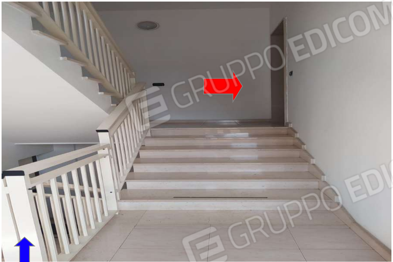
Foto 2 - Vista ingresso androne comune-accesso dell'abitazione al piano rialzato.

Foto 3 - Vista prospetto principale - Particolare infissi e finiture esterne.