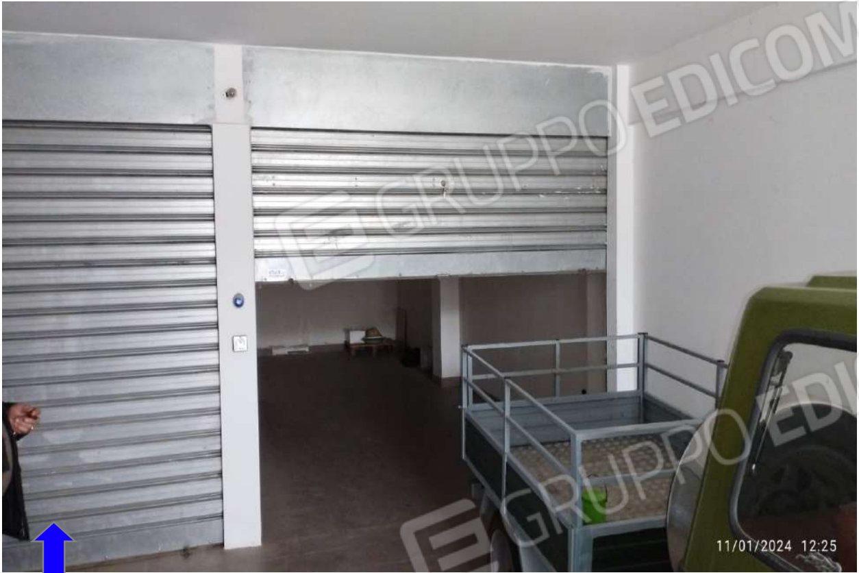
Foto 11 - Vista ingresso box piano seminterrato da via G. Gronchi e particolare finiture ed impianti interni – Foglio 60 – P.Ila 1473 – Sub. 25 .