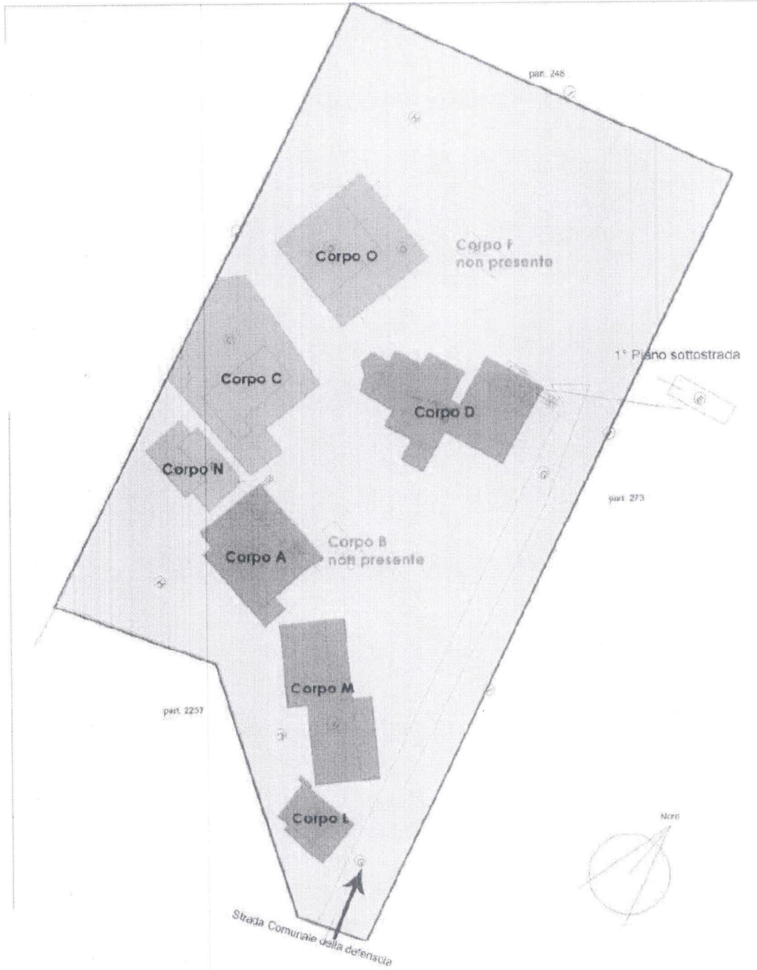
IMMAGINE 5: Stralcio dell'elaborato planimetrico catastale; individuazione dei corpi di fabbrica costituenti il Villaggio Turistico Albea Village Residence