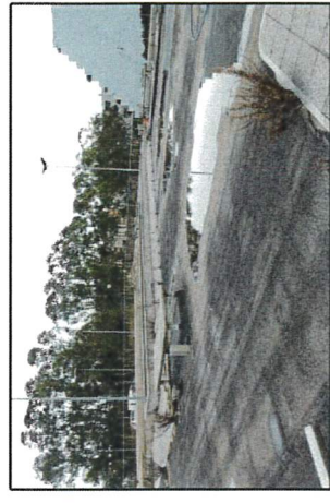
Vista generale del livello terra rialzato

DATI URBANISTICI: Sup. totale = 1.600,00 mq Sup. netta a parcheggio = 480,00 mq