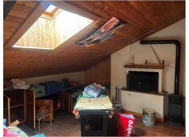
PIANO SECONDO SOTTOTETTO