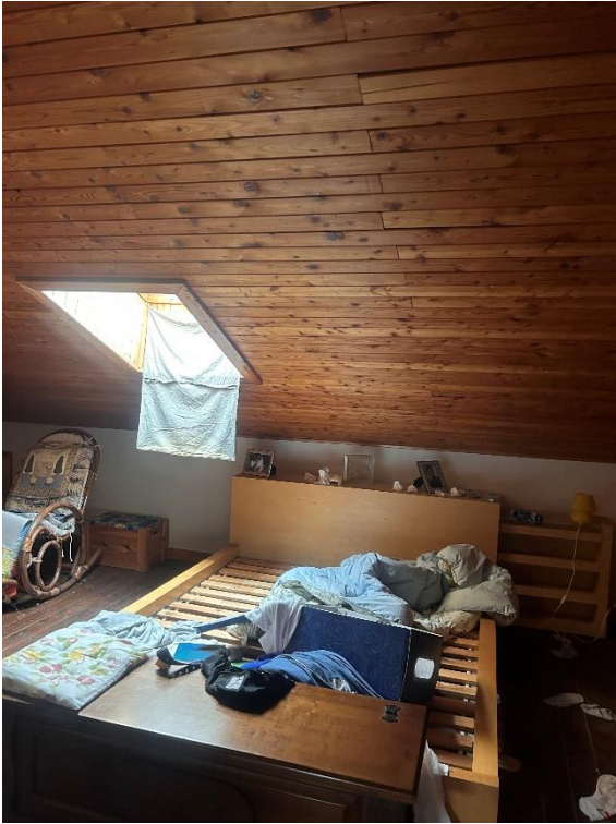
PIANO SECONDO SOTTOTETTO