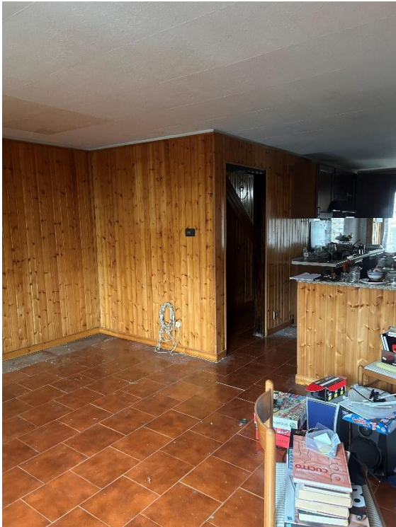
PIANO TERRA SOGGIORNO