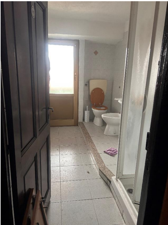
PIANO PRIMO BAGNO