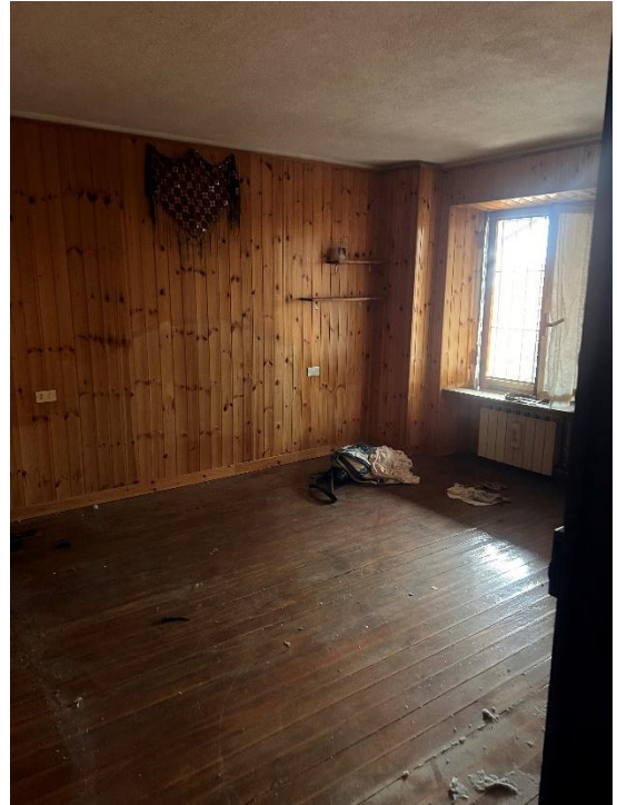
PIANO PRIMO CAMERA