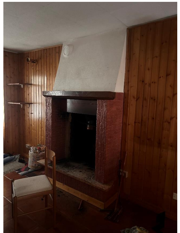
PIANO TERRA CAMINETTO