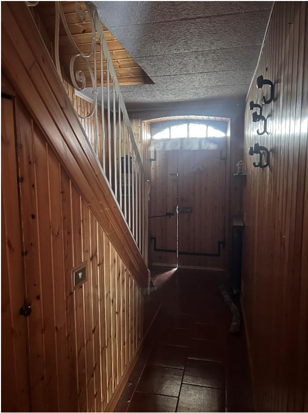
PIANO TERRA INGRESSO