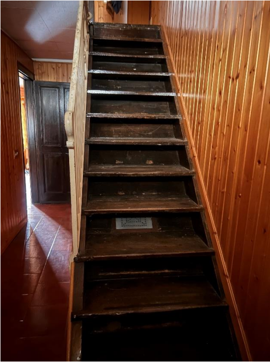
SCALA TRA PIANO TERRA E PRIMO