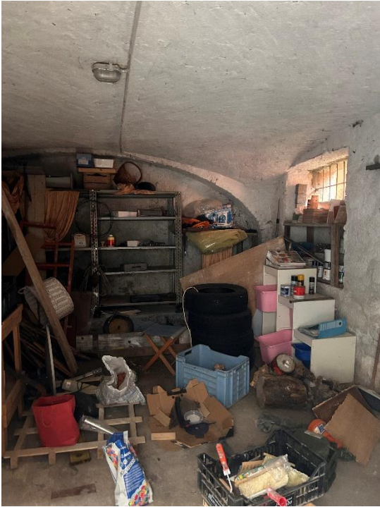
PIANO SEMINTERRATO LOCALE DEPOSITO