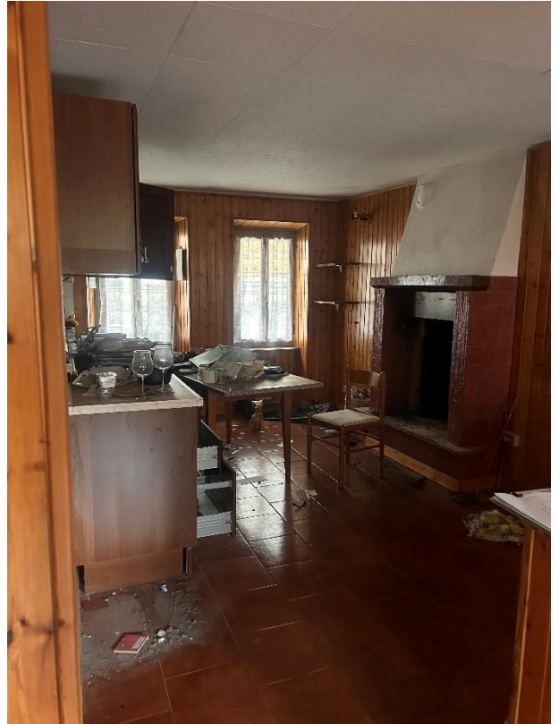
PIANO TERRA CUCINA