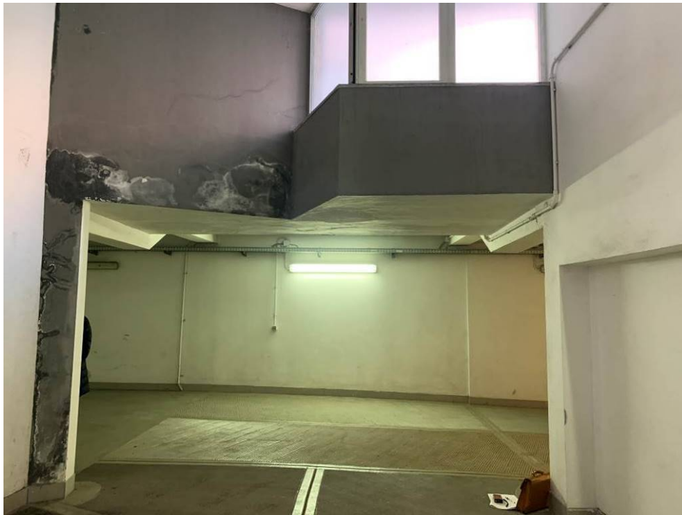
Fotografie n. 12/13 – Viste dei corselli al piano interrato, che conducono alle unità immobiliari A-D-E-F-G-H-I