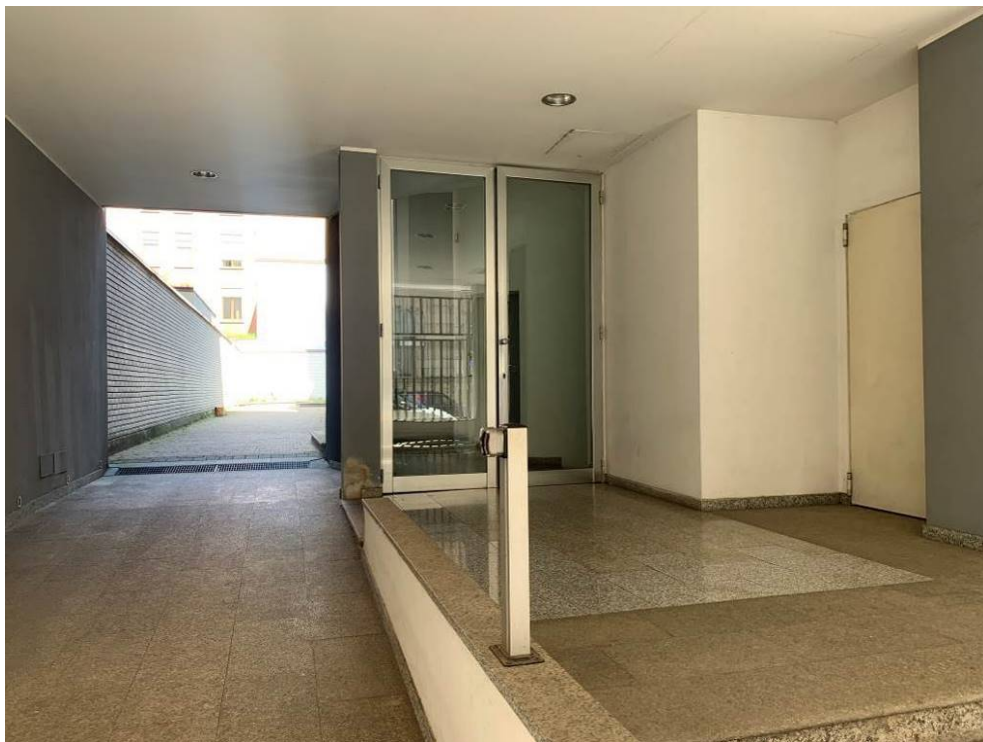
Fotografia n. 5 – Vista dell'atrio di ingresso al Condominio "RIMEMBRANZE 27", con particolare del cortile comune che conduce alle unità immobiliari A-B-L-M e del corpo scale con ascensore per accedere alle unità immobiliari C-D-E-F-G-H-I-N