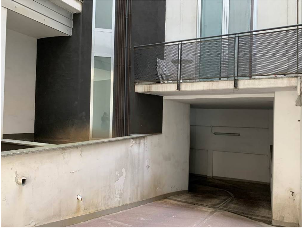
Fotografie n. 10/11 – Viste della rampa, in parte scoperta e in parte coperta, che conduce al piano interrato alle unità immobiliari A-D-E-F-G-H-I