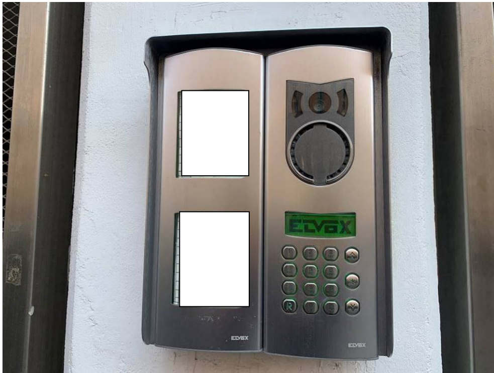
Fotografia n. 2 – Particolare del citofono in corrispondenza dell'accesso su Viale delle Rimembranze di Lambrate, dove non compare il nominativo della debitrice