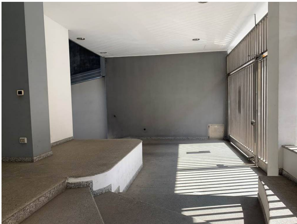
Fotografia n. 9 – Particolare del cancello carraio per accedere alla rampa che conduce al piano interrato alle unità immobiliari A-D-E-F-G-H-I