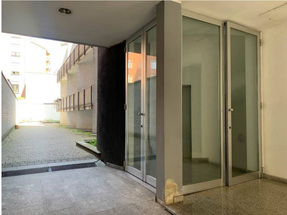
Fotografia n. 6 – Particolare del corpo scale con ascensore per accedere alle unità immobiliari C-D-E-F-G-H-I-N