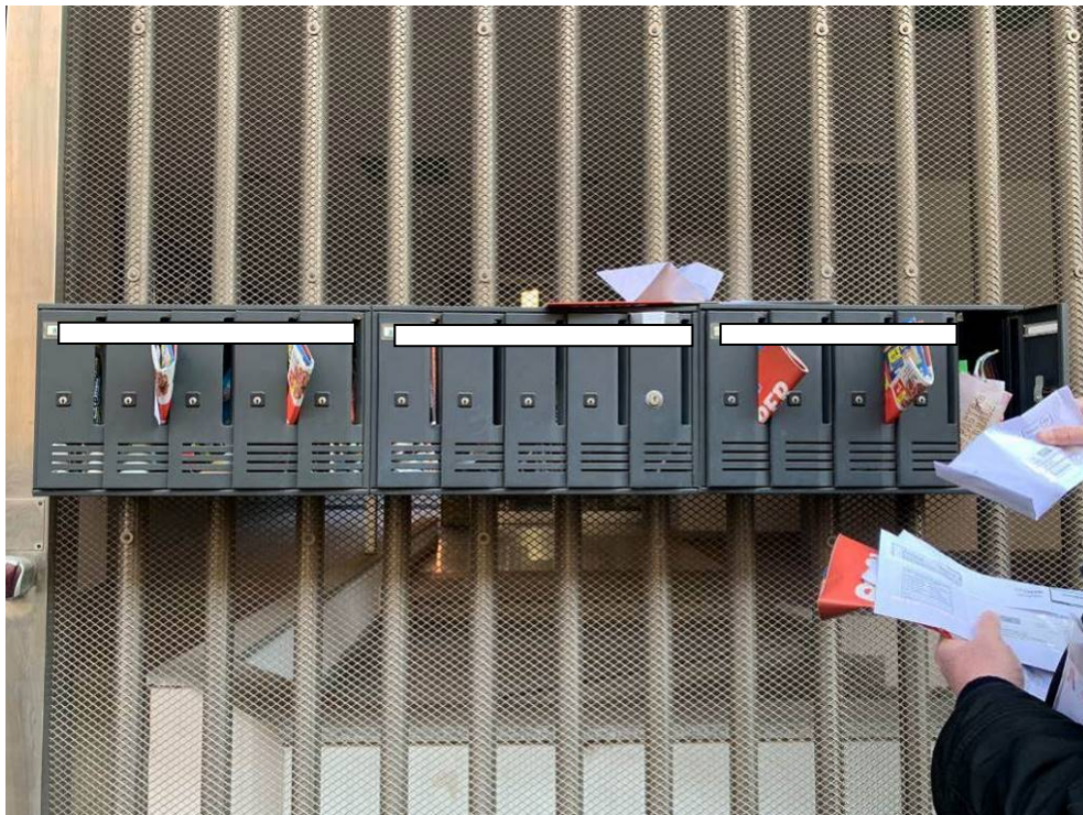
Fotografia n. 3 – Particolare delle cassette delle lettere in corrispondenza dell'accesso su Viale delle Rimembranze di Lambrate, dove compare il nominativo della debitrice