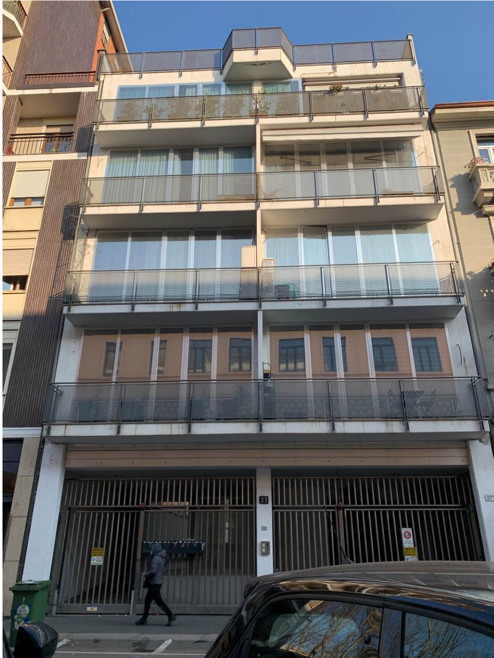
Fotografia n. 1 – Vista del prospetto principale del Condominio “RIMEMBRANZE 27” sito in Milano - Viale delle Rimembranze di Lambrate n. 27