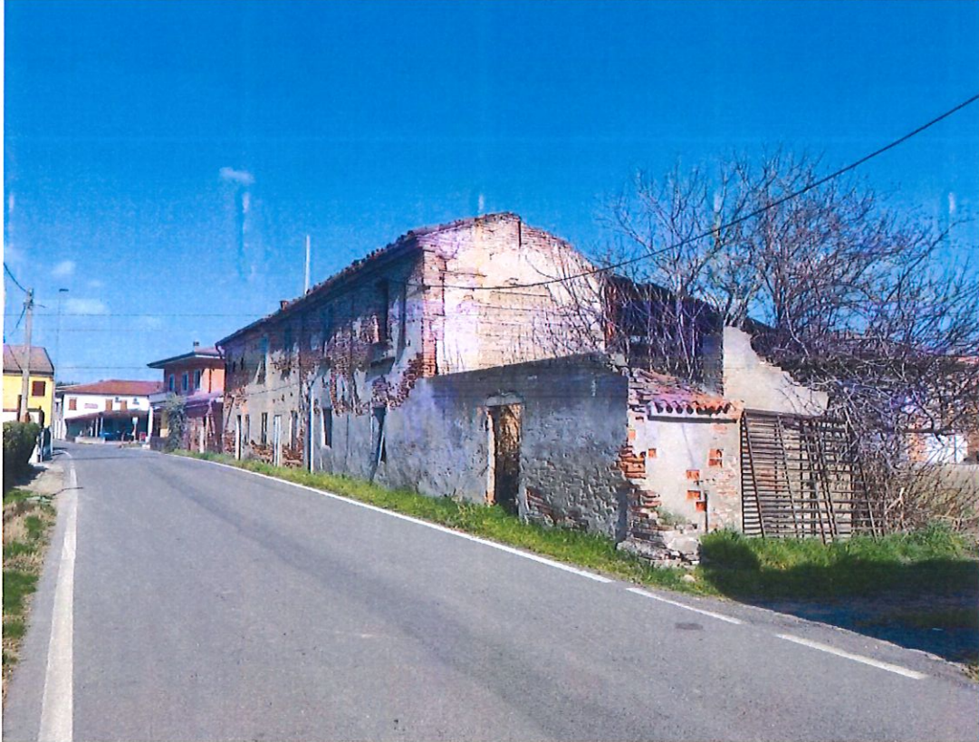
Capannoni fatiscenti in Comune di S. Pietro di Legnago Via Casoni Rampin