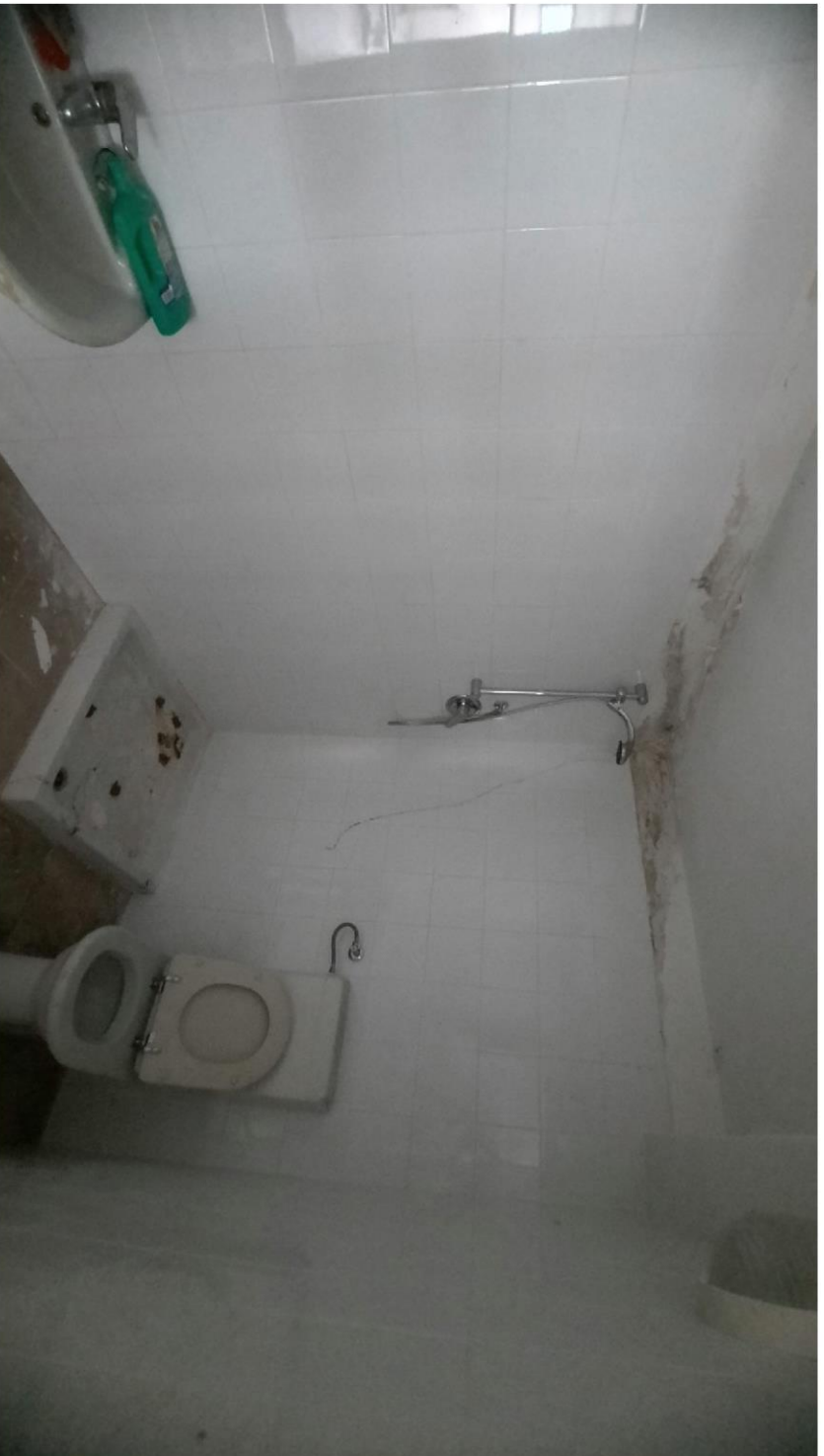
foto 22 - Servizio igienico garage al piano secondo sotto-strada