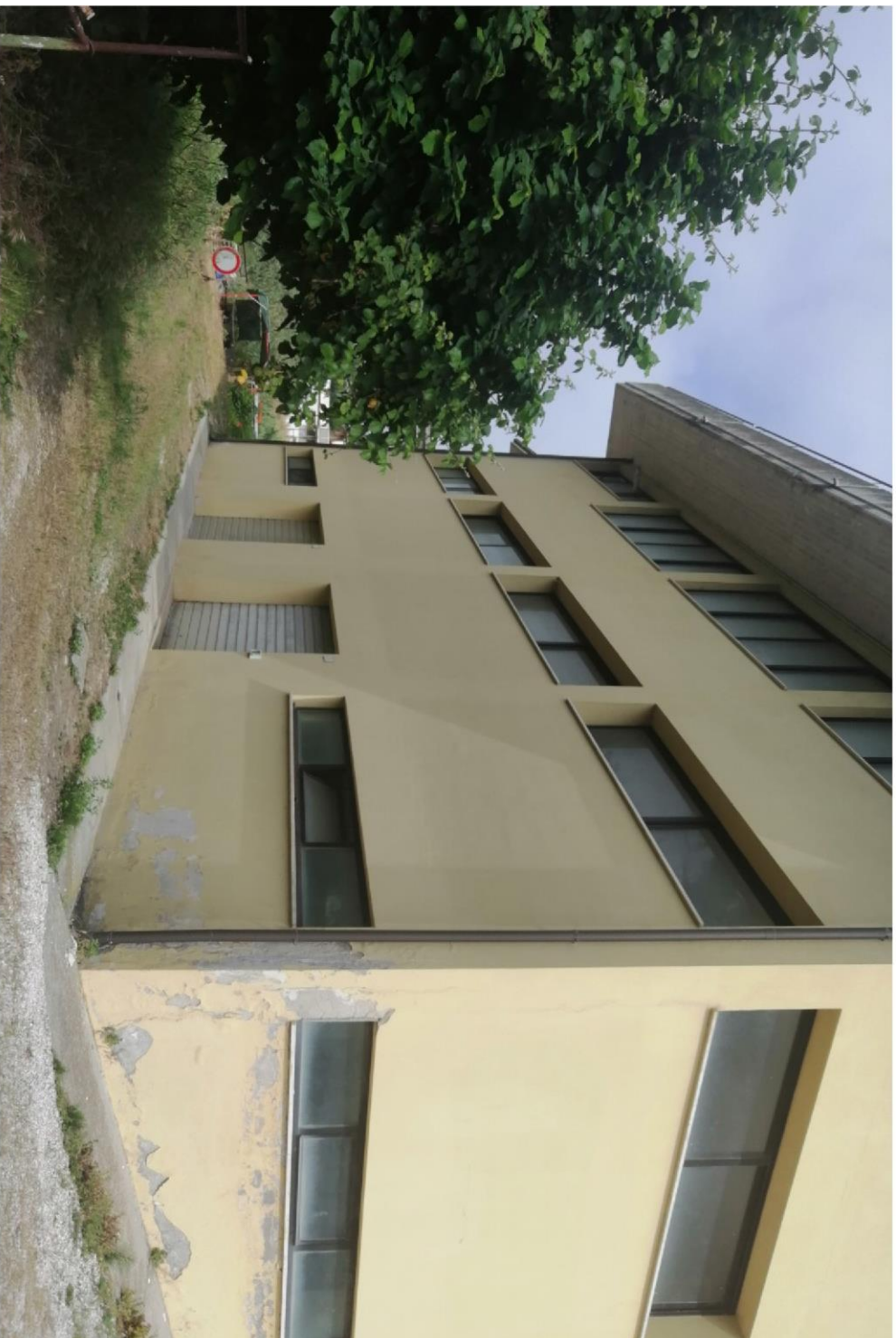
foto 4 - Prospetto nord fabbricato