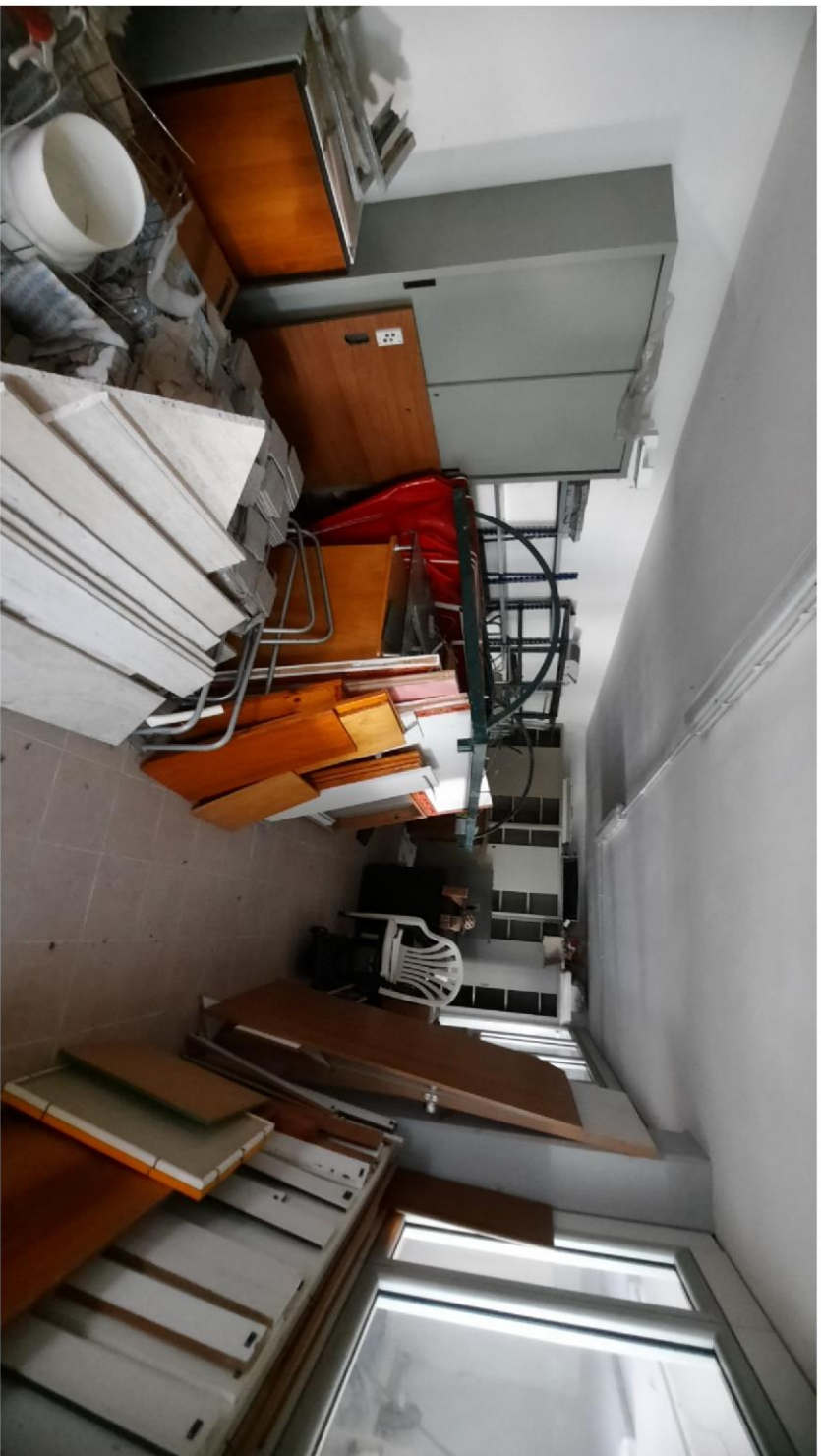
foto 19 - 20 - Garage al piano secondo sotto-strada