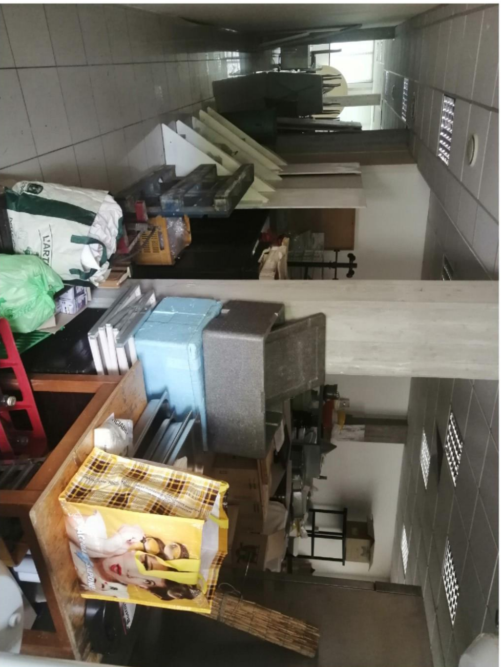
foto 11 - 12 - Negozio al piano terra