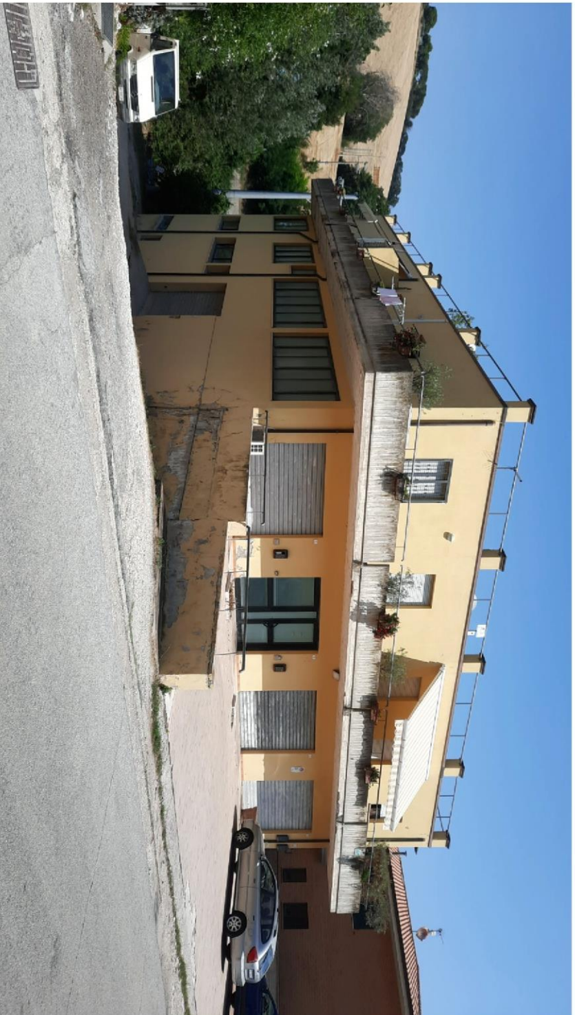
foto 3 - Prospetto ovest fabbricato