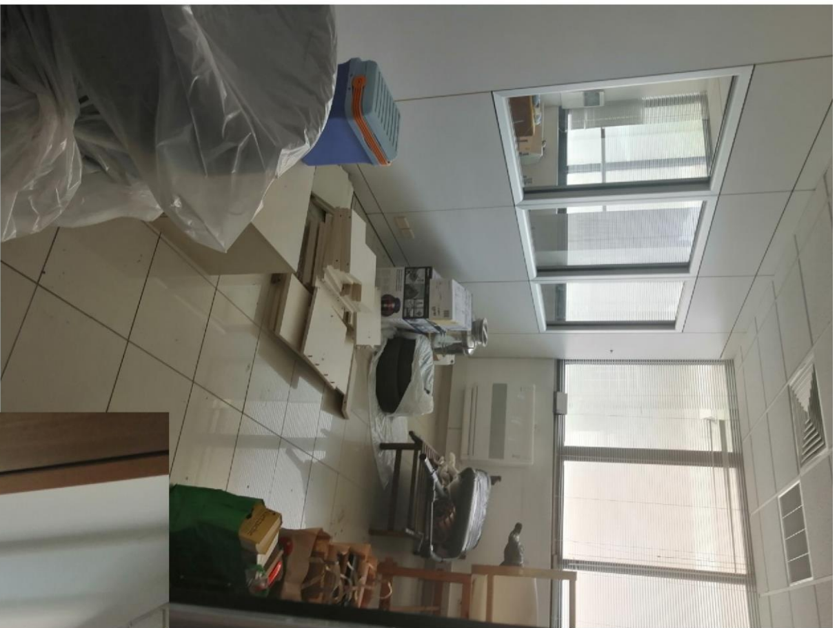
foto 15 - 16 - Negozio al piano terra