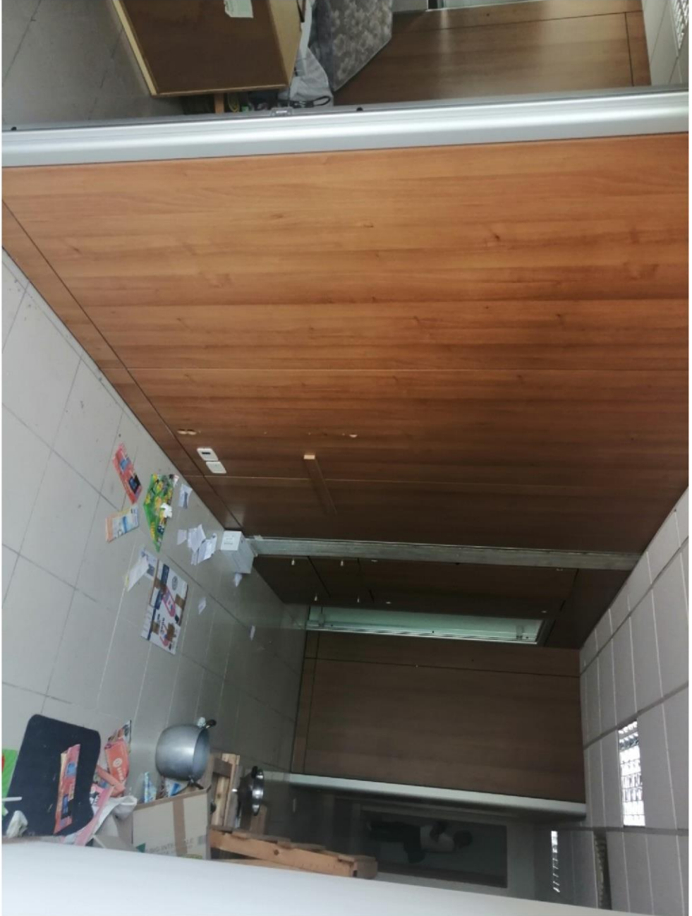
foto 13 - 14 - Negozio al piano terra