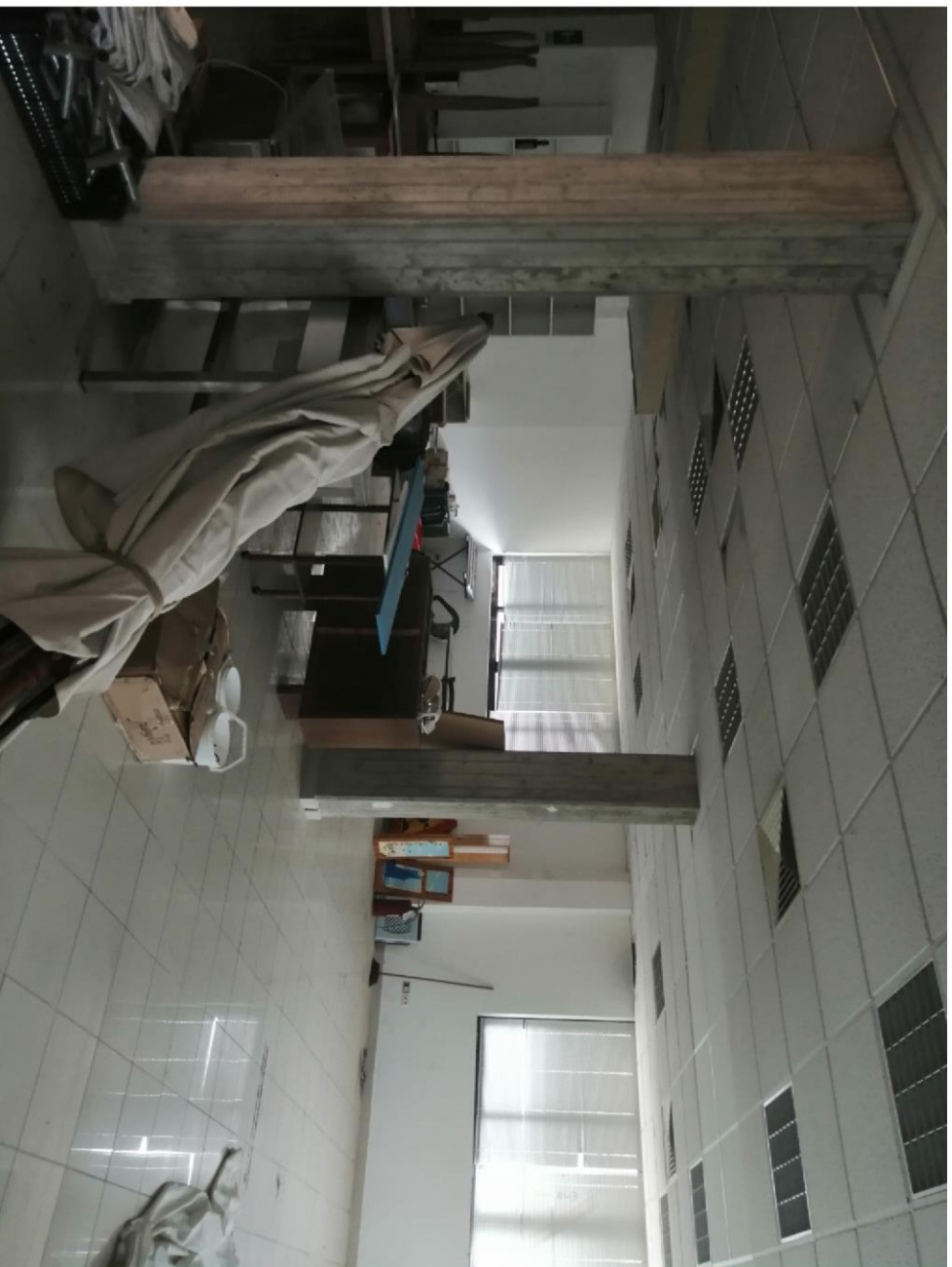
foto 7 - 8 - Laboratorio al piano terra