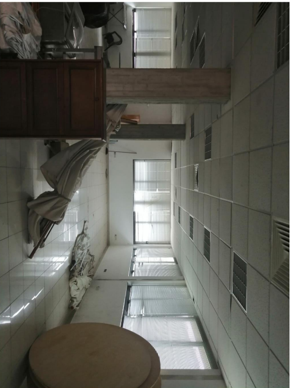
foto 5 - 6 - Laboratorio al piano terra