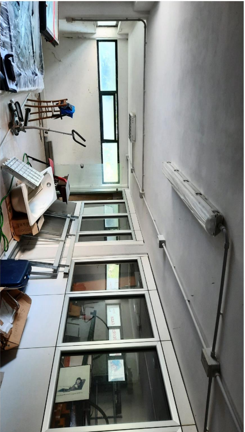
foto 21 - Garage al piano secondo sotto-strada