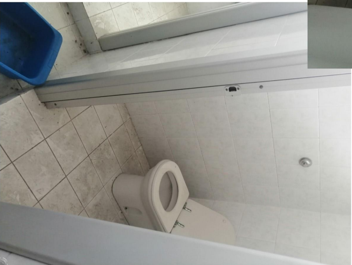
foto 9- 10 - Servizi igienici laboratorio