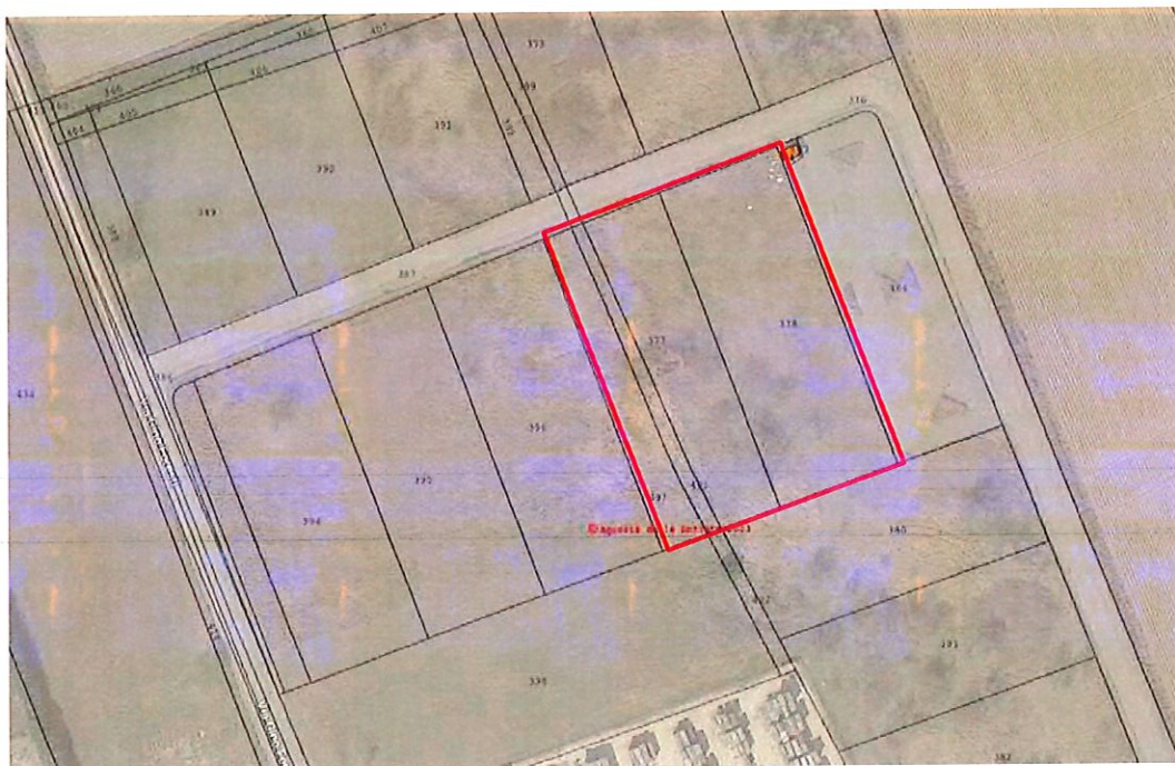
Figura 2: sovrapposizione estratto di mappa e immagine satellitare