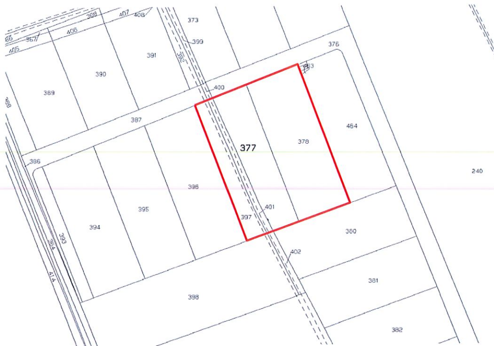
Figura 1:estratto di mappa

Per completezza si riporta nel seguito stralcio di mappa catastale: