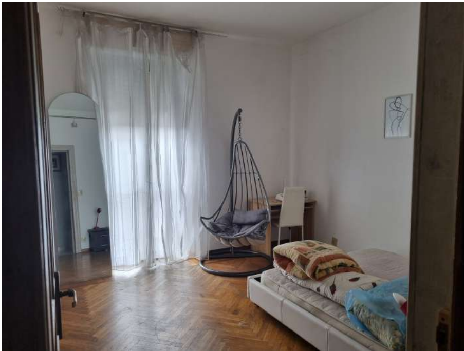
CAMERA ADIACENTE CUCINA SU CORRIDOIO