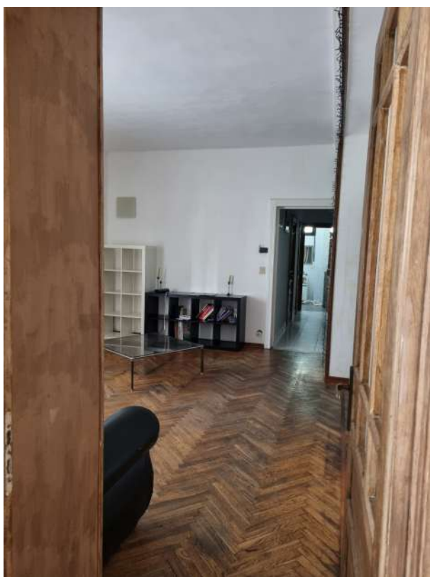
DALL'INGRESSO VERSO SOGGIORNO