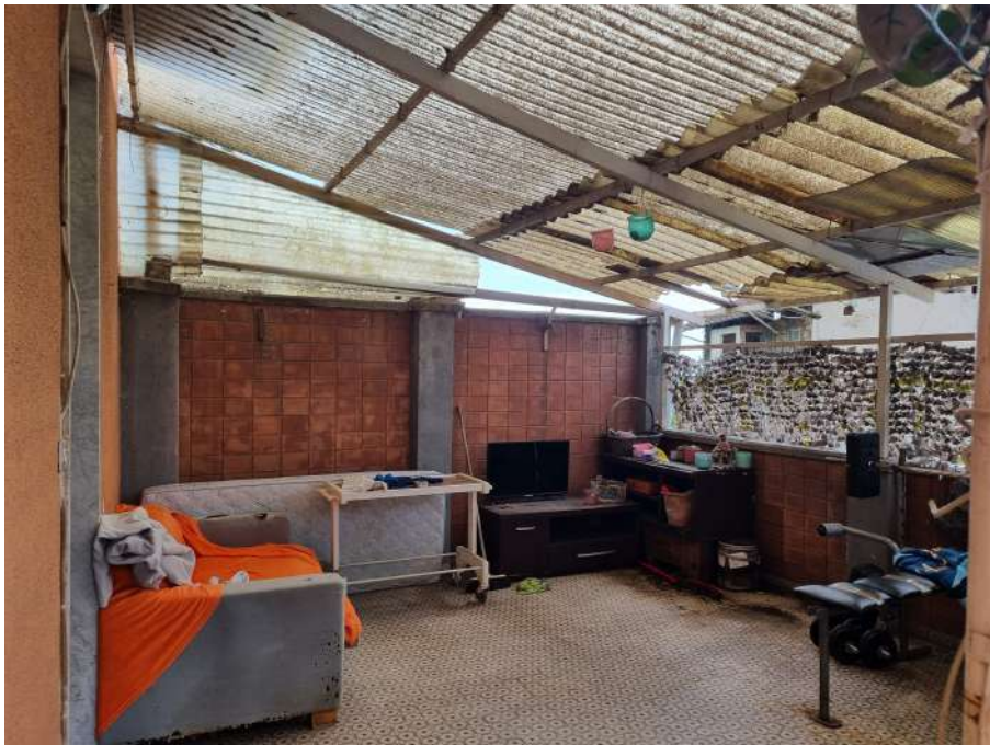
TERRAZZO COPERTO CON MATERIALE TRASLUCIDO