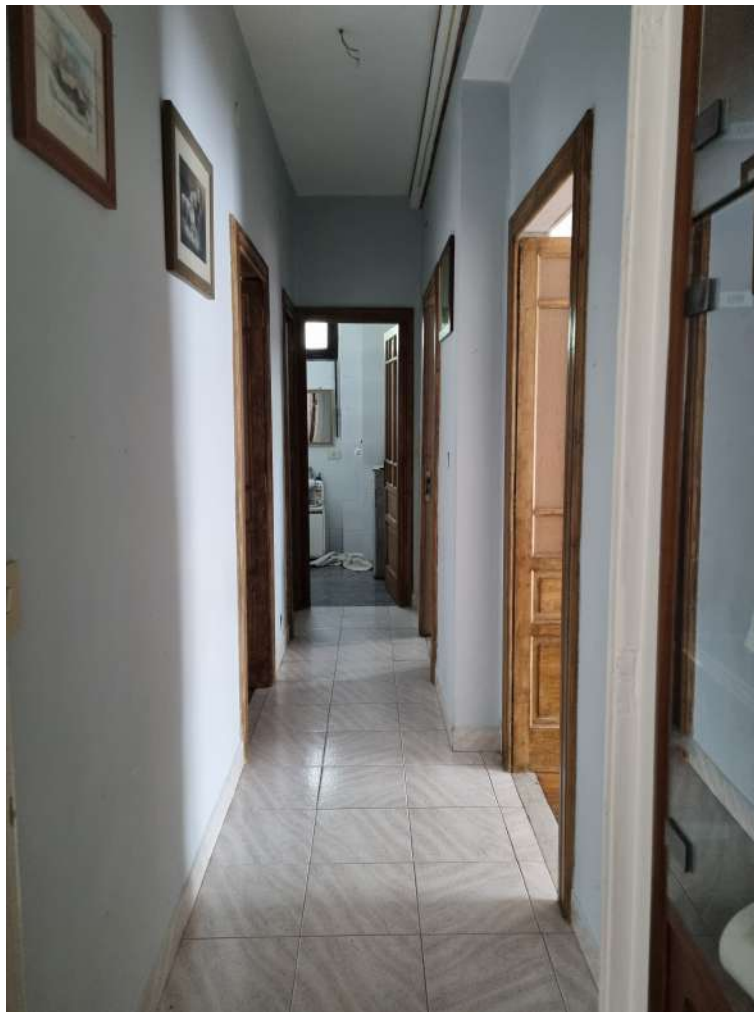
DA SOGGIORNO VERSO CORRIDOIO