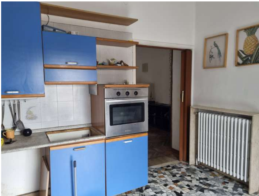
CUCINA VERSO SOGGIORNO