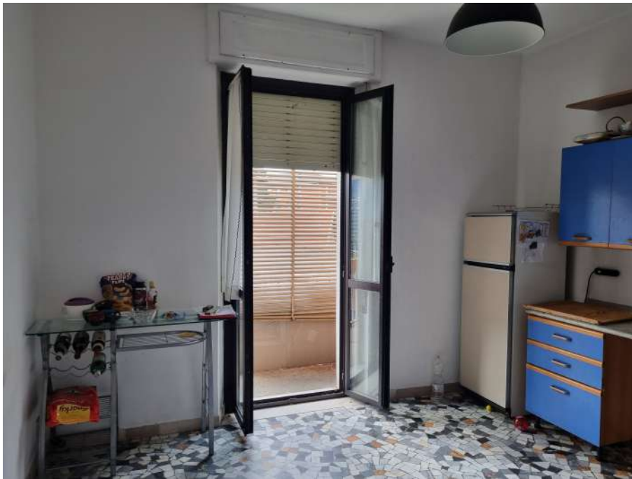
CUCINA VERSO BALCONE