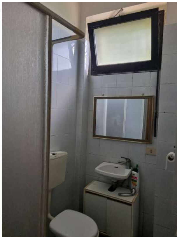
BAGNO N. 2