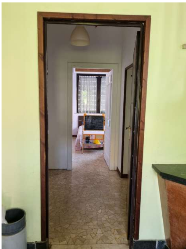
DALL'INGRESSO COMUNE VERSO CAMERA ADIACENTE INGRESSO