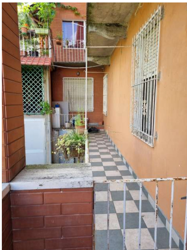
BALCONE A NORD OVEST