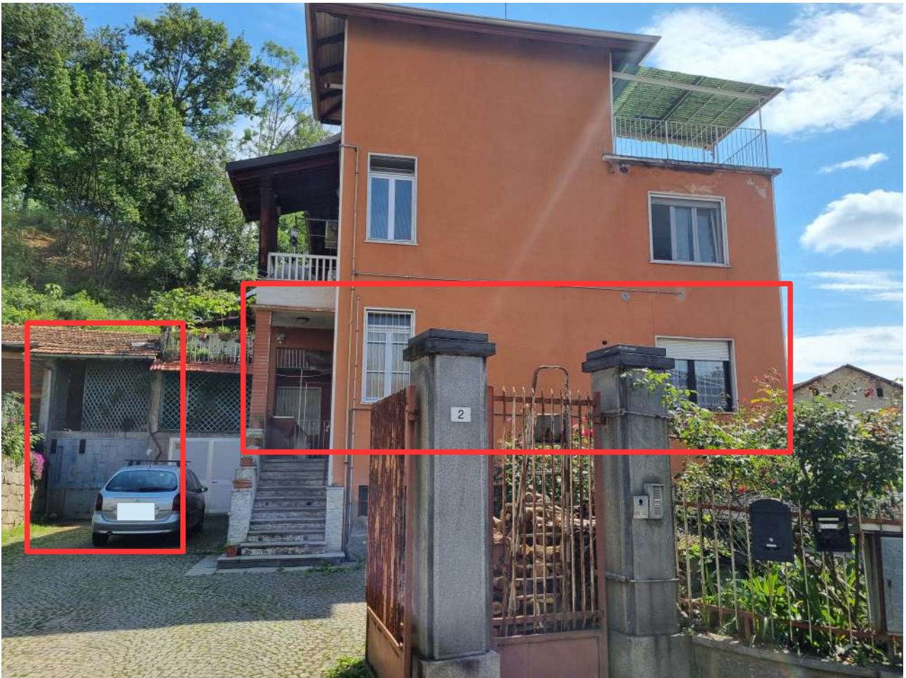
PROSPETTO SULLA VIA OROPA