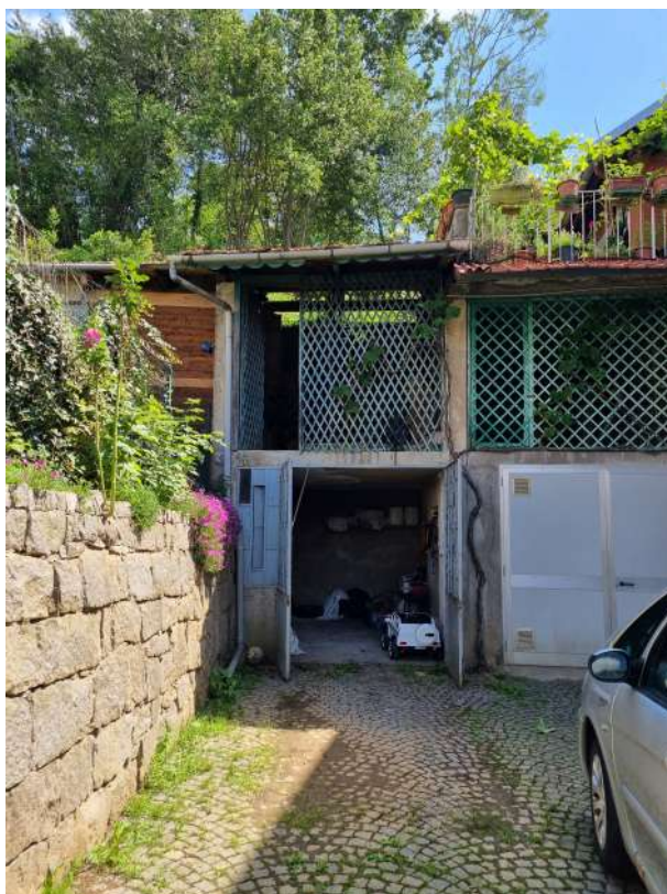
AUTORIMESSA CON SOVRASTANTE LEGNAIA