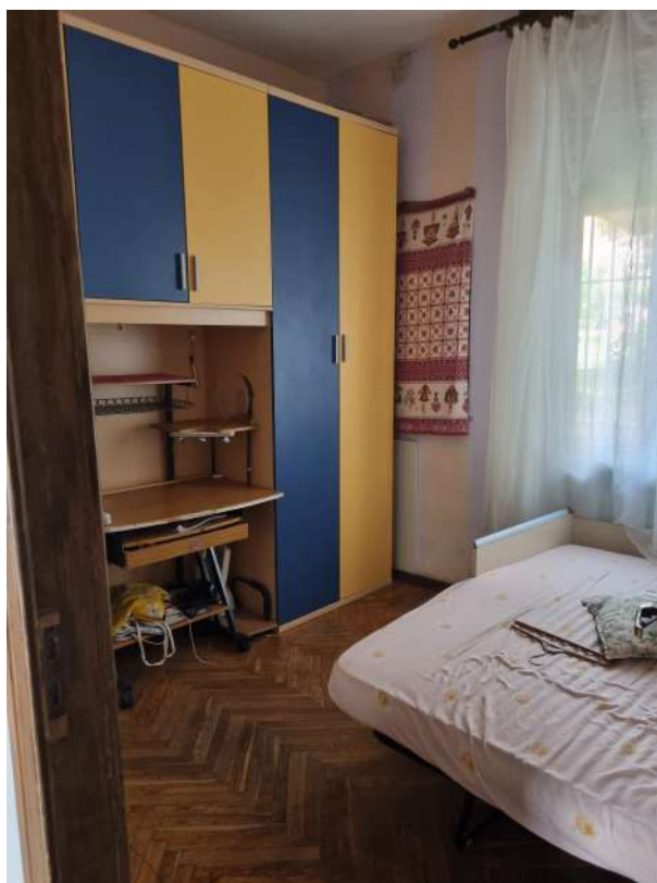
CAMERA VERSO OVEST