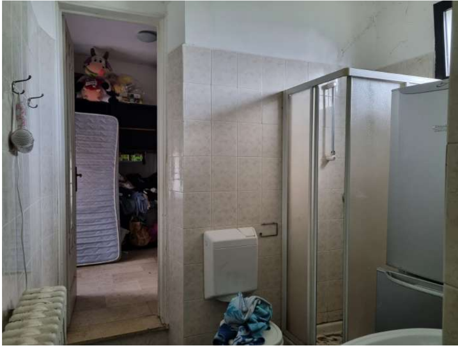
BAGNO VERSO RIPOSTIGLIO