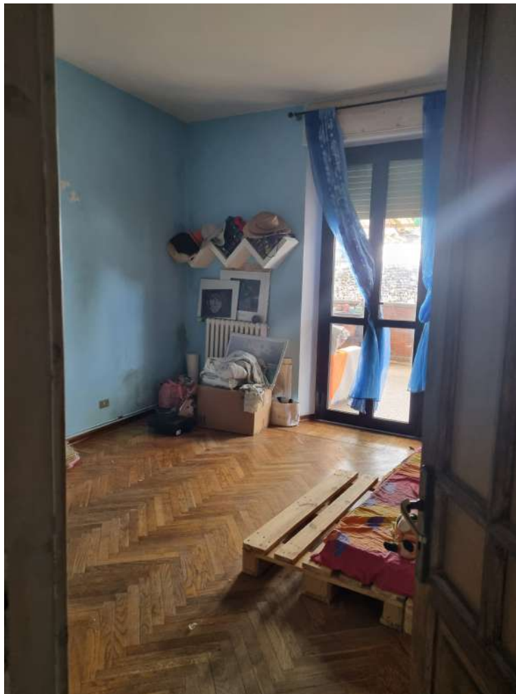
CAMERA SU TERRAZZO