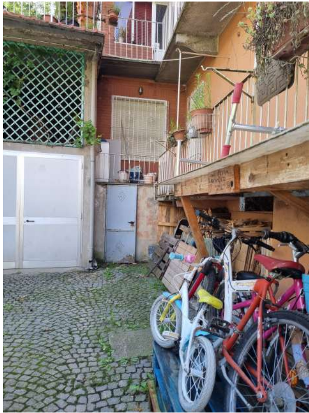
EX LOCALE DI SGOMBERO E BALCONE