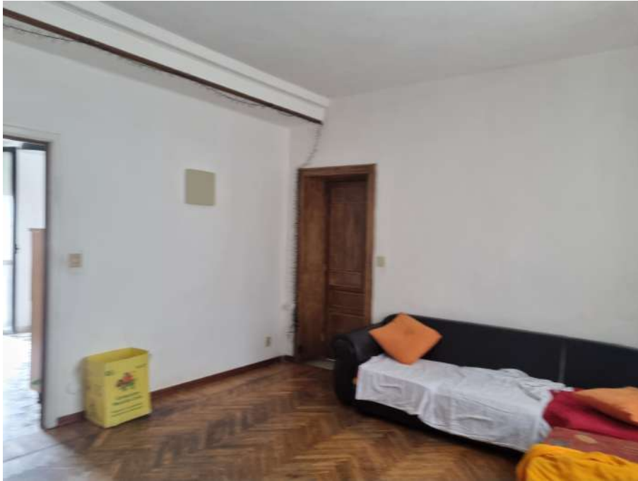
SOGGIORNO VERSO CUCINA