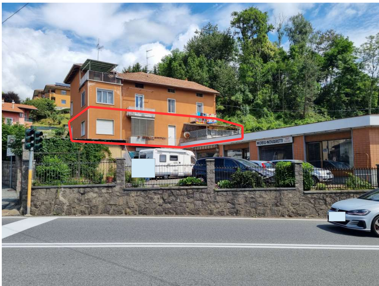
PROSPETTO SULLA VIA MARTIRI DELLA LIBERTA'