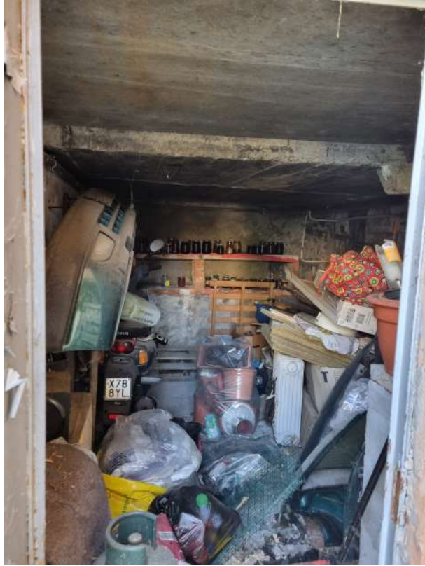
EX LOCALE CALDAIA – LOCALE DI SGOMBERO