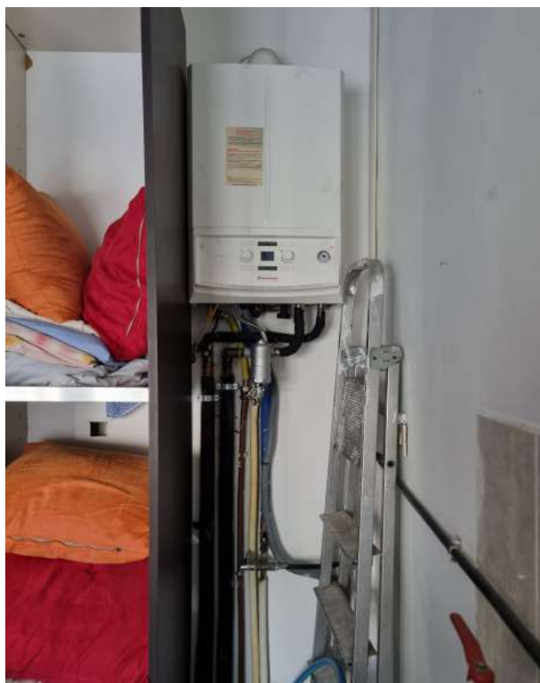
CALDAIETTA MURALE NEL RIPOSTIGLIO