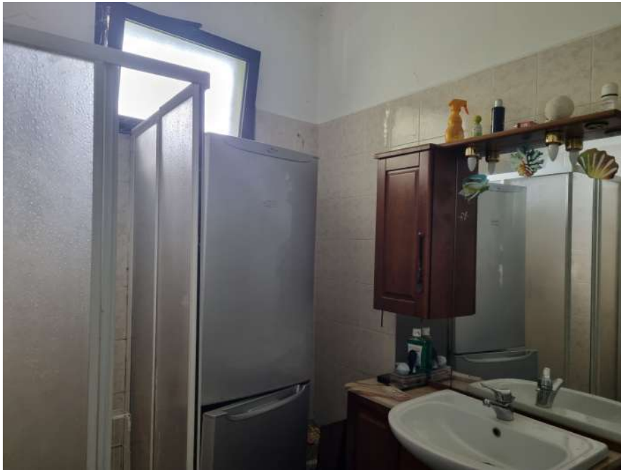
BAGNO VICINO A RIPOSTIGLIO