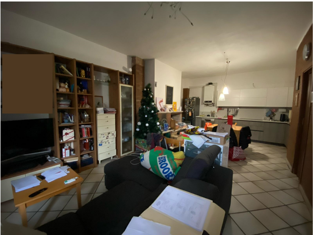
PIANO TERRA - Soggiorno/pranzo