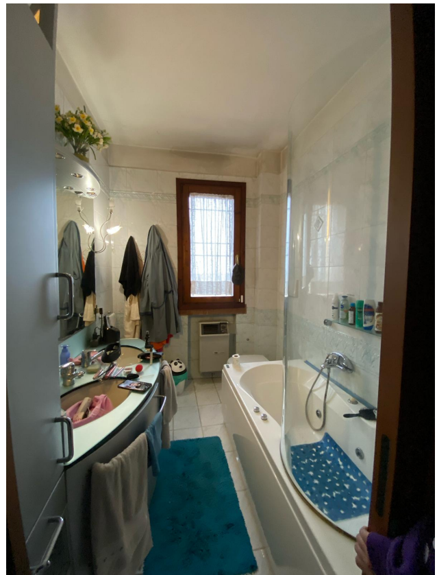
Bagno al piano primo