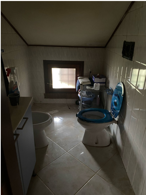
Piano secondo - Bagno