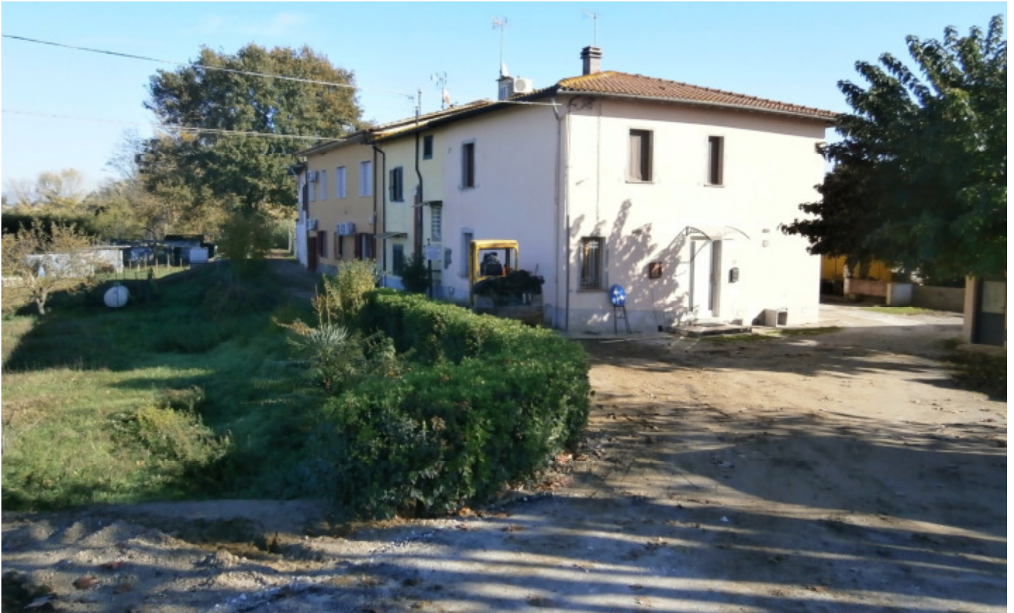
e1- Inquadramento del piccolo aggregato di cui fa parte l'immobile oggetto di pignoramento