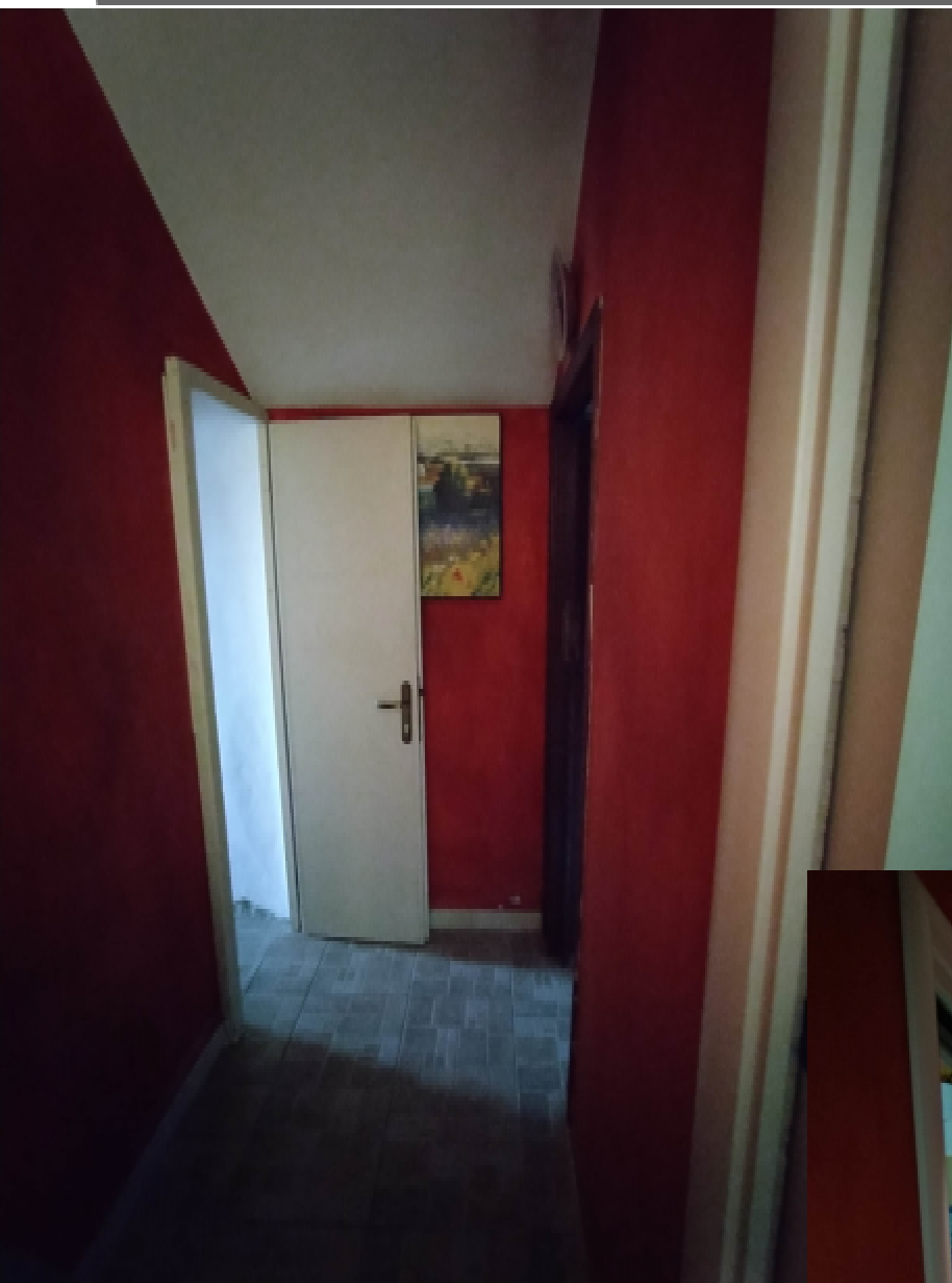
4—Il Disimpegno unito all'Ingresso