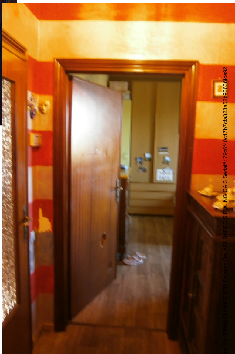
13—Disimpegno 2; al centro, la Camera 1