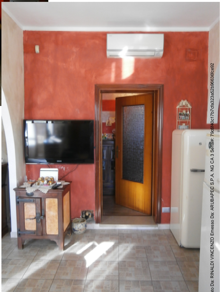
7—Il Pranzo; Si intravedono le grandi arcate a sinistra verso la Cucina e a destra verso l'Ingresso/Disimpegno

Firmato Da: RINALDI VINCENZO Emesso Da: ARUBAPEC S.P.A. NG CA 3 Serial#: 79c6140c17b7cfa323a52b966636fce92