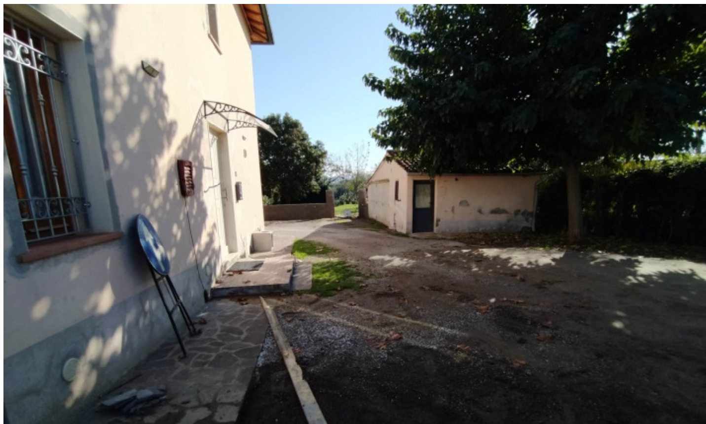
e4- Area esterna con diritto di passo