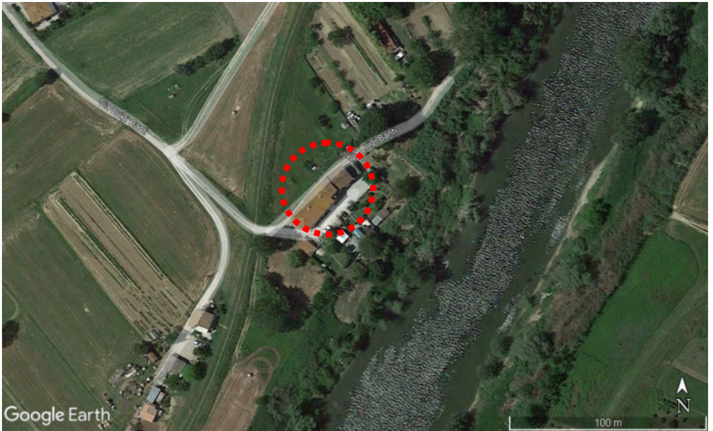
Viste dall'alto Google – Inquadramento dei beni nel contesto territoriale di Fucecchio.