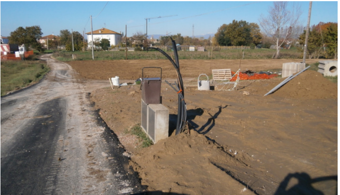
e2- Vista della diramazione di Via L. Banti, che arriva all'aggregato (alle spalle); si notano i contatori dell'acquedotto