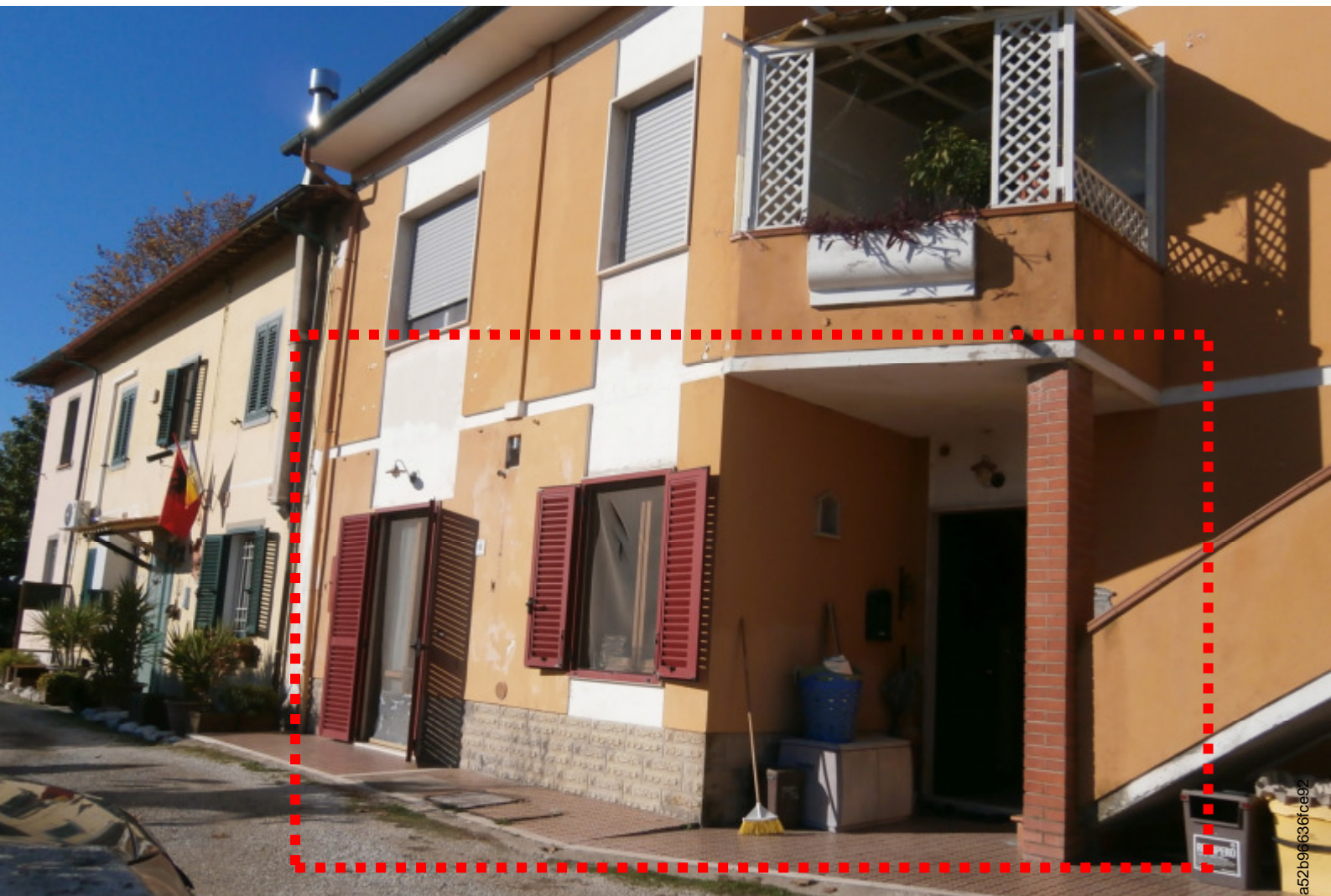
2—L'immobile in Via Banti, 6—Fucecchio;