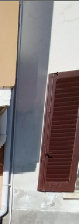
24 —Centrale Termica a comune; l'accesso dal sottoscale