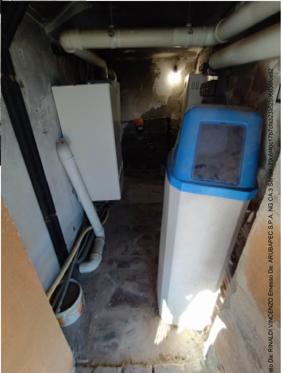
25 —Centrale Termica a comune