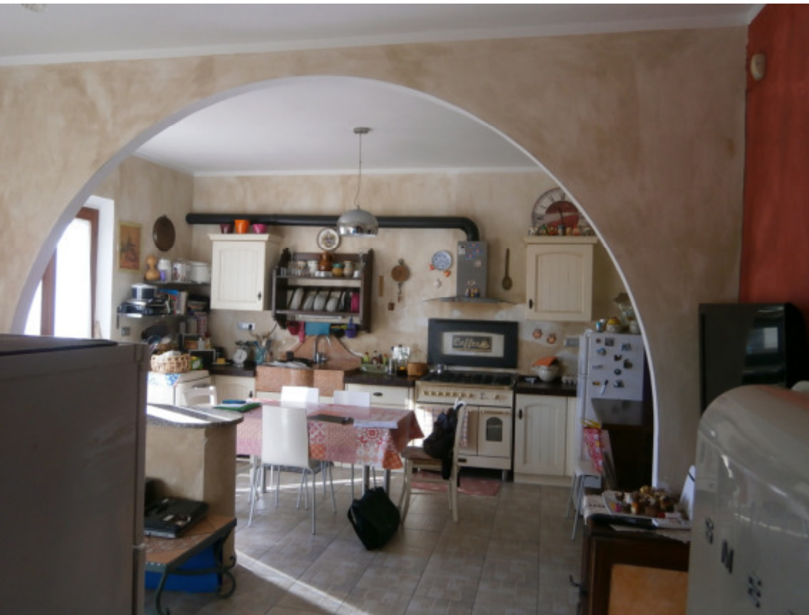
8—La Cucina vista oltre l'arcata del Pranzo