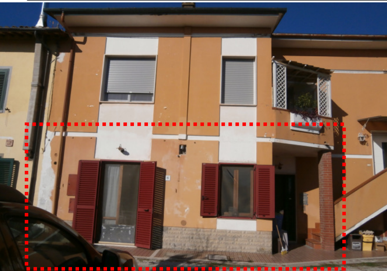
1a —L'immobile in Via Banti, 6—Fucecchio;