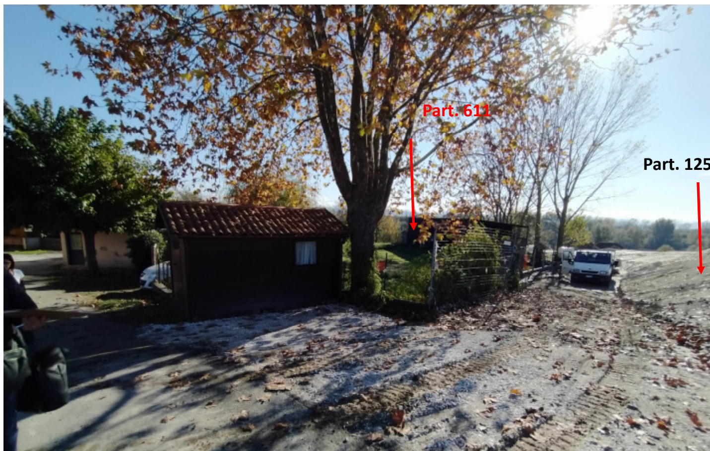
e3- Inquadramento esterno; a destra il Terrapieno (part. 125); al centro la Part. 611