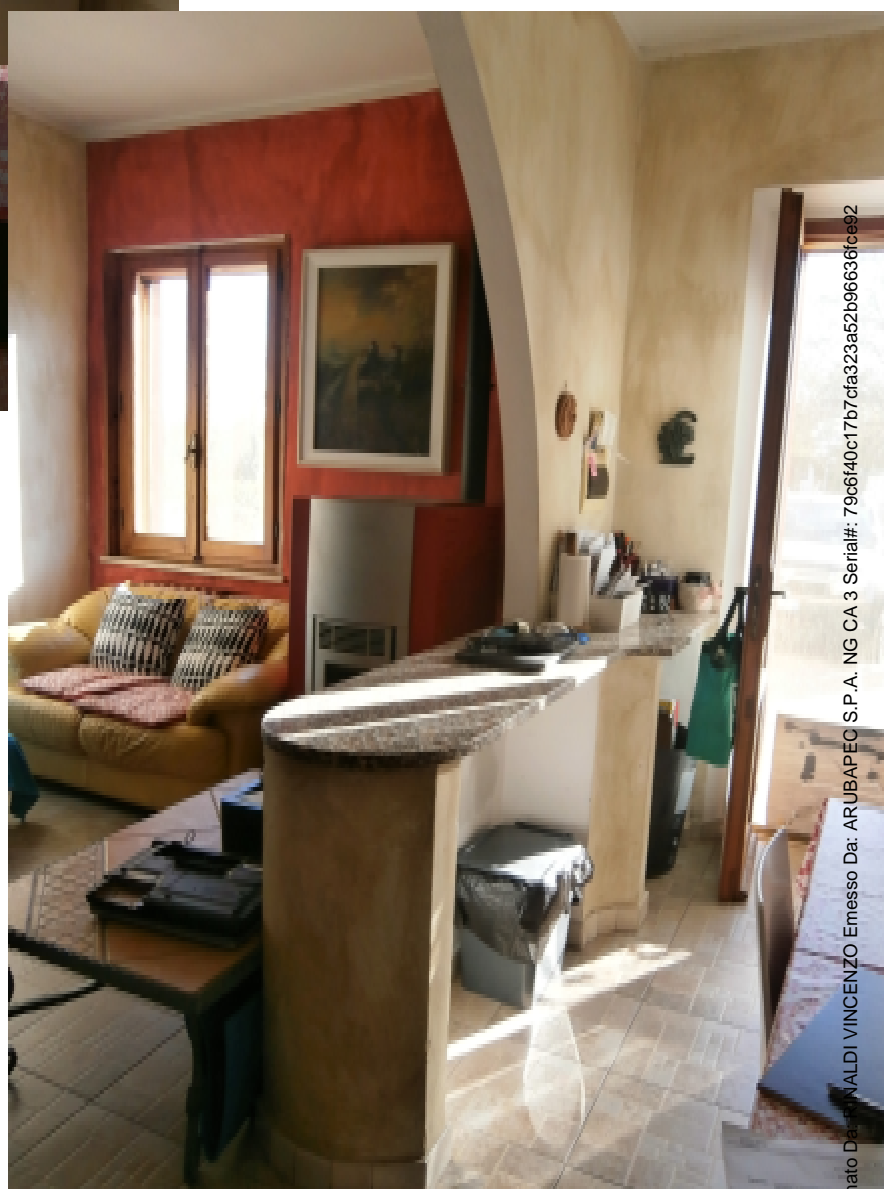
11 —L'arcata che divide la Cucina dal Pranzo