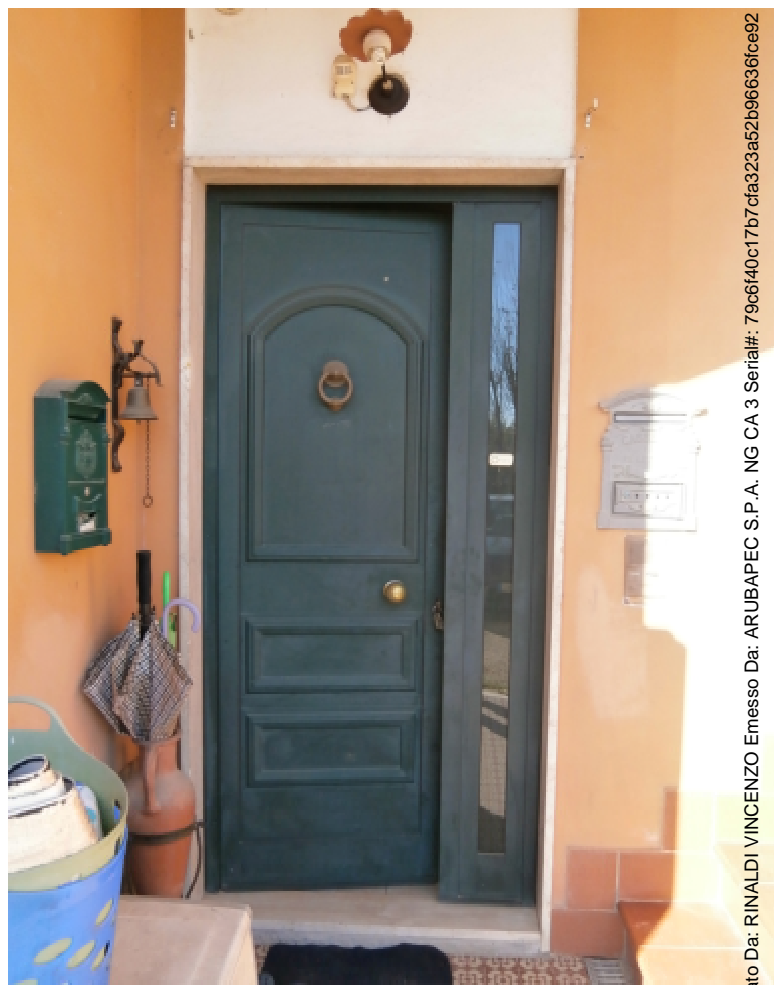
1b —Il portoncino di accesso all'abitazione