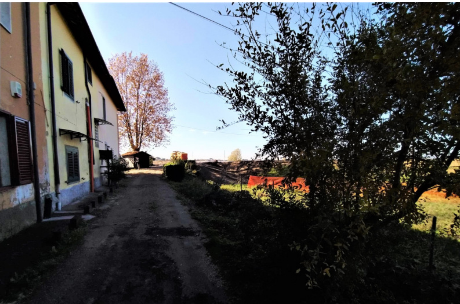
e9 —il retro dei fabbricati, a ridosso con la Part. 611, a destra