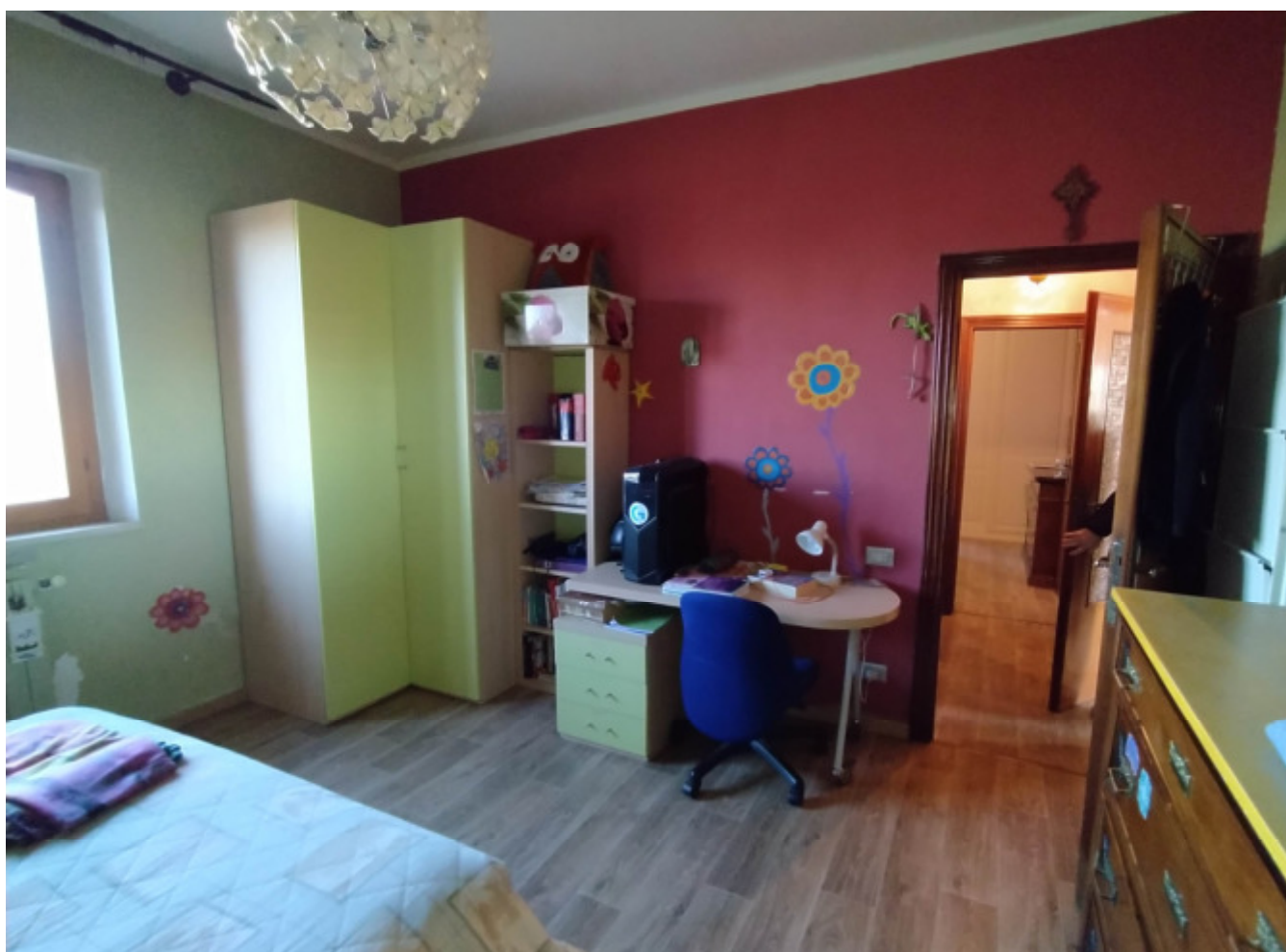
15—Camera 1; la finestra si affaccia sul retro

Firmato Da: RINALDI VINCENZO Emesso Da: ARUBAP S.P.A. NG CA 3 Serial#: 79c6140c17b7cfa323a52b966636fce92