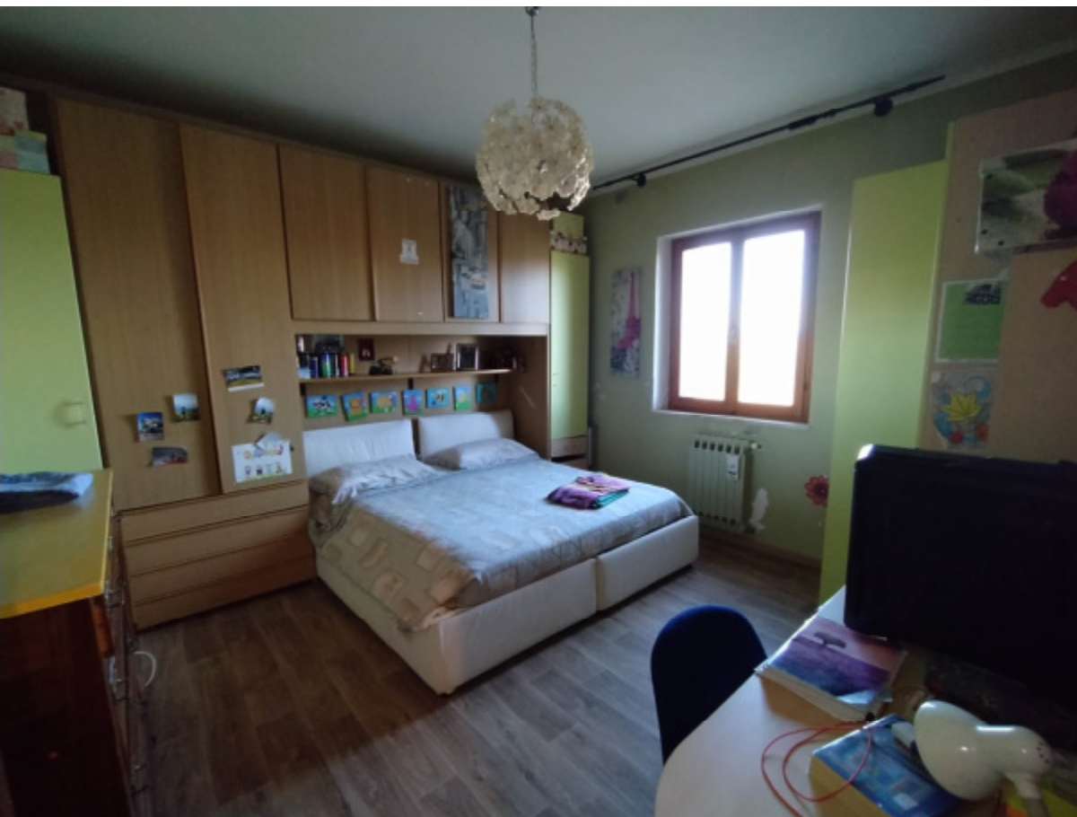
14—Camera 1; la finestra si affaccia sul retro