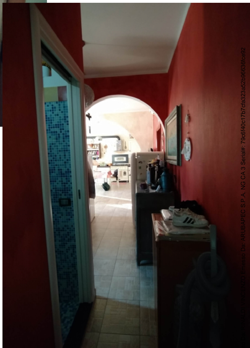
5—Il Disimpegno; vista verso la zona Pranzo-Cucina