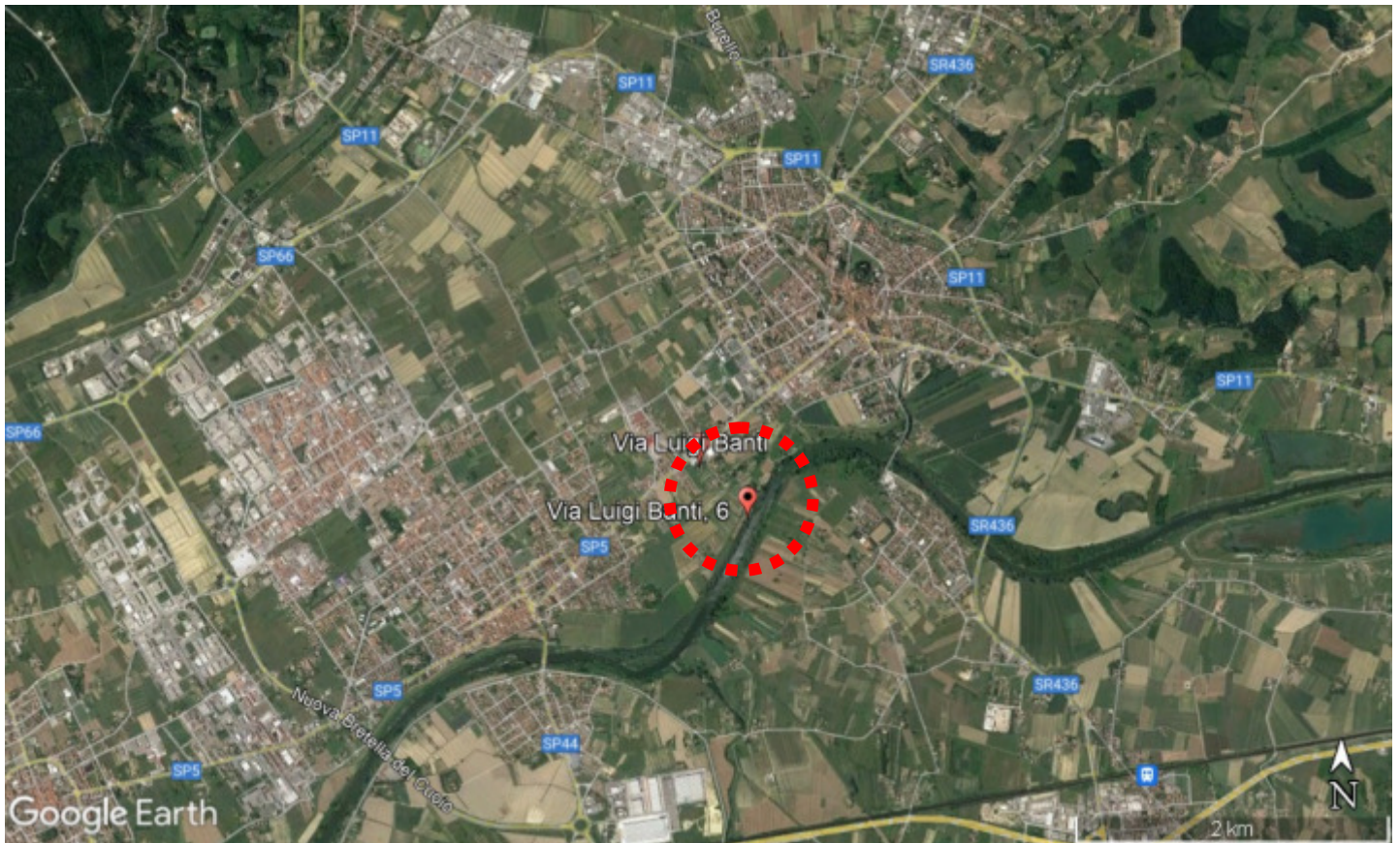
Viste dall'alto Google – Inquadramento dei beni nel contesto territoriale di Fucecchio.