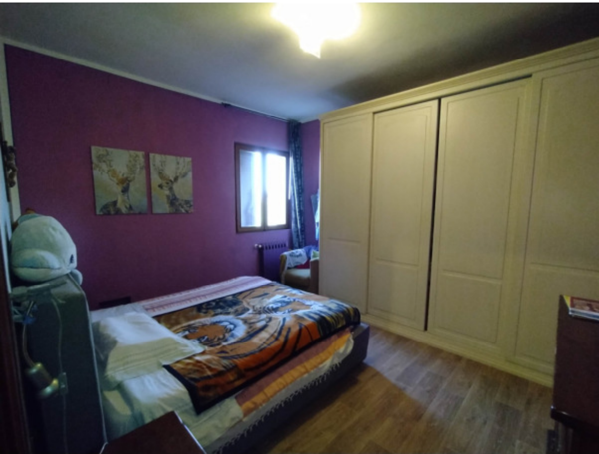
16 —Camera 2; la finestra si affaccia sul retro