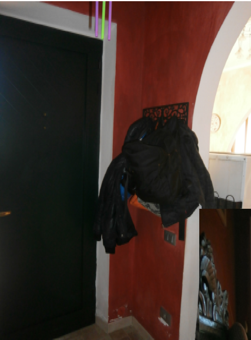
3a-b —L'Ingresso dalla corte a comune