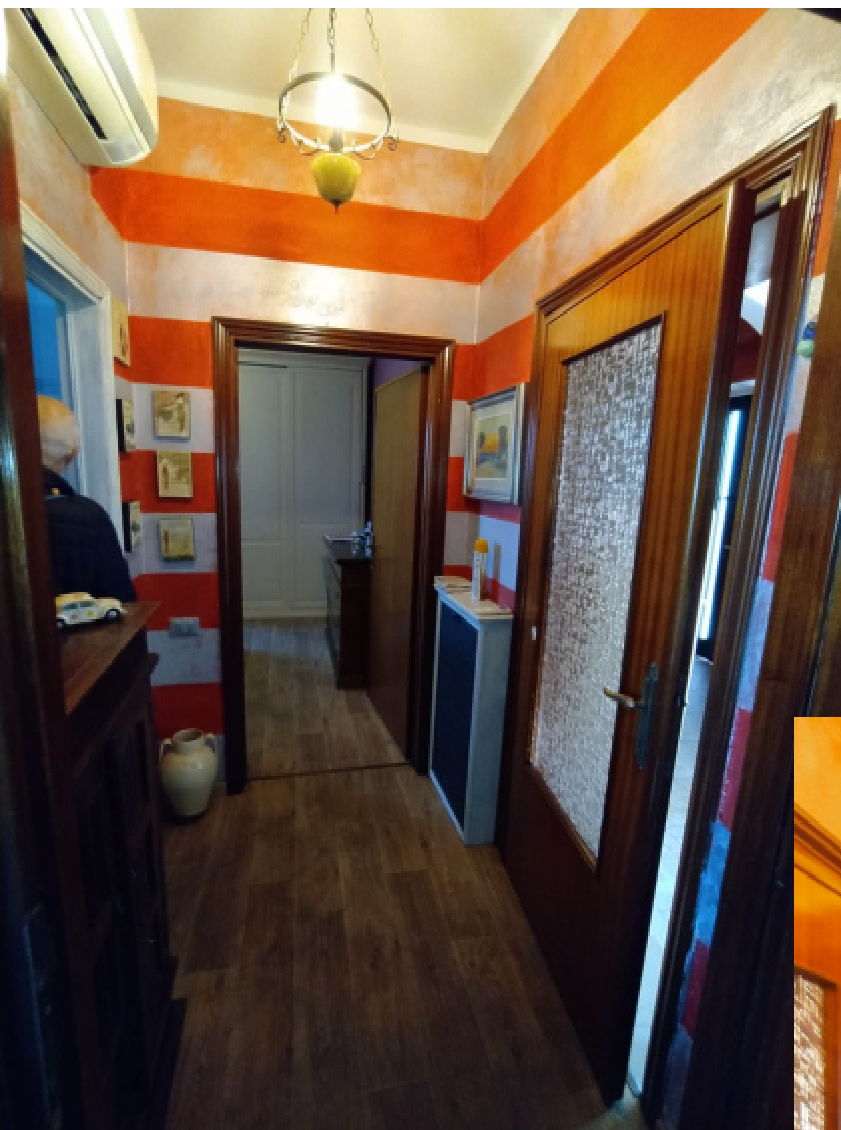
12—Disimpegno 2; a destra la porta del Pranzo, al centro la Camera 2, e a sinistra il Bagno