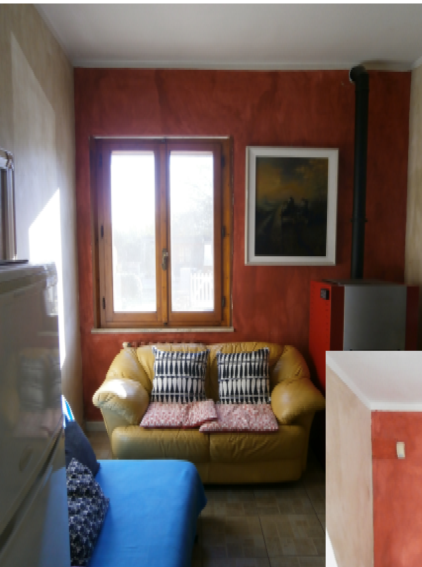
6—Il La zona Pranzo collegata alla Cucina; la finestra si affaccia sulla corte a comune