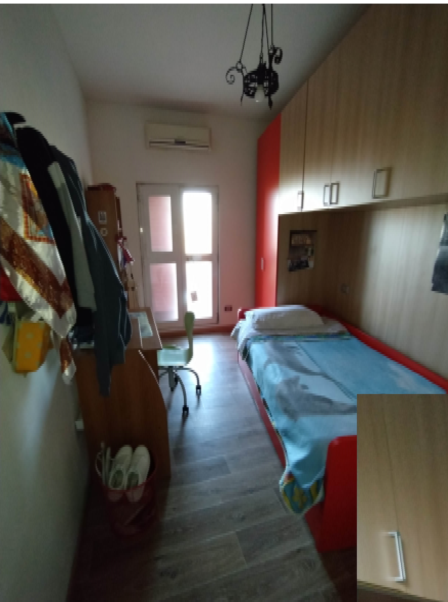
22—Cantina (catastale), utilizzata come Camera