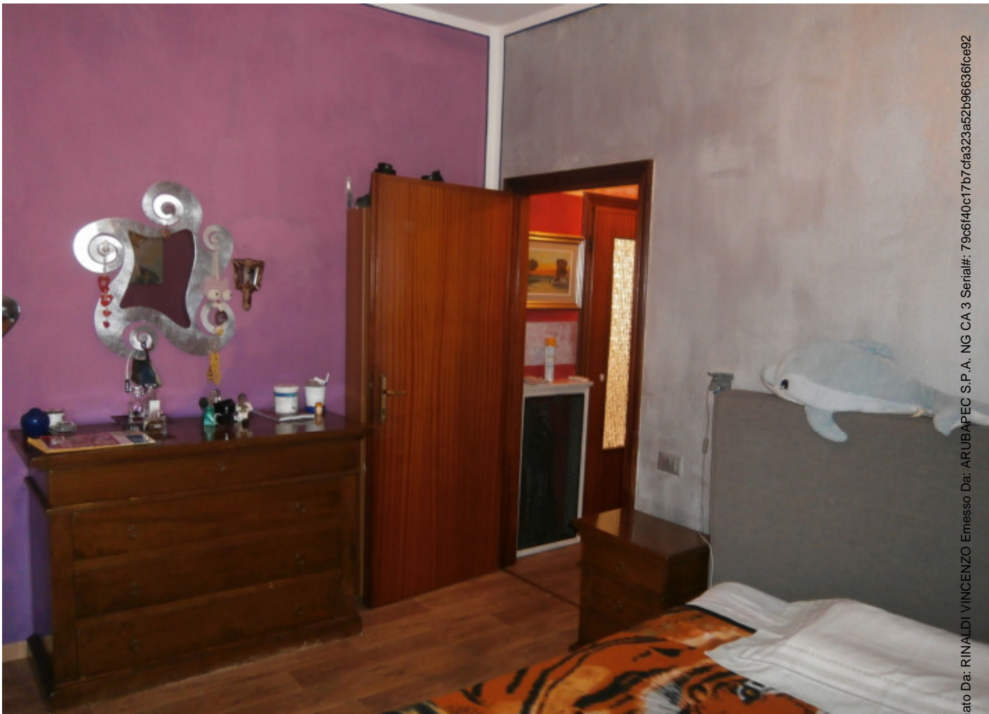
17 —Camera 2;

Firmato Da: RINALDI VINCENZO Emesso Da: ARUBAPEC S.P.A. NG CA 3 Serial#: 79c6f40c17b7cfa323a52b966636fce92